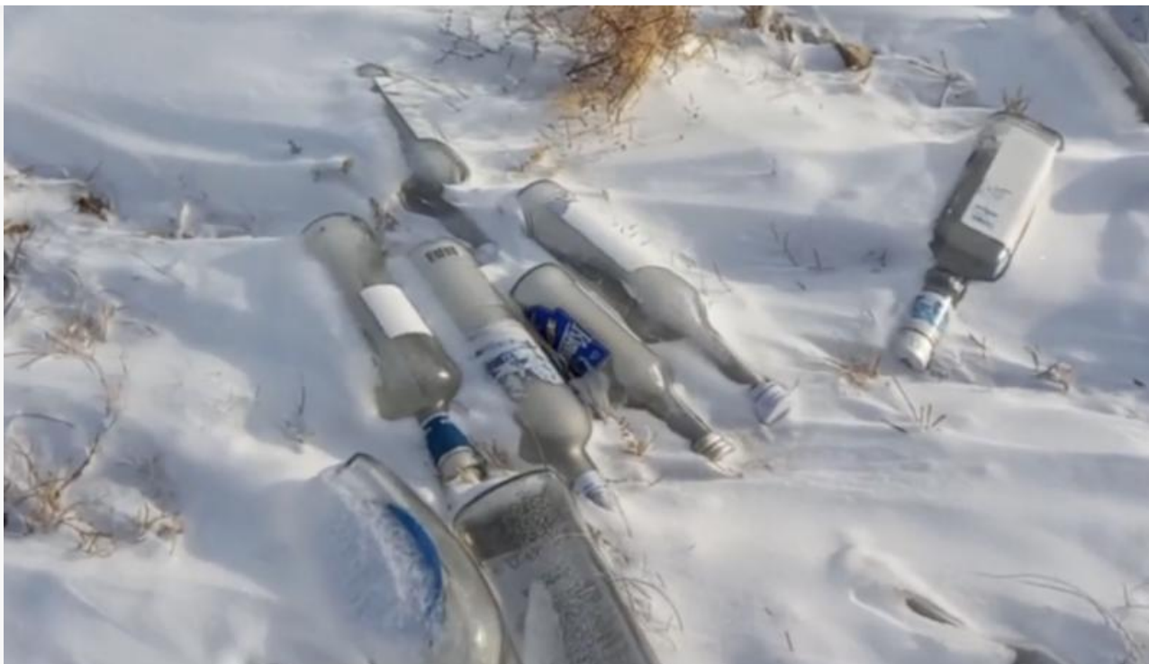
Последствия ещё одной эпидемии в районе...

Формально ответственность распределена чётко между администрацией района, министерством экологии, Россельхознадзором и Роспотребнадзором. Но о скотомогильниках, по всей вероятности, давно позабыли. Но жители до сих пор между собой обсуждают: кто-то ел заражённое мясо и лежал в больнице, кто-то видел, как останки животных свозят в степь, кто-то годами наблюдает, как мусор расплзается по району.