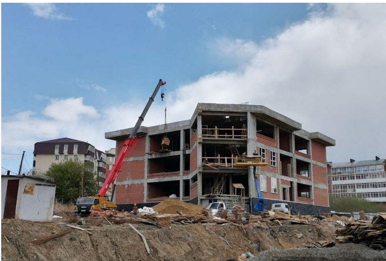
Тот самый долгострой на Багратиона