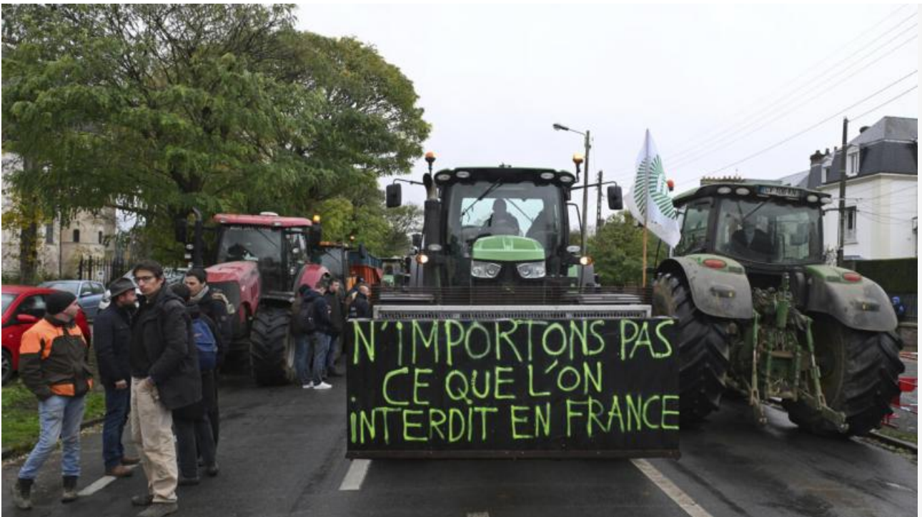
На плакате написано: не ввозите то, что запрещено во Франции

Профсоюзы, организовавшие эту акцию протеста, требуют незамедлительных действий и конкретики. Этот протест не просто локальная вспышка недовольства, а отражение глобальной тенденции происходящих в мире.