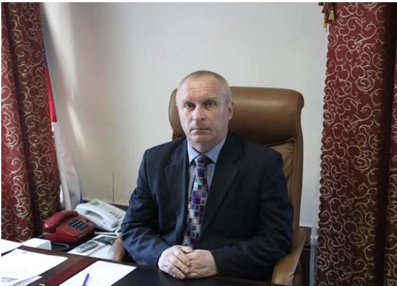
Максим Кудрявцев, мэр Новосибирска

Вторую строчку занимает мэр Новосибирска Максим Кудрявцев. Его главная проблема в том, что он окончательно превратился в тень губернатора и перестал замечать реальные беды города. Пока Андрей