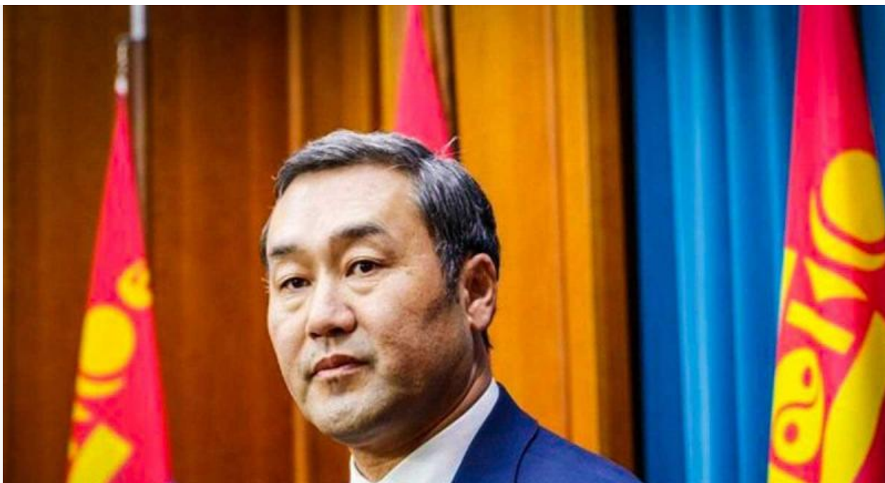
Экс-министр энергетики Монголии Н. Тавинбех

Однако уже на этапе реализации вокруг программы начали накапливаться вопросы. Министерство энергетики выбрало консультантов без широкой публичной дискуссии. Контракт на консультационные услуги превысил девять миллионов долларов. По данным Национального антикоррупционного агентства, работа подрядчиков оказалась неудовлетворительной. Несмотря на это, срок контракта был продлен, а его стоимость увеличена еще на 2,6 миллиона долларов. Следствие считает, что решения принимались с нарушением закона и с прямым злоупотреблением должностными полномочиями.