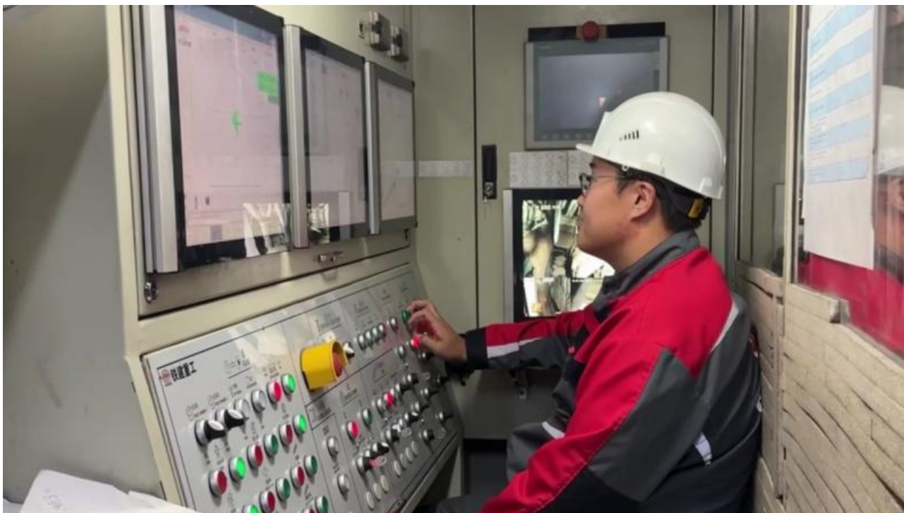
Фото: t.me/krasnliions , скрин сайта Дела, скрин сайта government.ru

Автор: Кирилл Богданович © Babr24.com Источник: https://t.me/krasnliions СКАНДАЛЫ, ТРАНСПОРТ, КРАСНОЯРСК 👁 2527 19.01.2026, 12:10