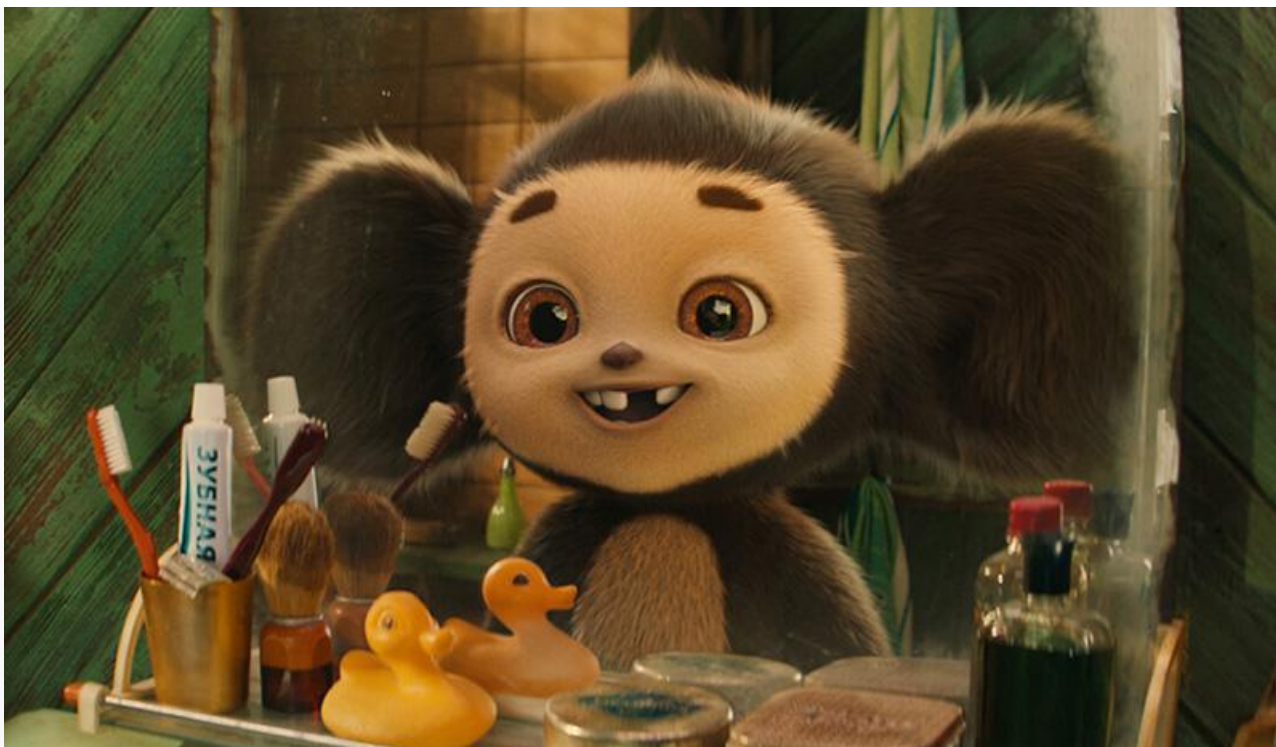
Кадр из фильма «Чебурашка 2»

Мюзикл Игоря Волошина « Буратино », получивший почти в два раза меньше сеансов, чем «Чебурашка», и игровой ремейк мультфильма « Простоквашино » от Сарика Андреасяна, работавший в схожих условиях, прошли новогодний марафон «рука об руку»: по 1,03 миллиарда к 4 января, 1,55 и 1,57 миллиарда соответственно – к Рождеству, и 2,09 и 2,11 миллиарда – к вечеру 11 января. Их средняя посещаемость составила 51 и 56 зрителей за сеанс в первую неделю года и 33 и 37 зрителей за сеанс – во второй уикенд.