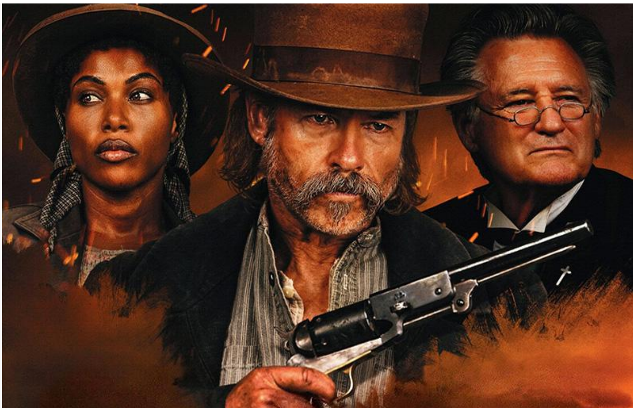
Постер к фильму «Грехи Запада»