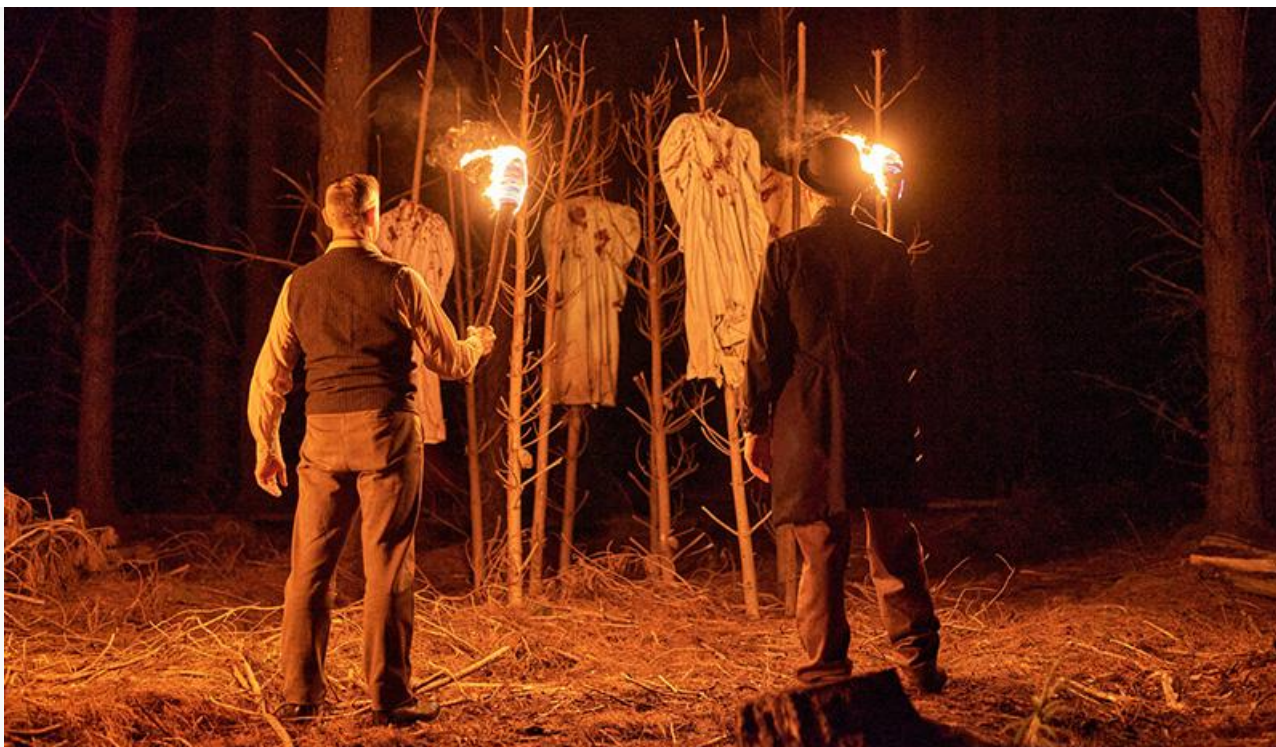
Кадр из фильма «Оно. Первое пришествие»

За новогоднюю кампанию мест в топовой десятке лишились «Три кота. Путешествие во времени», «Волчок», «Невероятные приключения Шурика», «Вечность», «Человек-бензопила. Фильм: История Резе», «Снеговик» и «Поймать монстра».