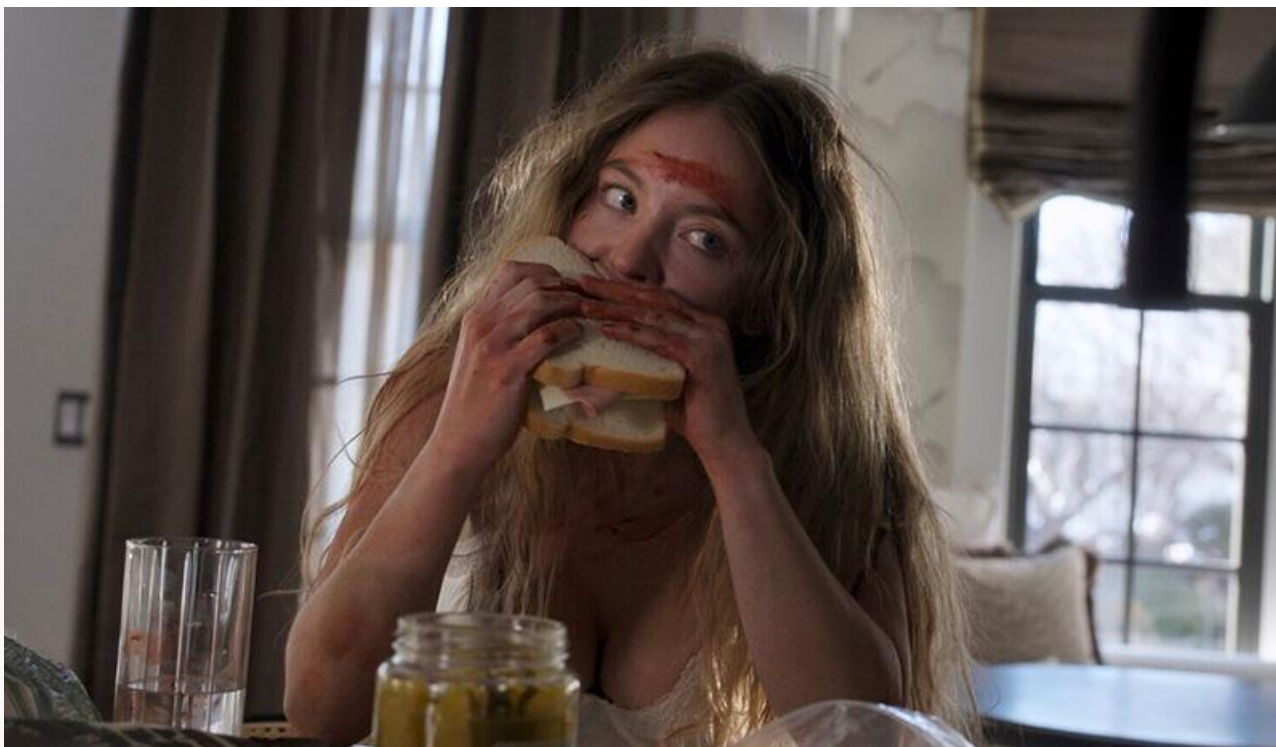
Сидни Суини в фильме «Горничная»