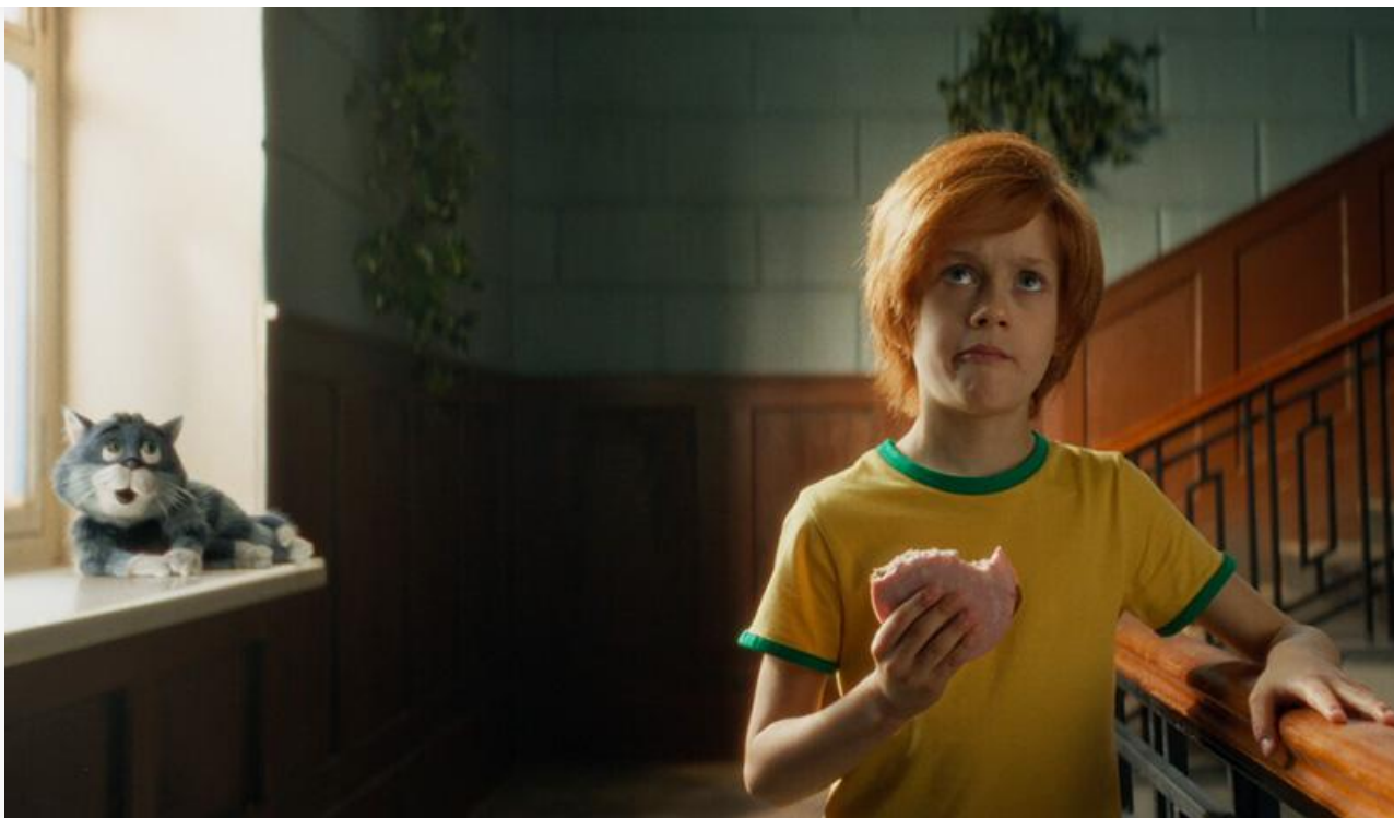
Кадр из фильма «Простоквашино»