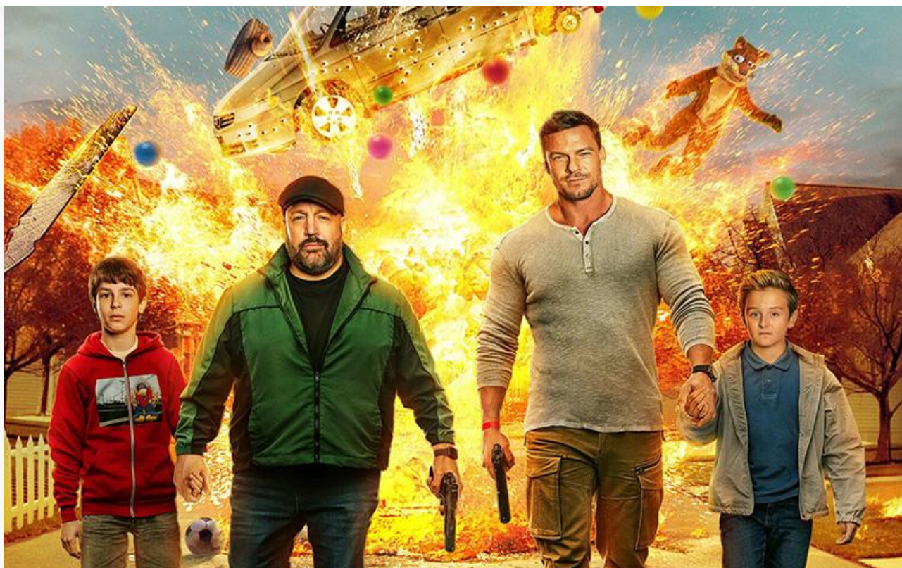
Постер к фильму «Убойная суббота»

Также выходят на экраны боевик Андрея Пантелеева «Завербованный» (18+) с Александром Метёлкиным, Иваном Охлобыстиным, Алексеем Кравченко и Игорем Жижкиным, американский вестерн Неда Краули «Грехи Запада» (18+) с Гаем Пирсом и Биллом Пуллманом, филиппинский хоррор «Уиджа. Шёпоты мёртвых» (18+) и китайский мультфильм трёхлетней давности «Океан чудес» .