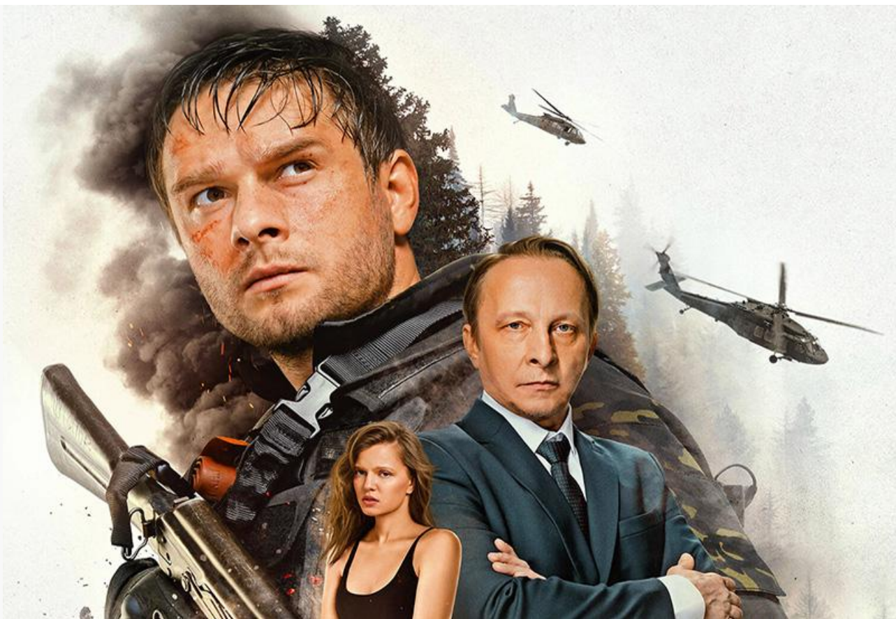
Постер к фильму «Завербованный»