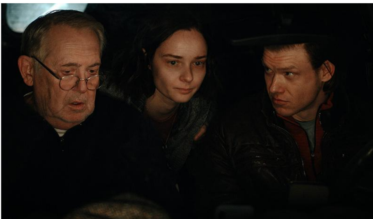
Кадр из фильма «Добрый доктор»

Из старожилов проката, вышедших на экраны ещё в прошлом году, в десятке лидеров по итогам новогодних праздников уверенно удержались «Три богатыря и свет клином» (316,5 миллиона за новогодние каникулы и пятое место), «Ёлки 12» (263,5 миллиона и седьмое место) и «Иллюзия обмана 3» (112,6 миллиона и восьмое место).