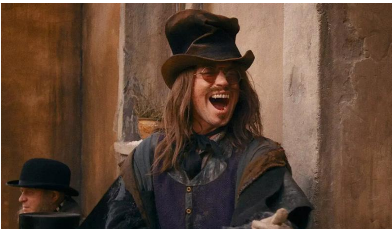
Александр Петров в фильме «Буратино»

Примечательно, что в Москве и больших городах с большим отрывом победил более интеллектуальный и интересный в актёрском плане «Буратино», провинция же отдала предпочтение менее замысловатому (читай: более тупому и бездарному) «Простоквашино».