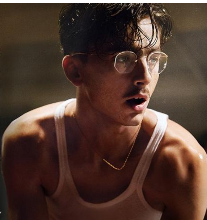
Постер к фильму «Мартин Великолепный»