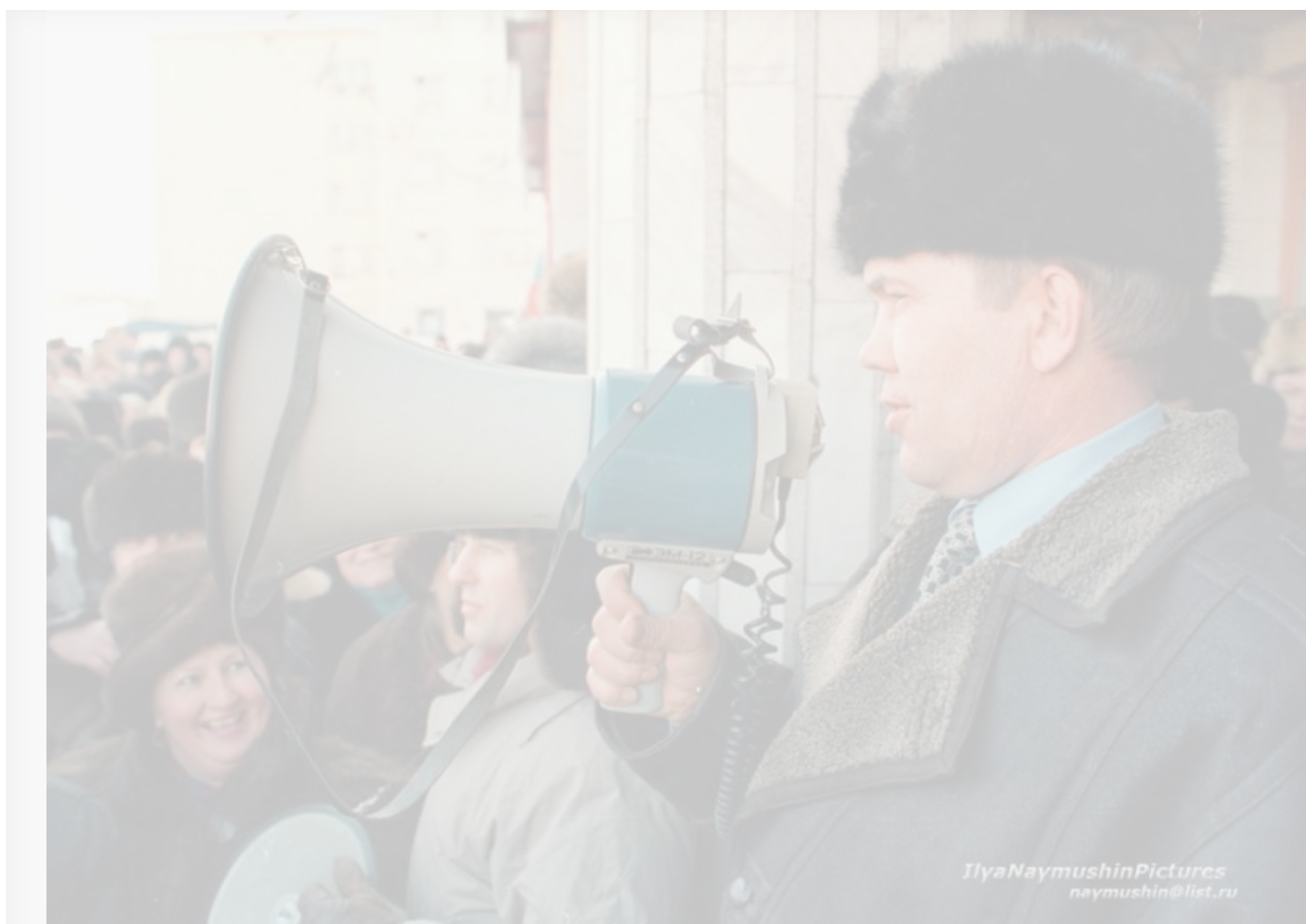
Александр Лебедь выступает на одном из митингов в Красноярске

Ещё не подписаны на наш телеграм-канал «Красноярск. Бабр. Дальше некуда» ? Подписывайтесь и участвуйте в викторинах и опросах.