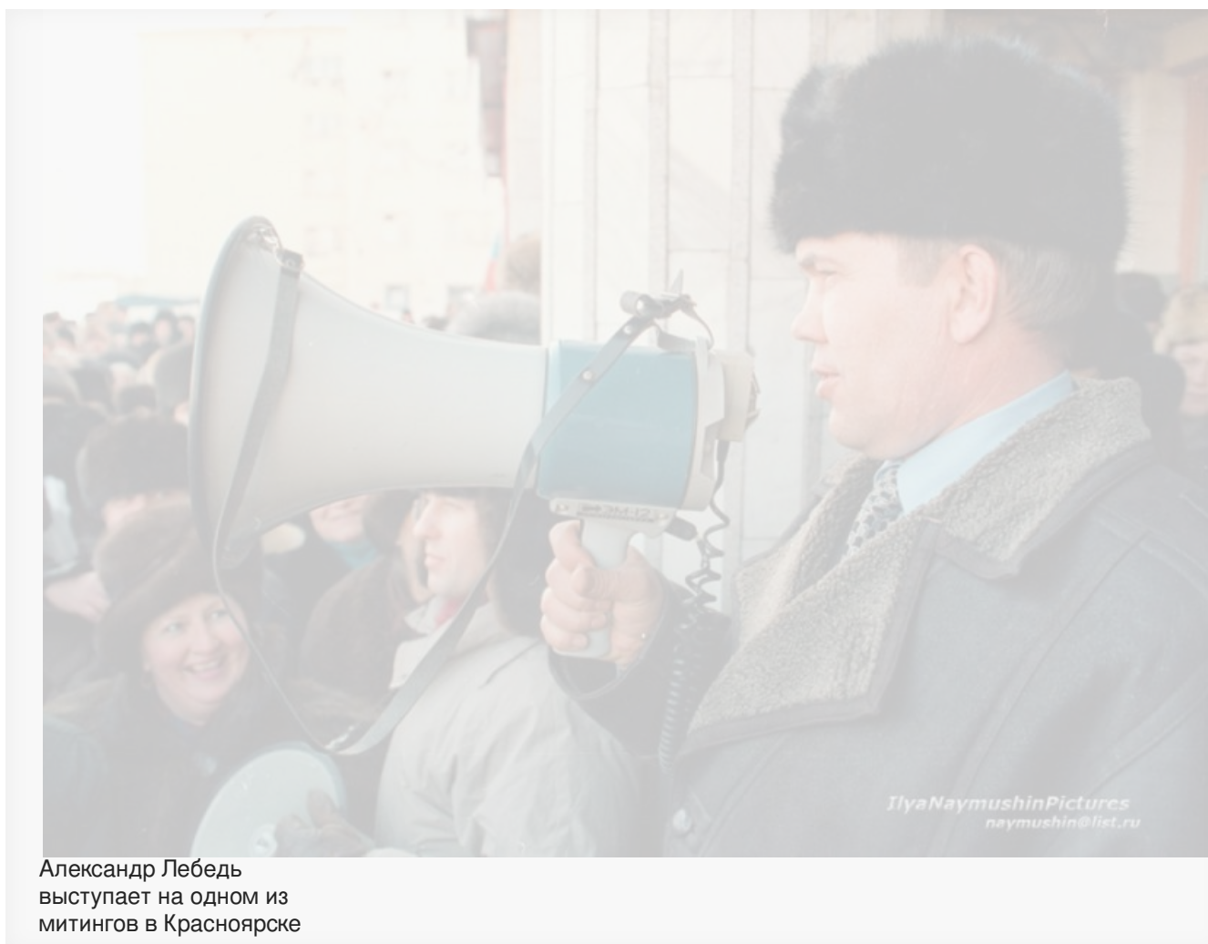
Александр Лебедь выступает на одном из митингов в Красноярске

Ещё не подписаны на наш телеграм-канал «Красноярск. Бабр. Дальше некуда» ? Подписывайтесь и участвуйте в викторинах и опросах.