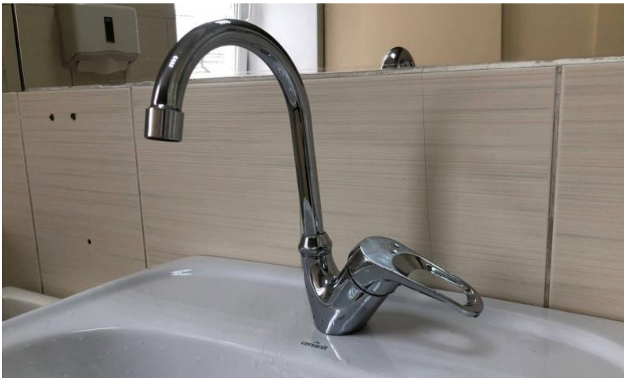
Фото: телеграм-канал «Город Иркутск»

Автор: Алина Саратова © Babr24.com ЭКОНОМИКА, ЖКХ, ИРКУТСК 👁 400 15.01.2026, 11:49