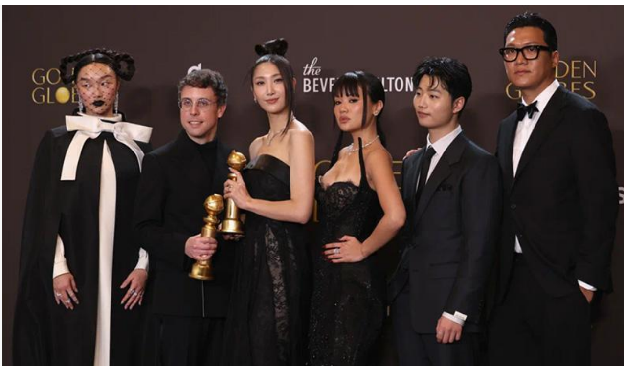
Команда фильма «Кей-поп-охотницы на демонов» с премиями «Золотой глобус»

Среди телевизионных лауреатов стоит отметить медицинскую драму «Питт» от HBO Max, отмеченную в категориях «Лучший телесериал (драма)» и «Лучший актёр драматического сериала» ( Ноа Уайли ), «Киностудию» от Apple TV+, получившую премии в аналогичных комедийных номинациях «Лучший телесериал (комедия или мюзикл)» и «Лучший актёр в телевизионном мюзикле или комедии» ( Сет Роген ), и «Переходный возраст» от Netflix, забравший статуэтки в категориях «Лучший телефильм или мини-