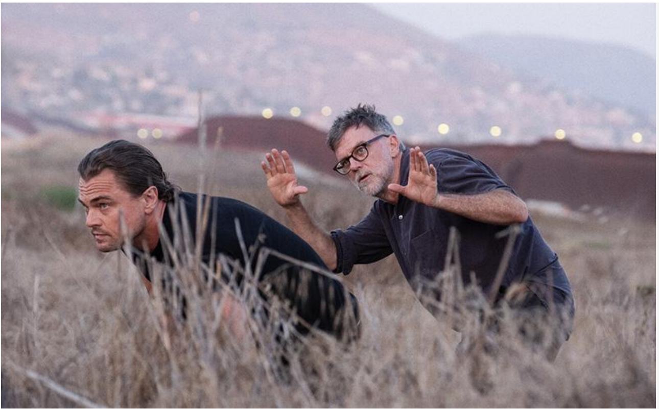
Пол Томас Андерсон на съёмках фильма «Битва за битвой»