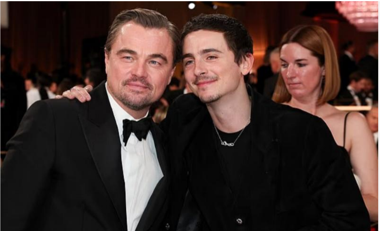
Леонардо Ди Каприо на церемонии вручения премии «Золотой глобус» с лауреатом в номинации «Лучший актёр в комедии или мюзикле» Тимоти Шаламе

Забегая вперёд, отметим, что «Битва за битвой» свою статуэтку за лучший фильм взял, в отличие от Ди Каприо, проигравшего Тимоти Шаламе.