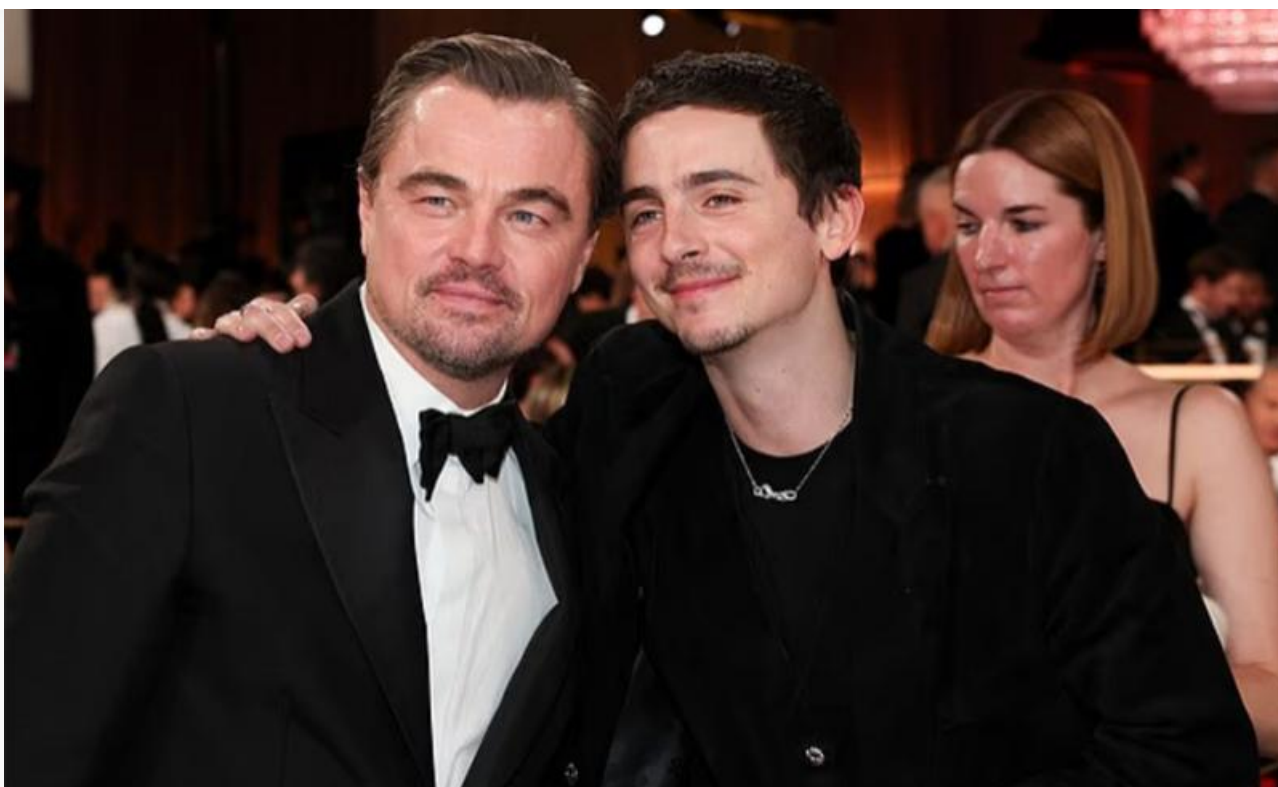
Леонардо Ди Каприо на церемонии вручения премии «Золотой глобус» с лауреатом в номинации «Лучший актёр в комедии или мюзикле» Тимоти Шаламе

Забегая вперёд, отметим, что «Битва за битвой» свою статуэтку за лучший фильм взял, в отличие от Ди Каприо, проигравшего Тимоти Шаламе.