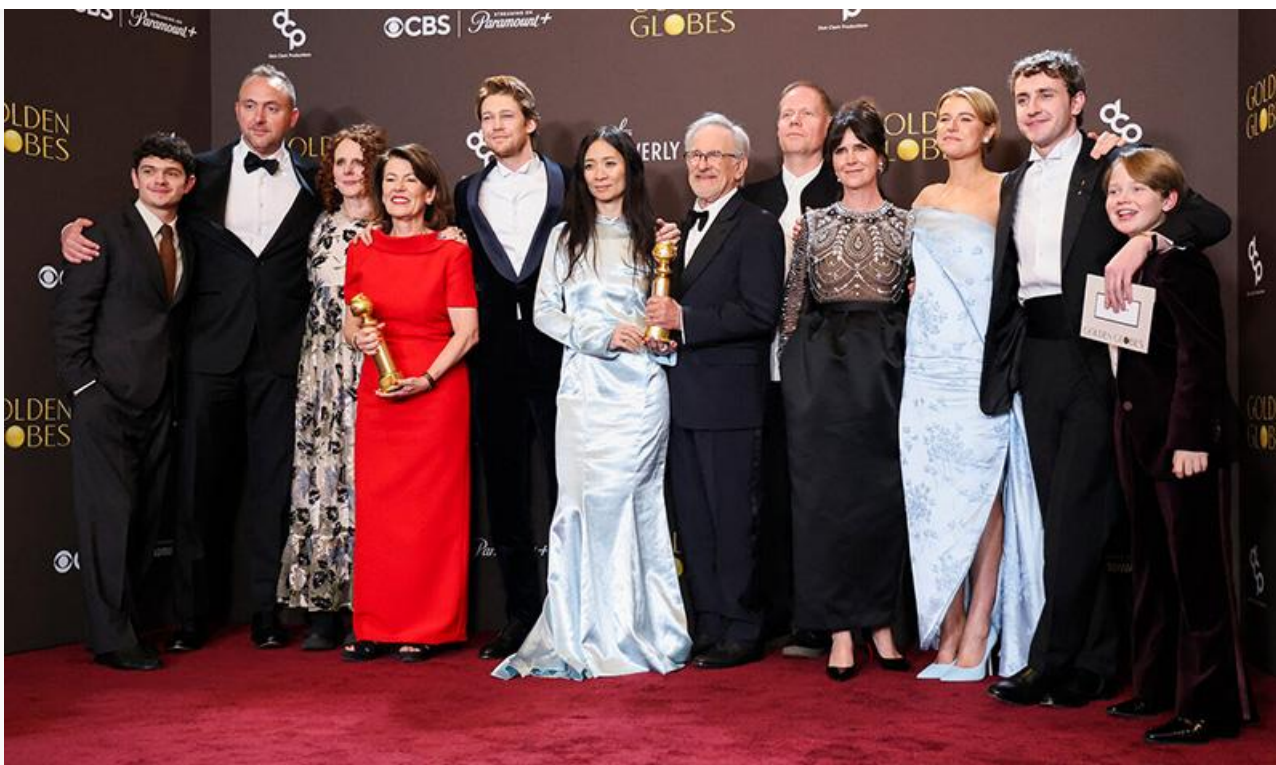
Команда фильма «Гамнет» с премиями «Золотой глобус»

Корейский «Метод исключения», французская «Простая случайность» и норвежская «Сентиментальная ценность» также номинировались на премию в категории «Лучший фильм на иностранном языке», где лауреатом стал бразильский триллер « Секретный агент ».