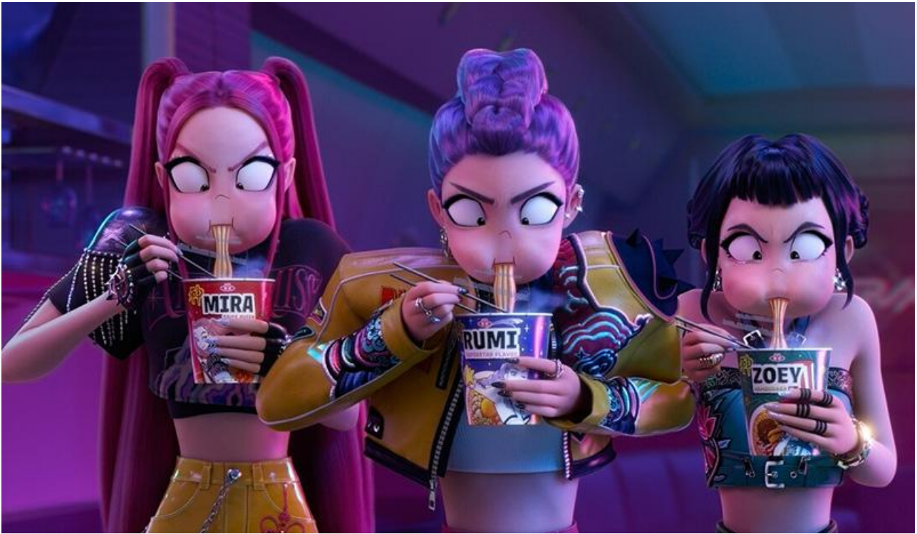
Кадр из фильма «Кей-поп-охотницы на демонов»