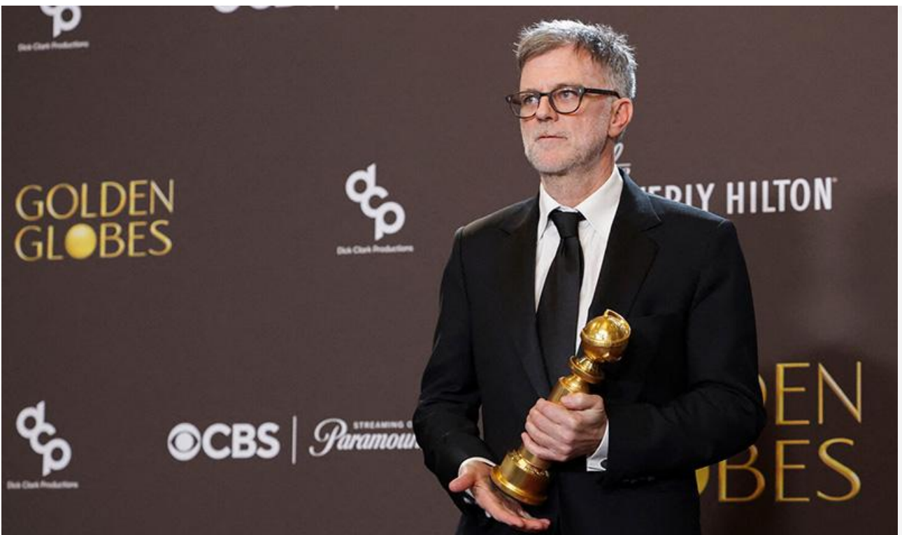
Пол Томас Андерсон с премией «Золотой глобус»