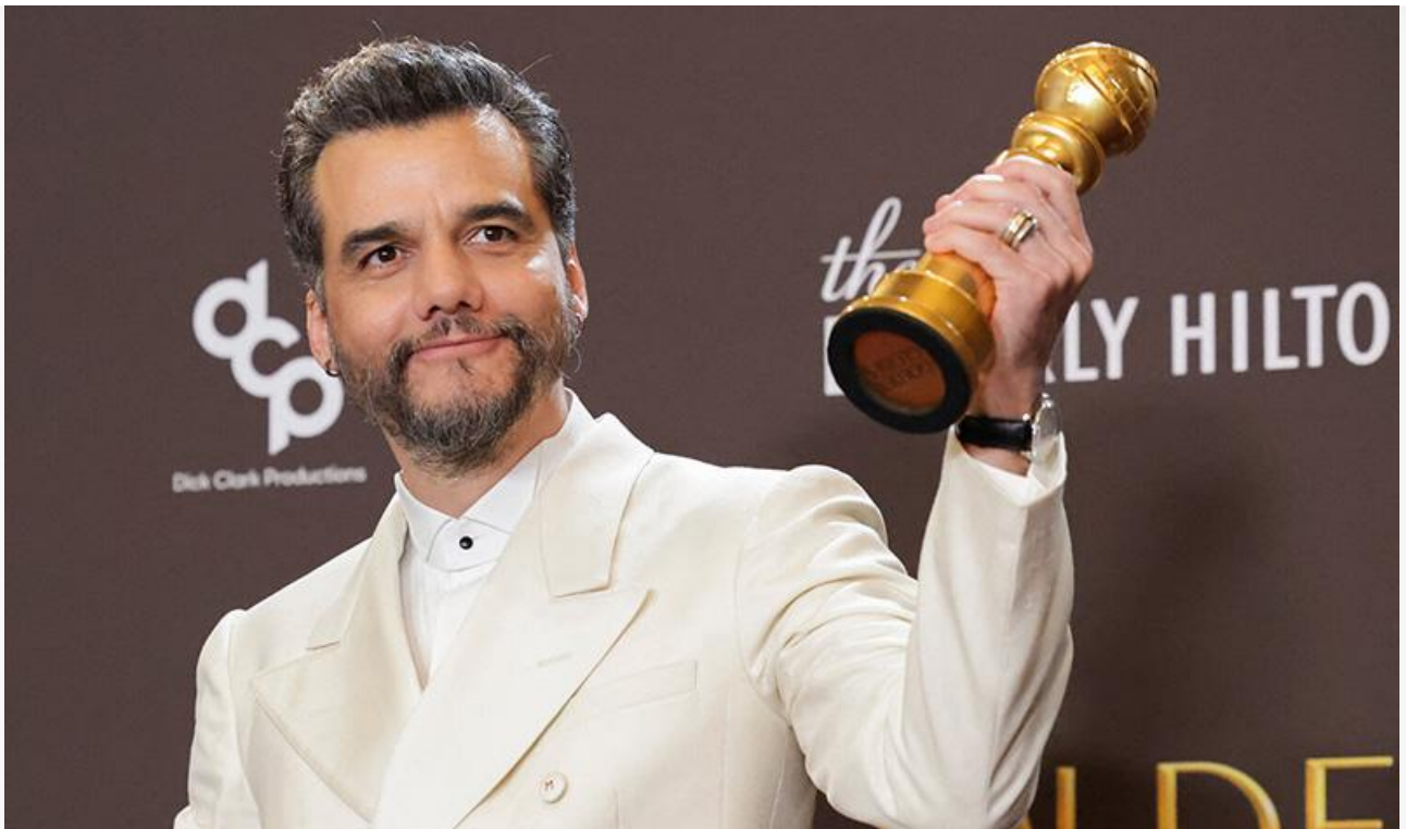
Вагнер Моура с премией «Золотой глобус»

Лучшим актёром в категории «Комедия или мюзикл» за роль теннисиста Марти Маузера в спортивной драме «Марти Великолепный» стал Тимоти Шаламе , обошедший Леонардо Ди Каприо из «Битвы за битвой», Джорджа Клуни из «Джея Келли», Ли Бёнхона из «Метода исключения», Итана Хоука из «Голубой луны» и Джесси Племонса из «Бугонии».