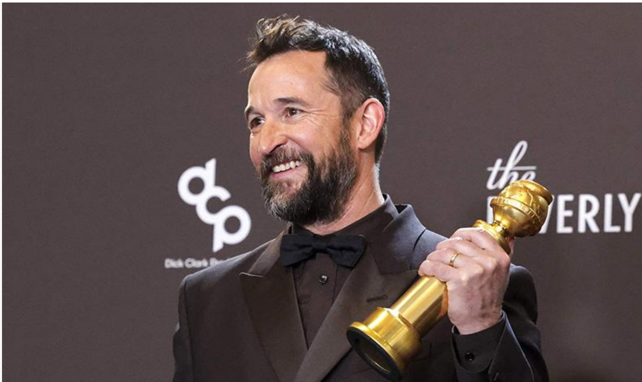
Ноа Уайли с премией «Золотой глобус»

Лучшими актрисами драматического и комедийного сериалов стали соответственно Рэй Сихорн из «Одна из многих» Apple TV+ и Джин Сمارт из «Хитростей» HBO Max, а лучшей актрисой телефильма/мини-сериала – Мишель Уильямс («Умираю, как хочу секса»).