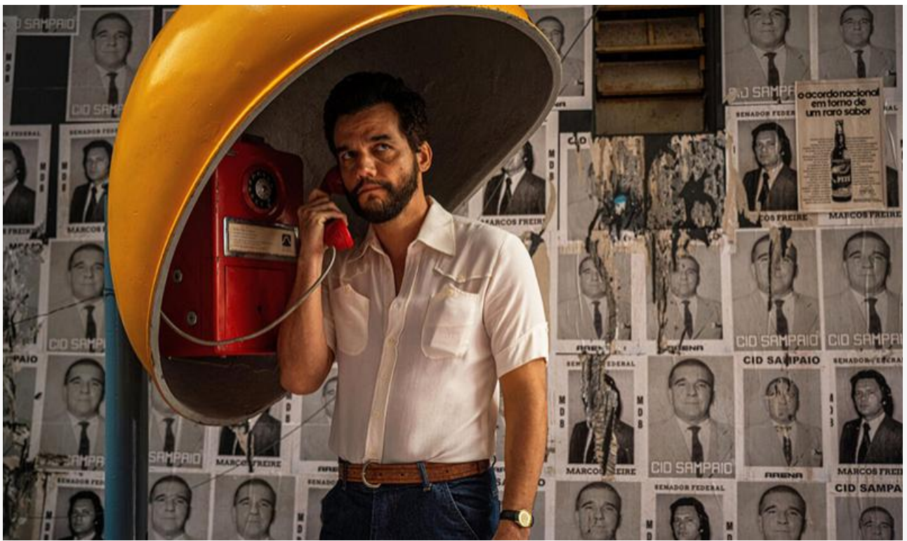
Вагнер Моура в фильме «Секретный агент»