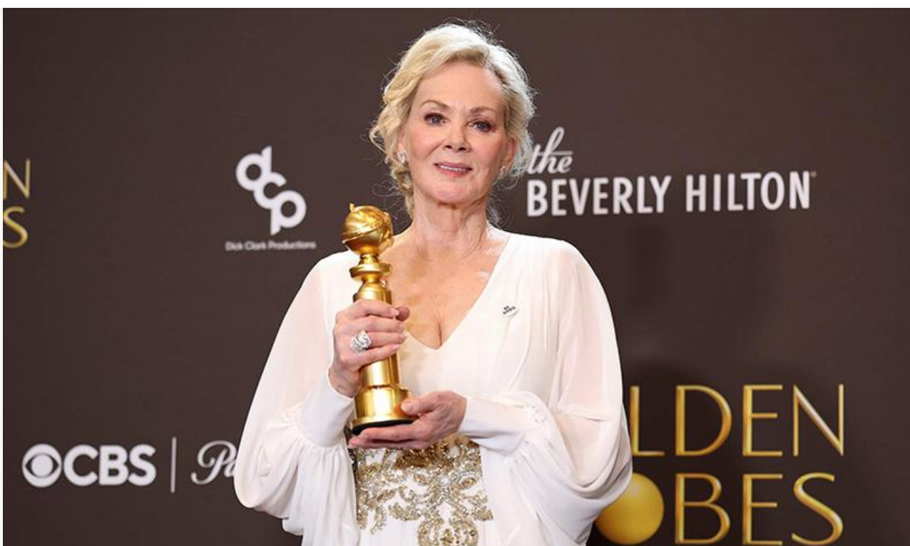
Джин Сمارт с премией «Золотой глобус»