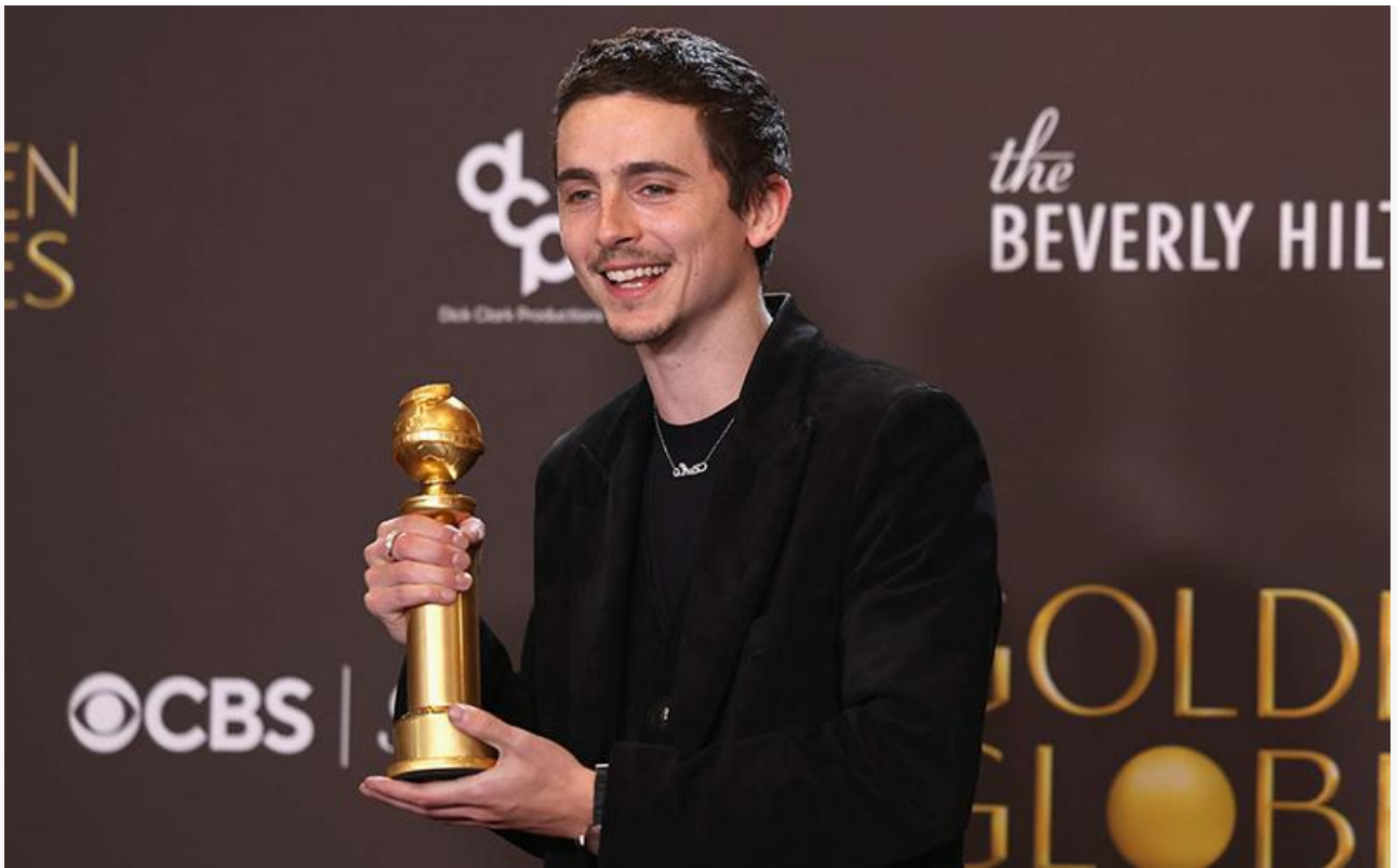
Тимоти Шаламе с премией «Золотой глобус»