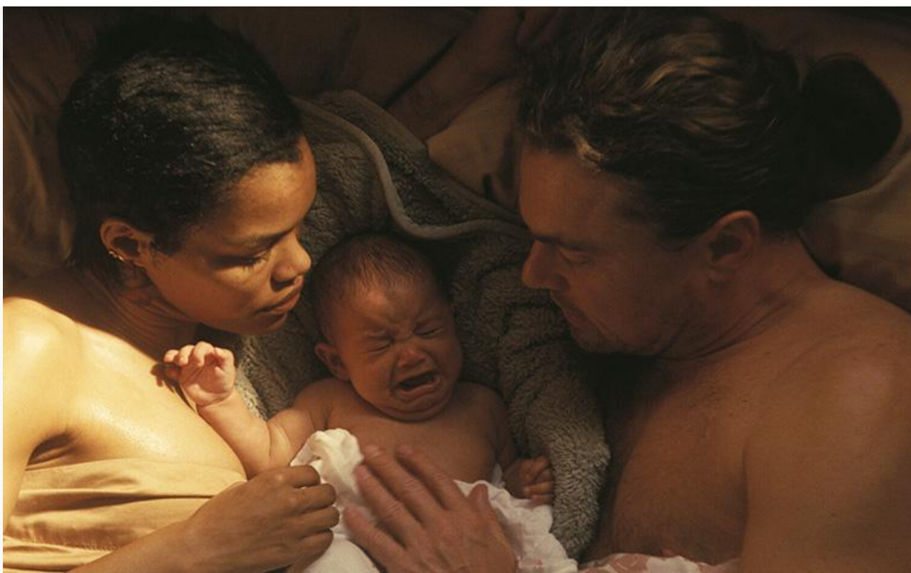
Тейяна Тейлор и Леонардо Ди Каприо в фильме «Битва за битвой»