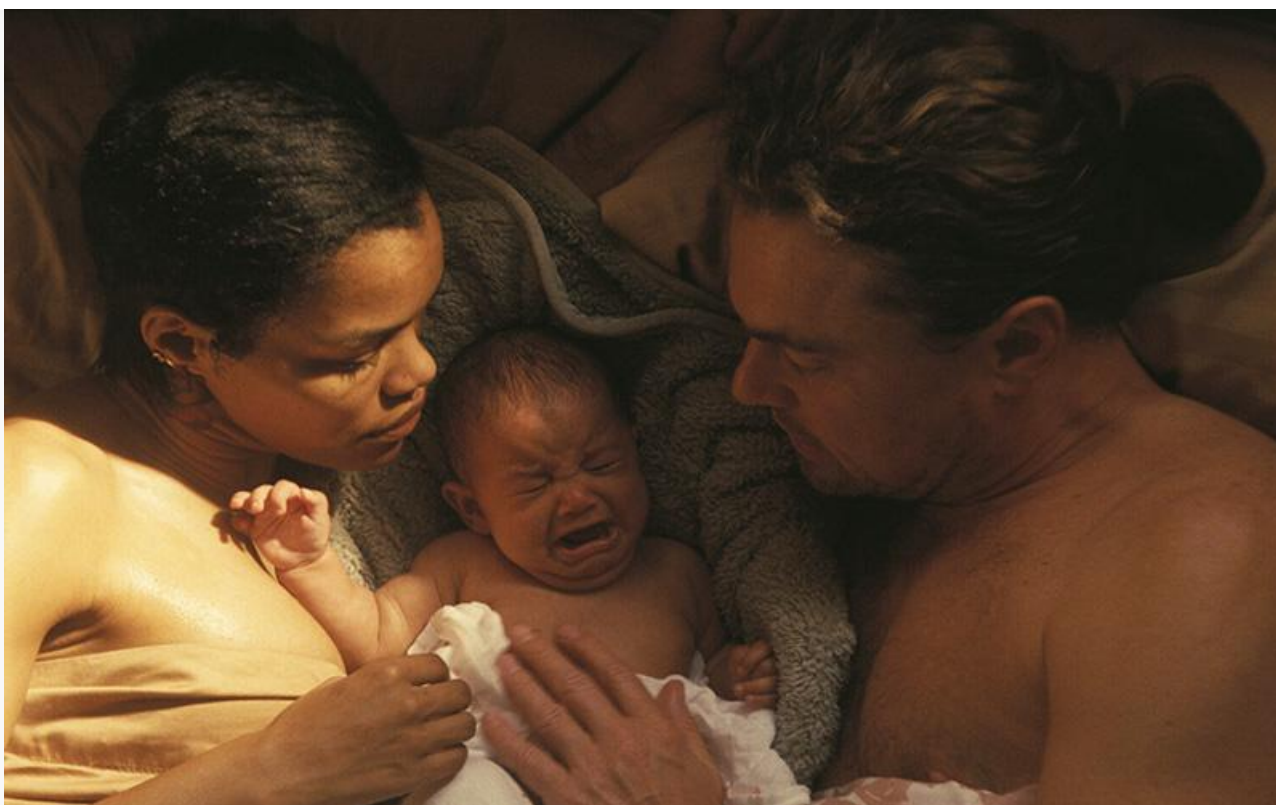
Тейяна Тейлор и Леонардо Ди Каприо в фильме «Битва за битвой»