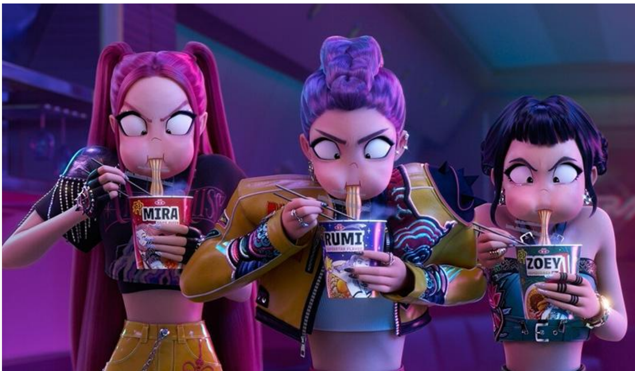
Кадр из фильма «Кей-поп-охотницы на демонов»