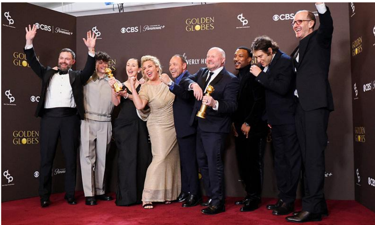
Команда фильма «Переходный возраст» с премиями «Золотой глобус»