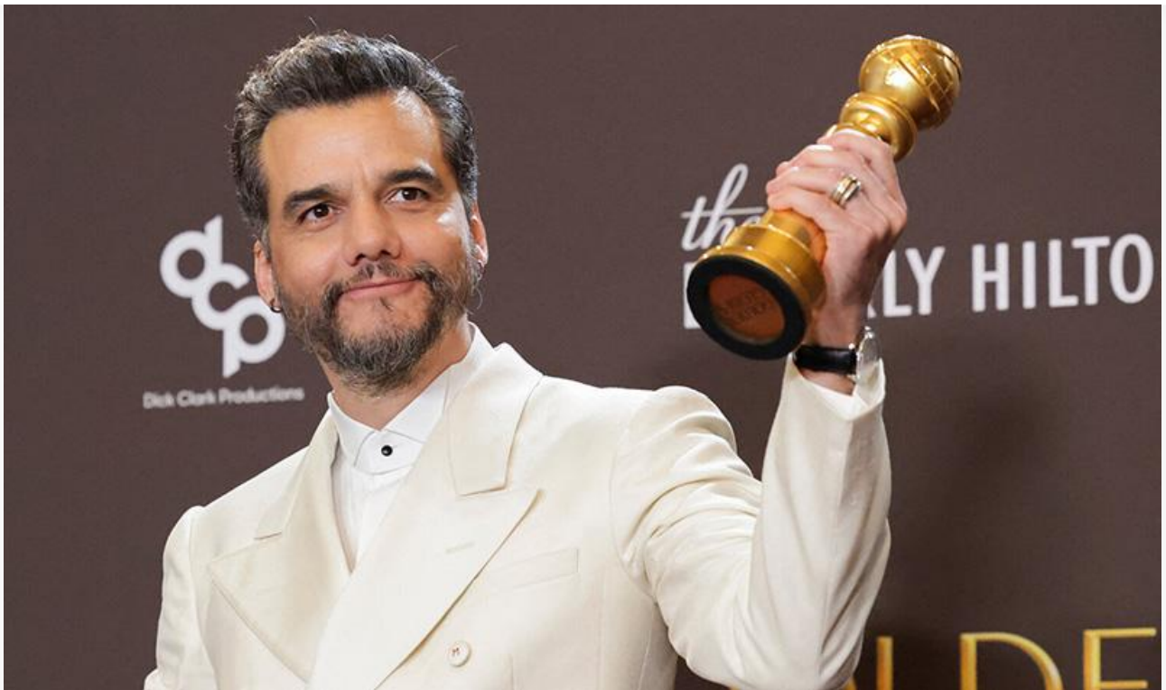
Вагнер Моура с премией «Золотой глобус»

Лучшим актёром в категории «Комедия или мюзикл» за роль теннисиста Марти Маузера в спортивной драмеди «Марти Великолепный» стал Тимоти Шаламе , обошедший Леонардо Ди Каприо из «Битвы за битвой», Джорджа Клуни из «Джея Келли», Ли Бёнхона из «Метода исключения», Итана Хоука из «Голубой луны» и Джесси Племонса из «Бугонии».