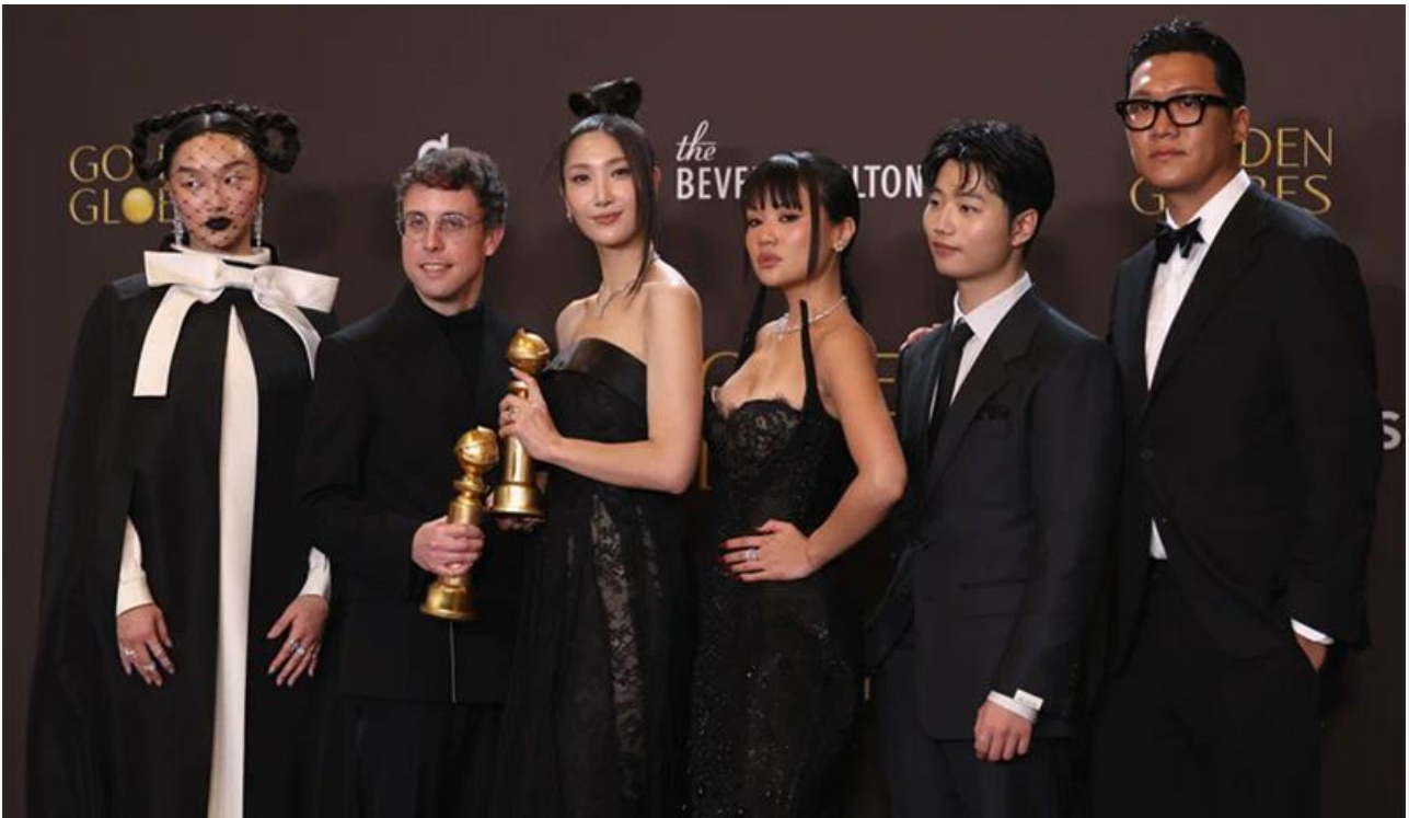
Команда фильма «Кей-поп-охотницы на демонов» с премиями «Золотой глобус»

Среди телевизионных лауреатов стоит отметить медицинскую драму «Питт» от HBO Max, отмеченную в категориях «Лучший телесериал (драма)» и «Лучший актёр драматического сериала» (Ноа Уайли), «Киностудию» от Apple TV+, получившую премии в аналогичных комедийных номинациях «Лучший телесериал (комедия или мюзикл)» и «Лучший актёр в телевизионном мюзикле или комедии» (Сет Роген), и «Переходный возраст» от Netflix, забравший статуэтки в категориях «Лучший телефильм или мини-