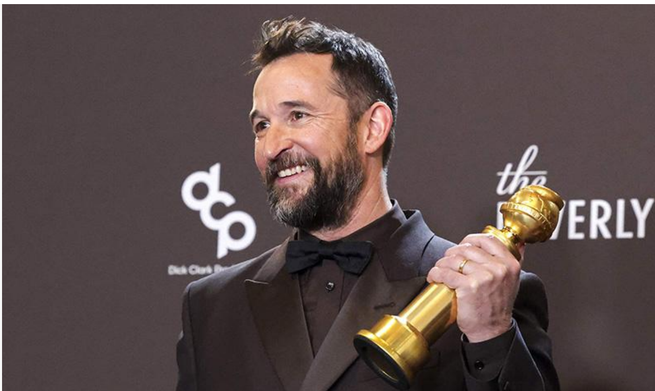
Ноа Уайли с премией «Золотой глобус»

Лучшими актрисами драматического и комедийного сериалов стали соответственно Рэй Сихорн из «Одна из многих» Apple TV+ и Джин Смарт из «Хитростей» HBO Max, а лучшей актрисой телефильма/мини-сериала – Мишель Уильямс («Умираю, как хочу секса»).