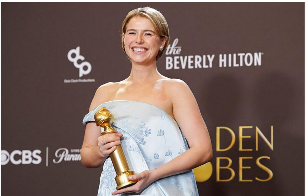
Джесси Бакли с премией «Золотой глобус»