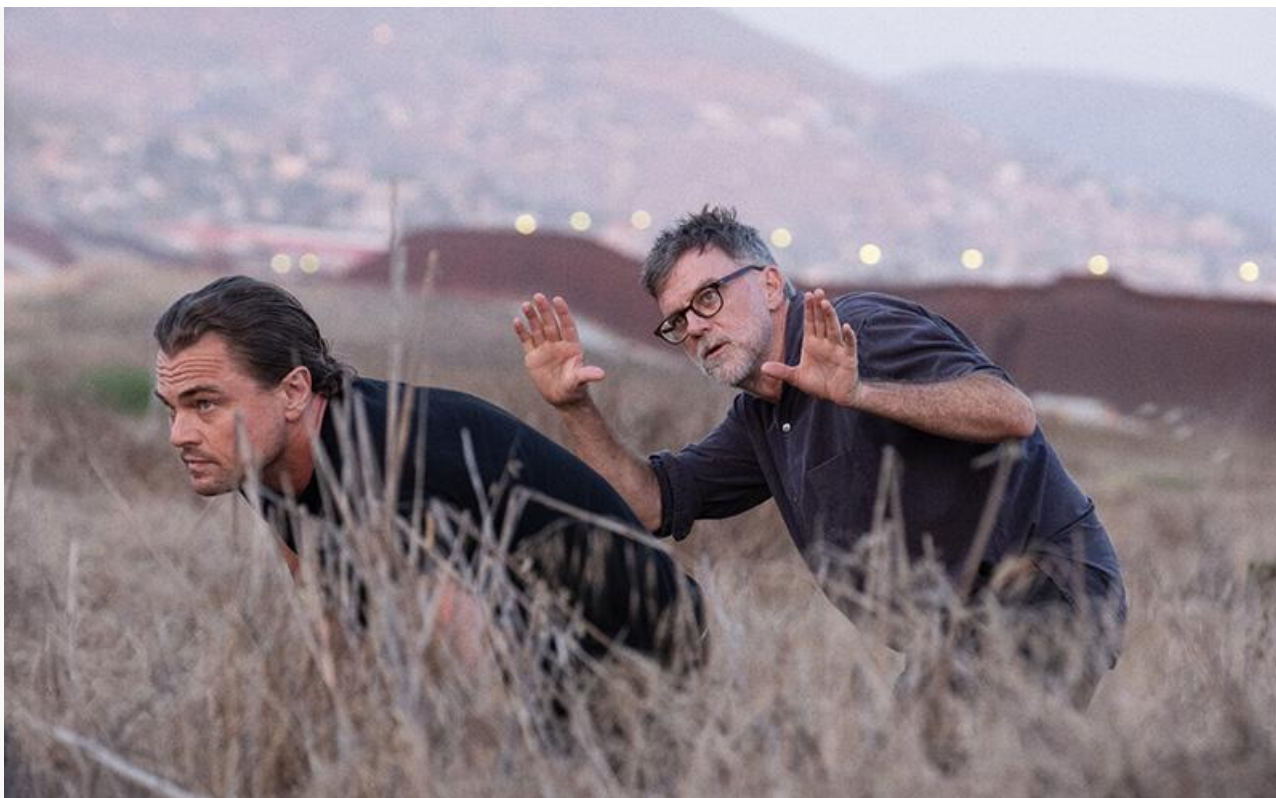
Пол Томас Андерсон на съёмках фильма «Битва за битвой»