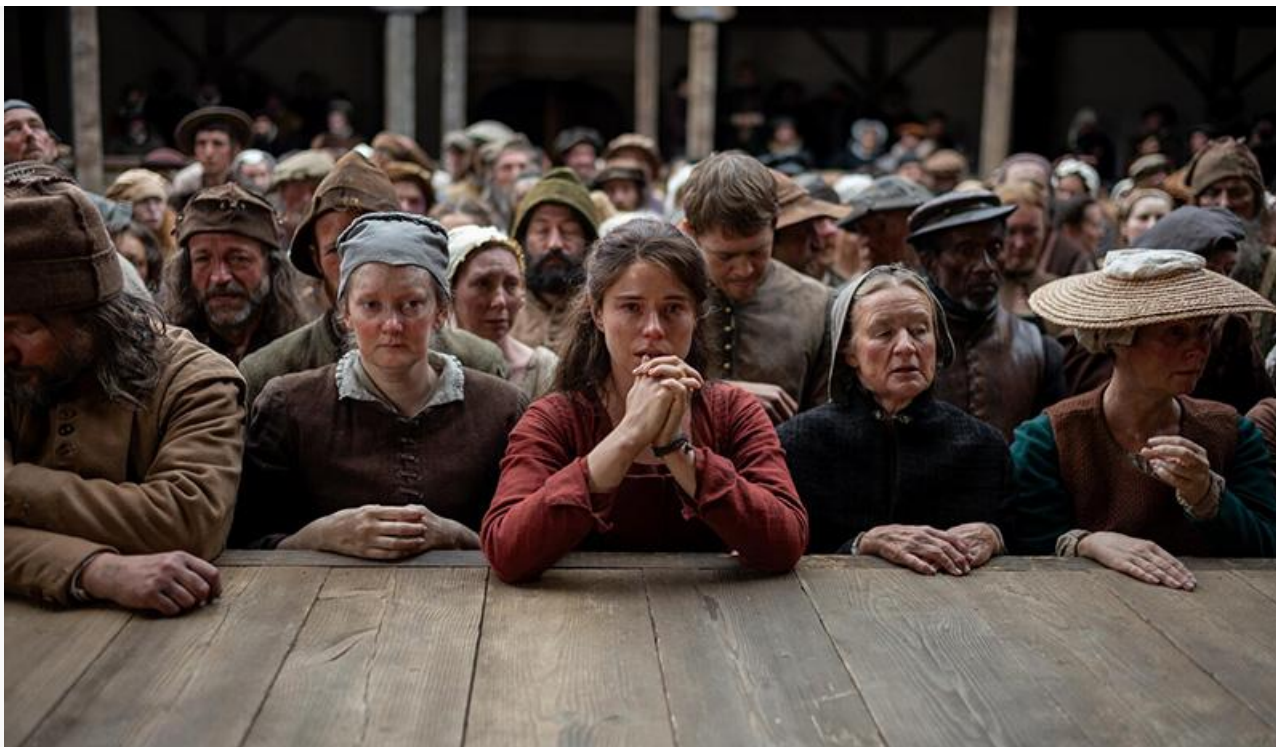
Джесси Бакли в фильме «Гамнет»

Кроме победителей на победу в категориях «Лучший фильм» претендовали «Грешники» Райана Куглера, «Простая случайность» Джафара Панахи, «Секретный агент» Клебера Мендонса, «Сентиментальная ценность» Йоакима Триера и «Франкенштейн» Гильермо дель Торо в категории «Драма» и «Бугония» Йоргоса Лантимоса, «Голубая луна» и «Новая волна» Ричарда Линклейтера, «Марти Великолепный» Джоша Сафди и «Метод исключения» Пак Чхан Ука в категории «Комедия или мюзикл».