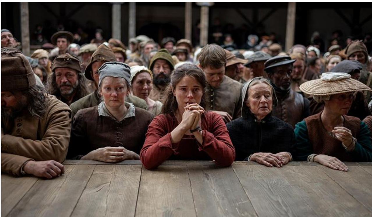
Джесси Бакли в фильме «Гамнет»

Кроме победителей на победу в категориях «Лучший фильм» претендовали «Грешники» Райана Куглера, «Простая случайность» Джафара Панахи, «Секретный агент» Клебера Мендонса, «Сентиментальная ценность» Йоакима Триера и «Франкенштейн» Гильермо дель Торо в категории «Драма» и «Бугония» Йоргоса Лантимоса, «Голубая луна» и «Новая волна» Ричарда Линклейтера, «Марти Великолепный» Джоша Сафди и «Метод исключения» Пак Чхан Ука в категории «Комедия или мюзикл».