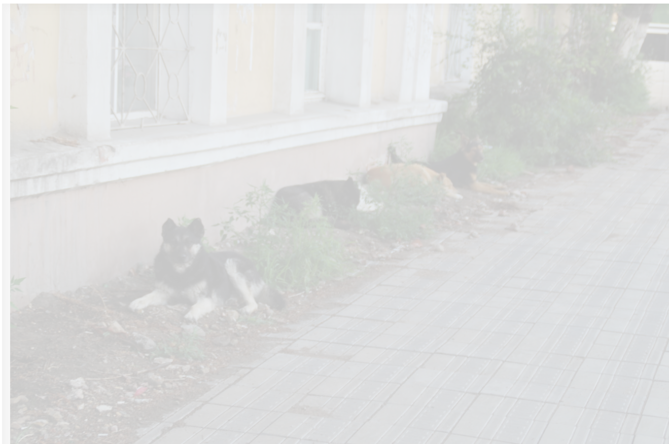
Автор: Алёна Штерн Фото из альбома "Бродячие собаки" © Фотобанк "RuBabr"

Страшное и трагическое событие произошло в Усть-Куте: стая бездомных собак едва не разорвала маленького мальчика. И дальше ситуация начала раскрываться всеми гранями человеческого безумия.