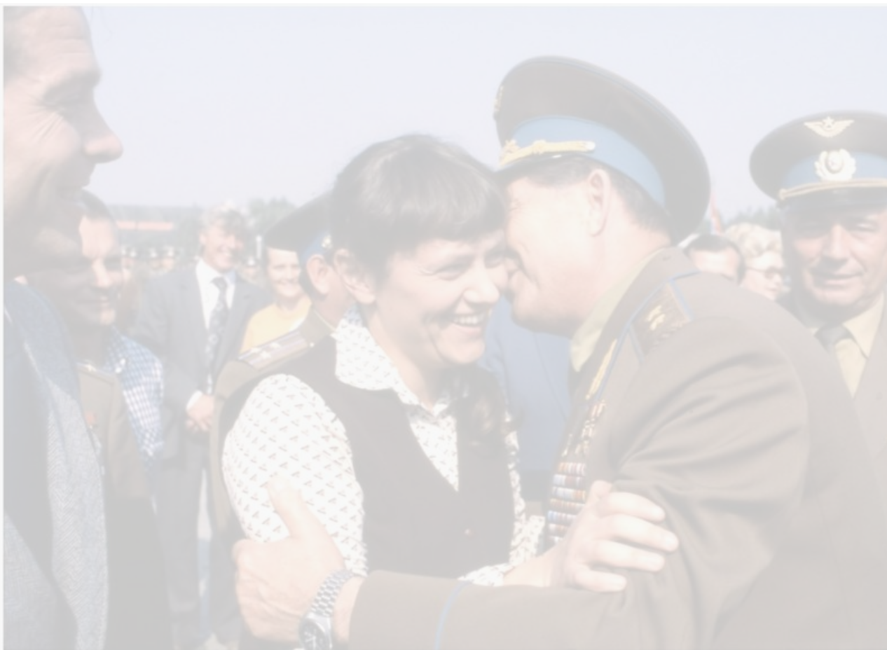
На торжественной встрече космонавтов после возвращения на Землю. Начальник Центра подготовки космонавтов Георгий Береговой что-то шепчет Светлане Савицкой. 1982 год

Все ближе выборы депутатов Госдумы. Коммунисты начинают всерьез интриговать общественность обещаниями выдвинуть весьма весомых кандидатов. В частности: второго женщину-космонавта Светлану Савицкую. Хотя в это предположение поверили далеко не все.