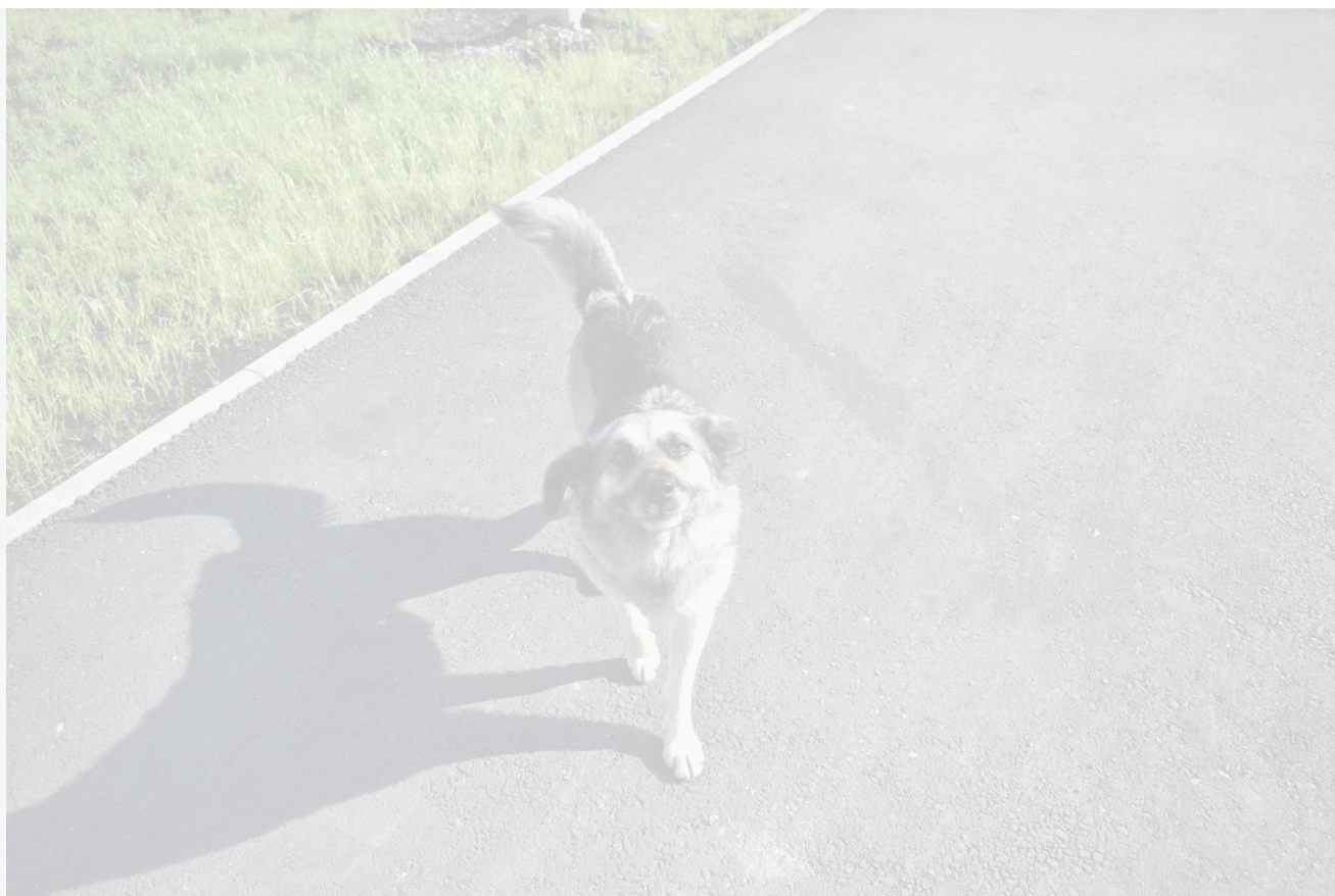
Автор: Екатерина Долинская Фото из альбома "Бродячие собаки" © Фотобанк "RuBabr"

Мальчика госпитализировали, прооперировали, сейчас он в стабильном состоянии. Для дальнейшего лечения его планировали доставить в Иркутск. И почти сразу после этого история перешла из разряда трагедий в разряд уголовных дел. Следователи возбудили дело по статье о халатности. В администрации прошли обыски, изъяли документы. Был задержан председатель комитета по сельскому хозяйству, природным ресурсам и экологии. Его допросили, решается вопрос о мере пресечения. Дело находится на контроле у прокуратуры.