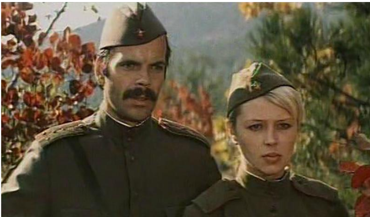
Капитан Скворцов в фильме «Крепость», 1978 год

Всего в фильмографии Арниса Лицитиса около 120 названий, среди которых культовые советские художественные и телевизионные фильмы «Мерседес уходит от погони» Юрия Ляшенко, «Богач, бедняк...» Арунаса Жебрюнаса, «Мираж» Алоиза Бренча, «Русь изначальная» Геннадия Васильева, «Воры в законе» Юрия Кары, «Узник замка Иф» и «Искусство жить в Одессе» Георгия Юнгвальда-Хилькевича, российские фильмы и сериалы «Затерянный в Сибири», «Мушкетёры 20 лет спустя», «Наваждение», «Красная капелла», «Звезда эпохи», «Леший», «Диверсант 2: Конец войны», «Красные горы», «Инквизитор» и многие, многие другие.