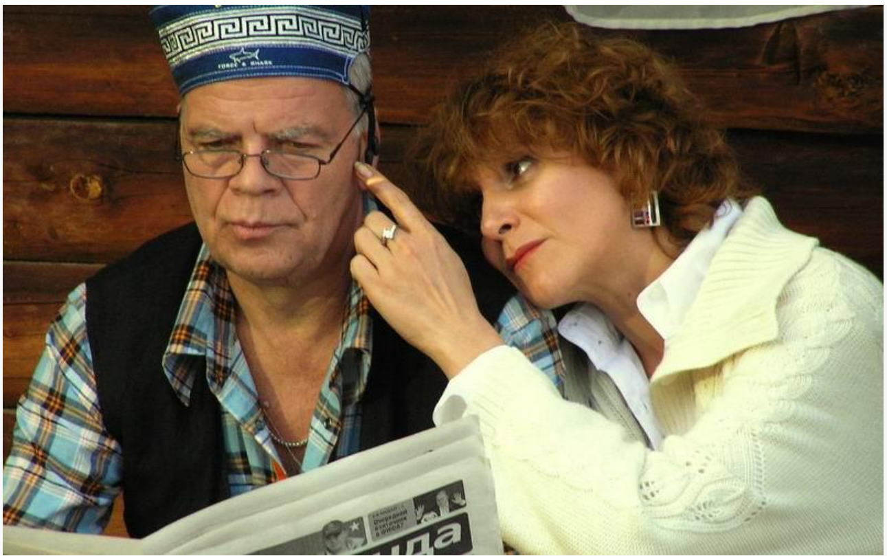
Карпыч в фильме «Леший», 2007 год