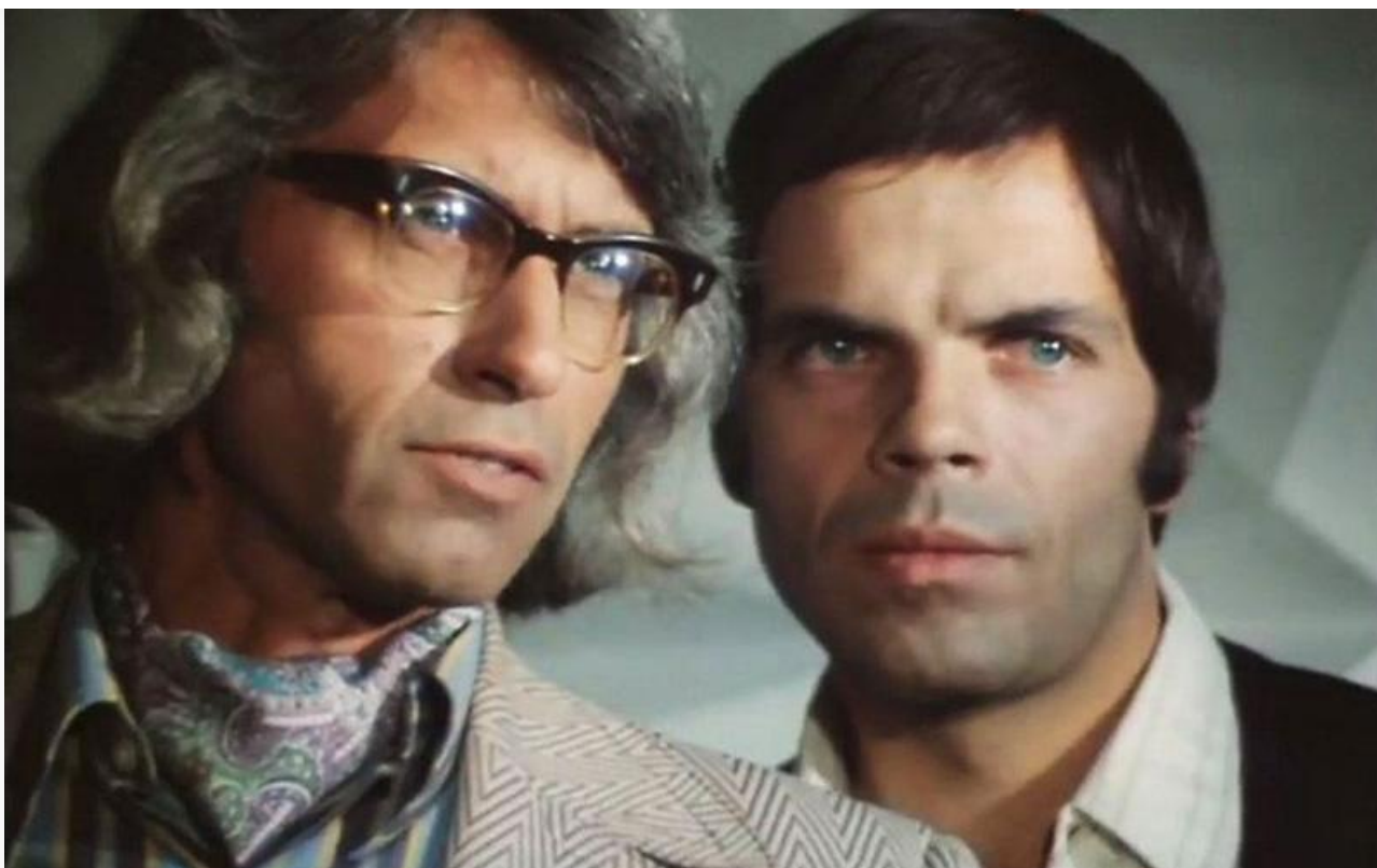
Алан Йорк в фильме «Фаворит», 1976 год