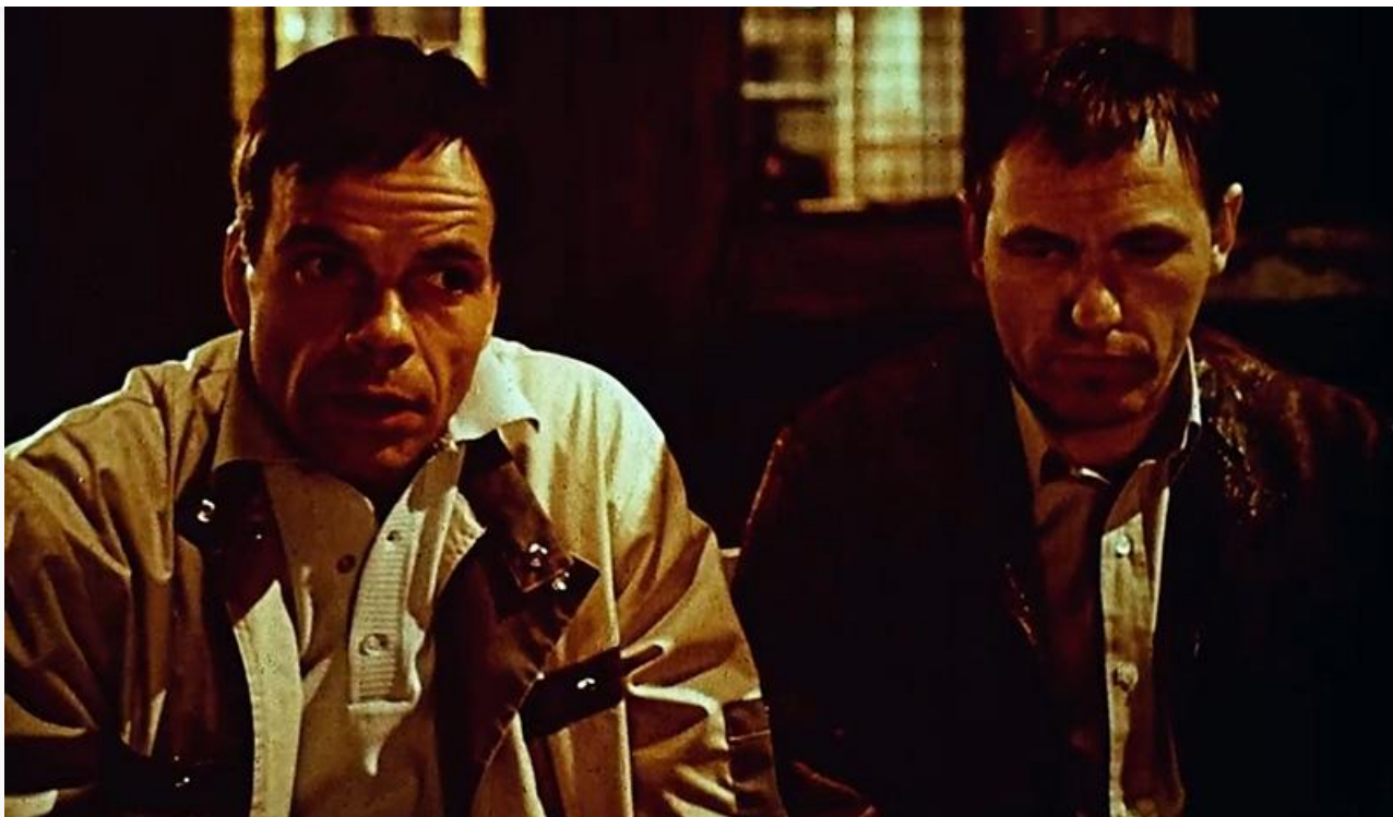
Марат в фильме «Свободное падение», 1987 год