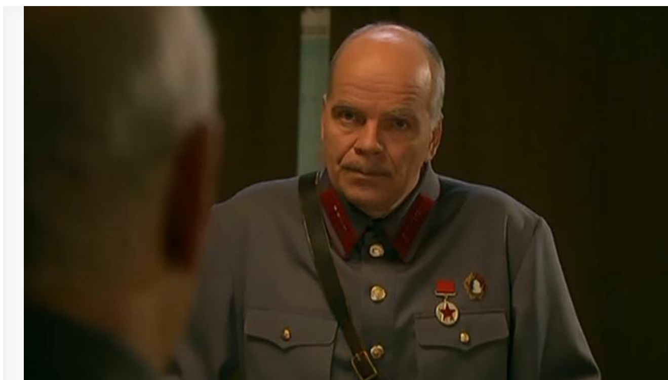
Генерал контрразведки в фильме «Красная капелла», 2004 год