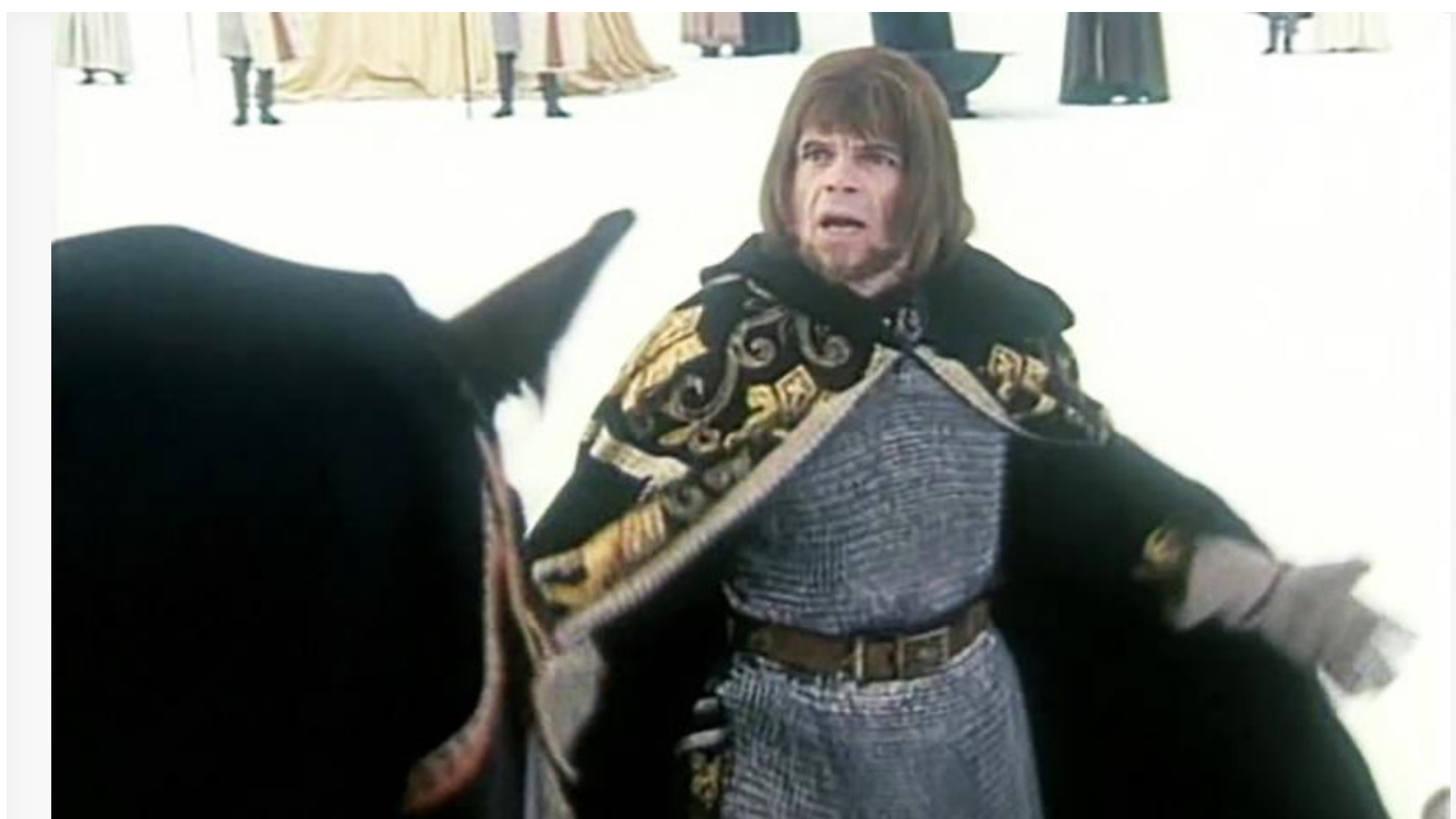
Маркиз де Во в фильме «Крестоносец», 1995 год

и приглашают сниматься, в отличие от родной Латвии, где о нём никто не вспоминает.