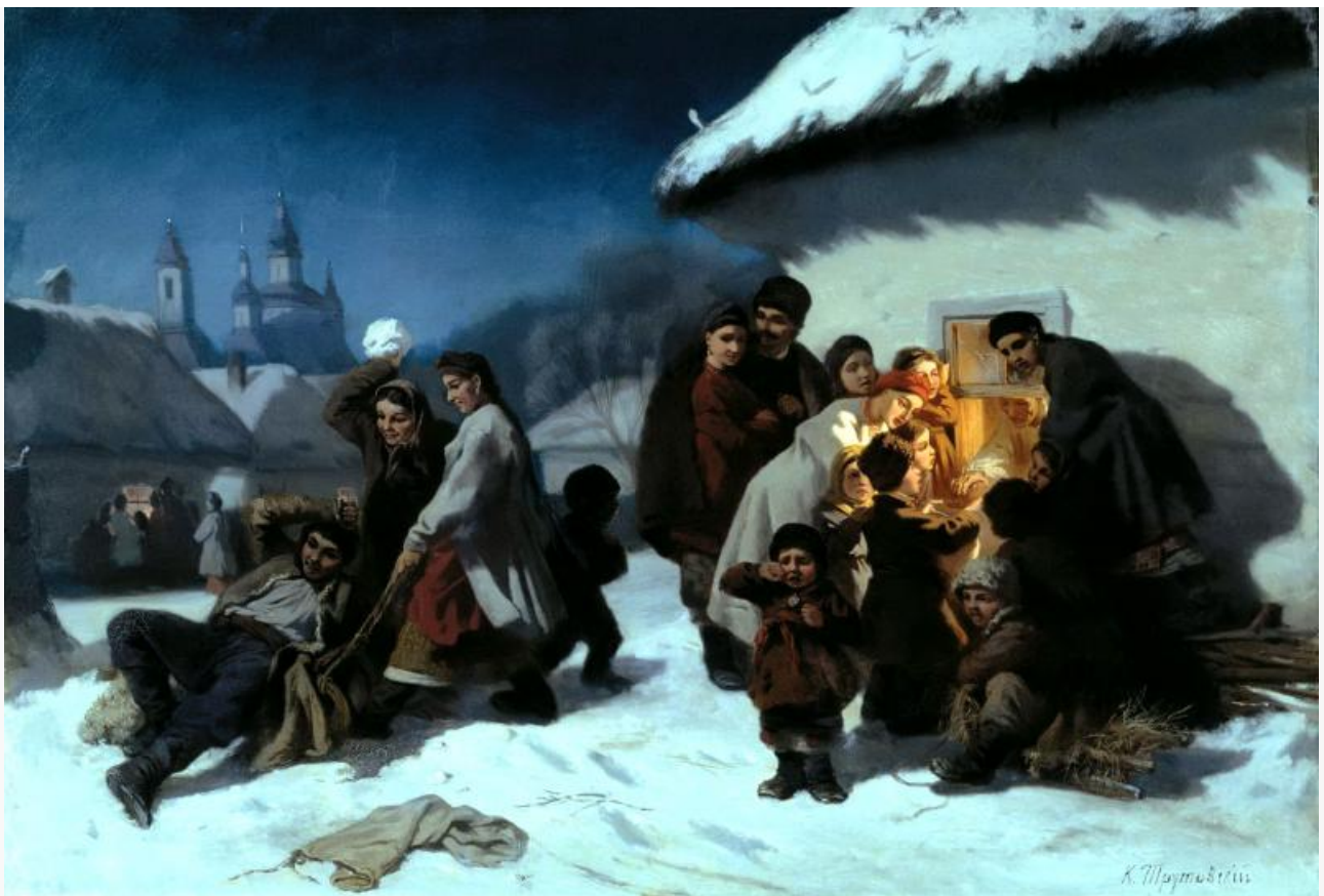
К.А. Трутовский. «Колядки в Малороссии»

Обычай колядовать на святках был распространён у всех славян, а аналогичные обходы совершались и в европейских странах. В роли колядующих выступали обычно группы холостой молодёжи и ребяташки: поздним вечером или ранним утром они ходили по селению, навещая каждый дом и поздравляя хозяев с праздником. Очень часто ходили ряженые: парни и девушки могли изображать «козу», «лошадь», «медведя» или даже нечистую силу, а ребяташки чаще наряжались ангелами или просто носили с собой самодельную звезду. Колядующие пели и танцевали, иногда разыгрывали небольшие сценки, а хозяева непременно должны были одарить исполнителей едой, монетками или другими подарками, причем считалось, что от их щедрости зависит благополучие всех домочадцев (скупым хозяевам, по народному убеждению, грозил неурожай и разорение).