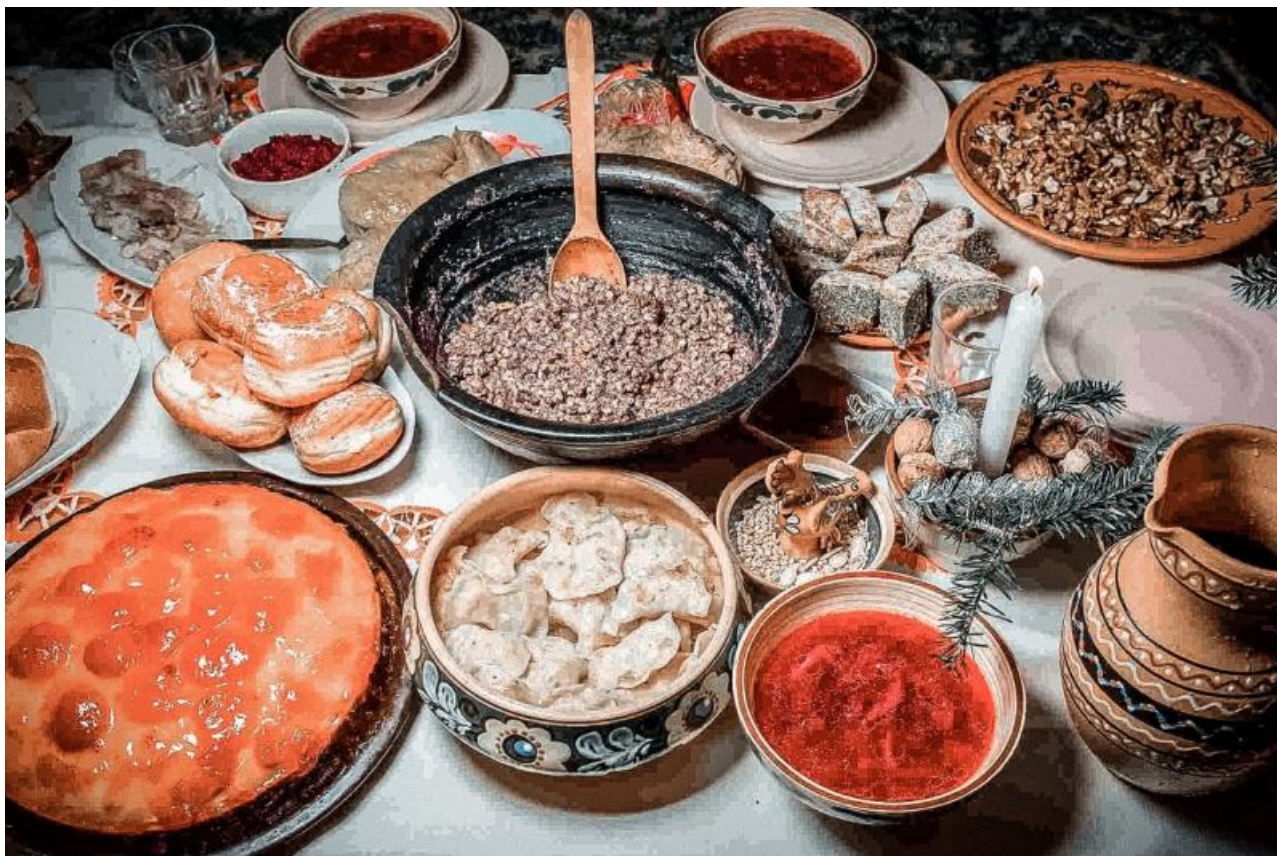
Кутью обычно варили из цельных зёрен пшеницы или ячменя (при этом могли смешивать разные злаки), добавляя туда мёд, мак, ягоды, сухофрукты, орехи. По кутье хозяева судили в будущем году: считалось, что если каша в меру уварится и заполнит горшок, то и год будет удачным, плодородным; а вот если каша окажется недоваренной или горшок треснет, то это плохой знак. В некоторых местах хозяин за ужином подбрасывал ложку кутьи вверх, полагая, что чем больше зёрен прилипнет к потолку, тем большим будет урожай. Кутью ели всей семьей из одного горшка, чтобы и будущий год провести «в полном составе», дружно.

Во второй половине дня все отправлялись в церковь, а после праздничной литургии, вернувшись домой, возжигали перед образами свечи или лампы, молились и приступали к торжественной трапезе.