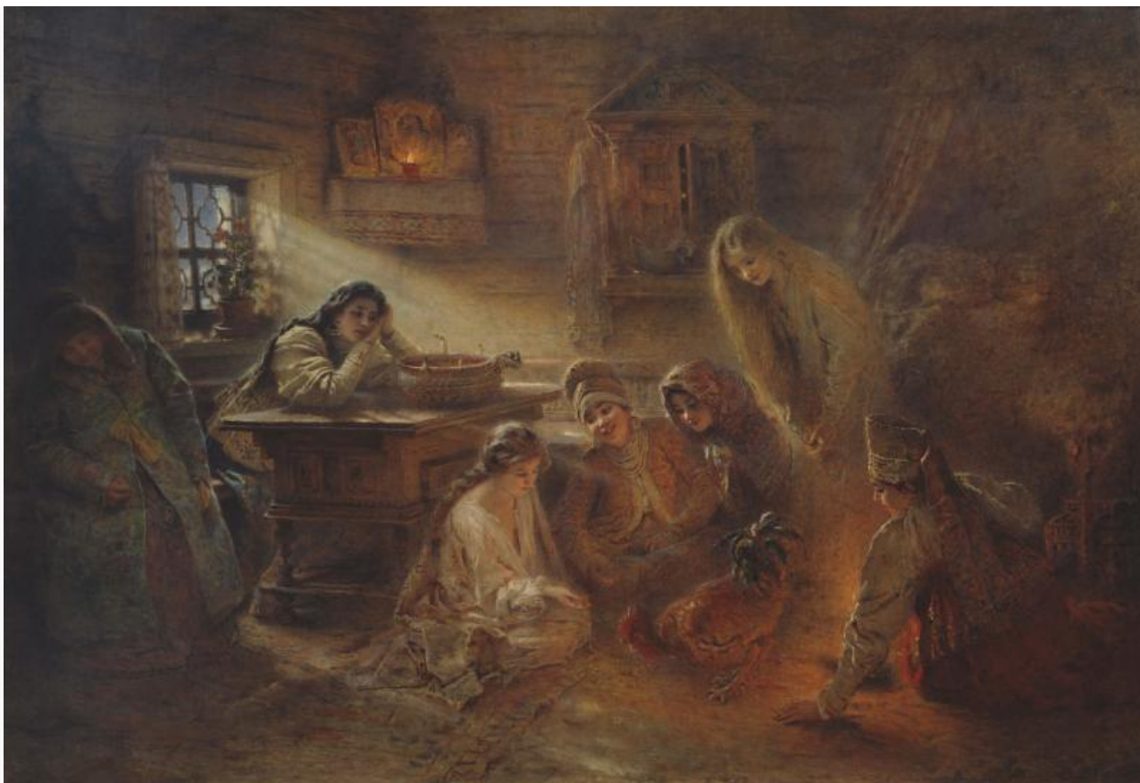
К.Е. Маковский, `Святочные гадания`

Самыми «верными» считались, конечно, «страшные» гадания, такие, как призывание «суженого-ряженого» возле зеркала со свечой. Народные былички рассказывают о множестве случаев, когда такие гадания оканчивались смертью любопытных. Причиной всегда было тесное общение с нечистой силой: ведь предполагалось, что это злые духи показываются в обличье «суженого». Святки вообще считались временем особого разгула разных духов (в том числе и сезонных демонов вроде шуликунов, выскакивающих из воды в сочельник и остающихся на земле до Крещения), но среди них, как считалось, есть и благожелательно настроенные — например, души предков, которые навещают своих живых родных. Это всё оттого, уверяли крестьяне, что Бог, радуясь рождению Сына, на Рождество отмыкает все двери и выпускает обитателей «того» света гулять по земле до самого крещенского водосвятия.