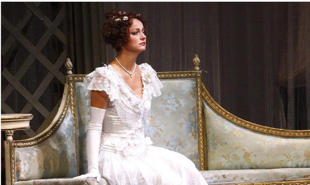
Машенька в спектакле «На всякого мудреца довольно простоты». Малый театр, постановка 2002 года

В 2006 году звезда Малого театра стала народной артисткой России и лауреатом премии Правительства России.