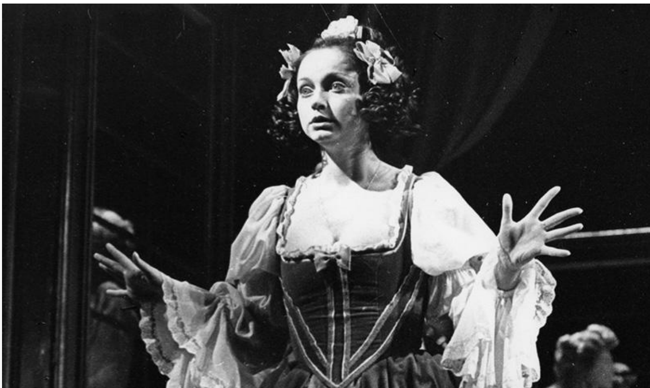
Люсиль в спектакле «Мещанин во дворянстве». Малый театр, постановка 1990 года