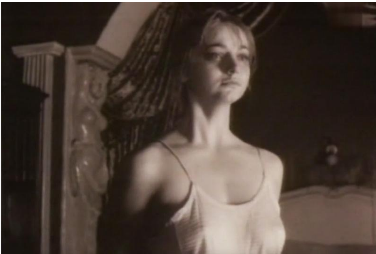
Алёна Осипова в фильме «Оно», 1990 год