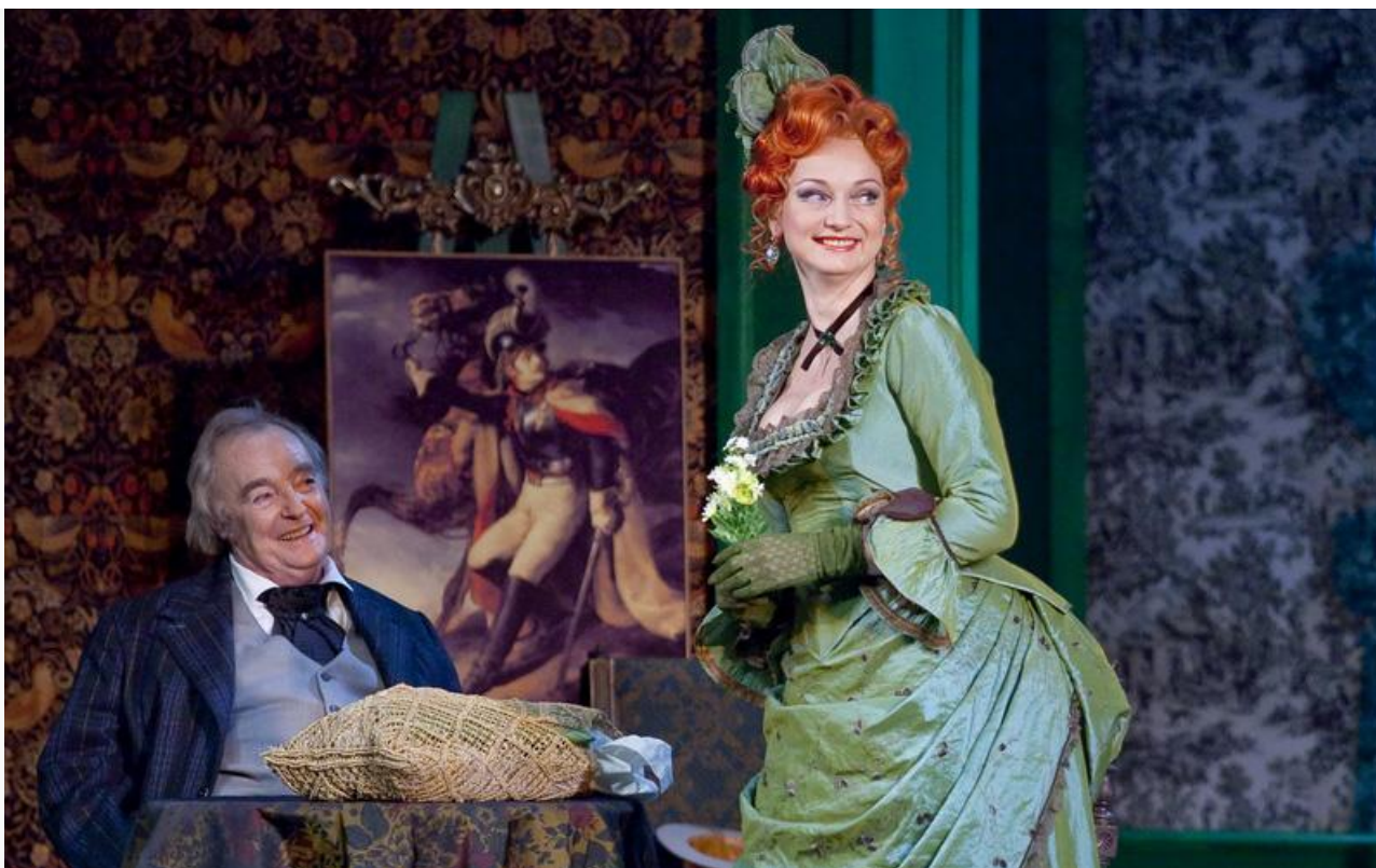
Госпожа Воссар в спектакле «Наследники Рабурдена». Малый театр, постановка 2011 года