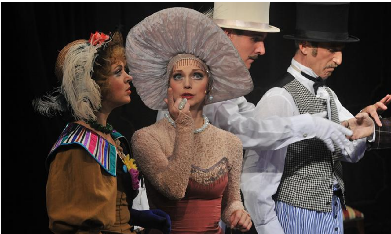
Баронесса в спектакле «Таинственный ящик». Малый театр, постановка 2003 года