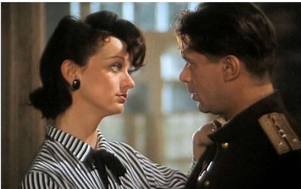
Артистка в фильме «Вор», 1997 год