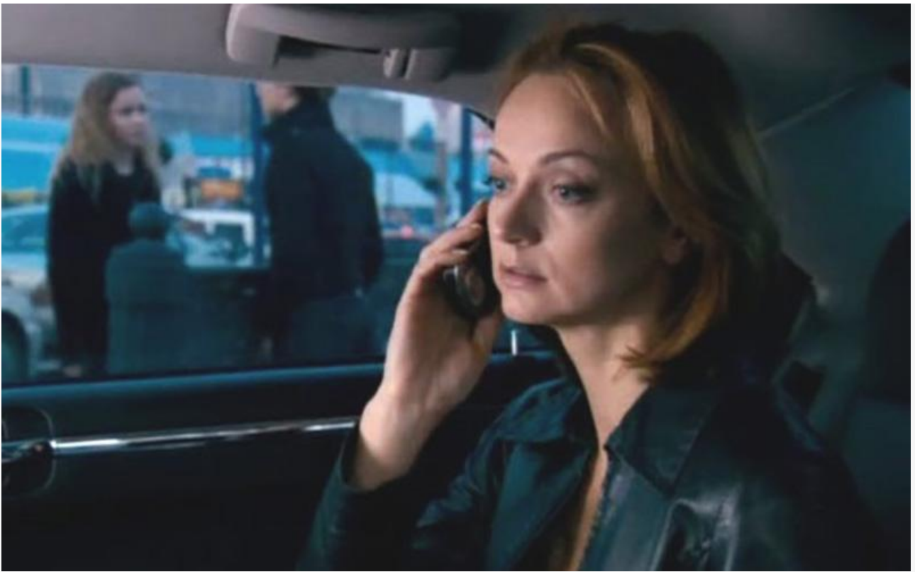
Саша Яновская в фильме «Ловушка», 2009 год

Несмотря на тяжёлую борьбу с внезапно выявленным в августе 2020 года онкологическим заболеванием, актриса до последних дней продолжала выходить на сцену. 7 апреля 2021-го на 56 году жизни Ольги Пашковой не стало.