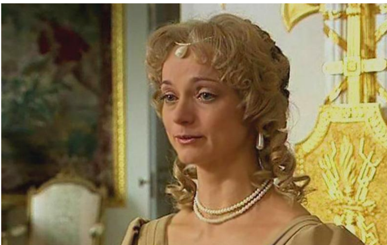
Императрица Елизавета в фильме «Северный сфинкс», 2003 год