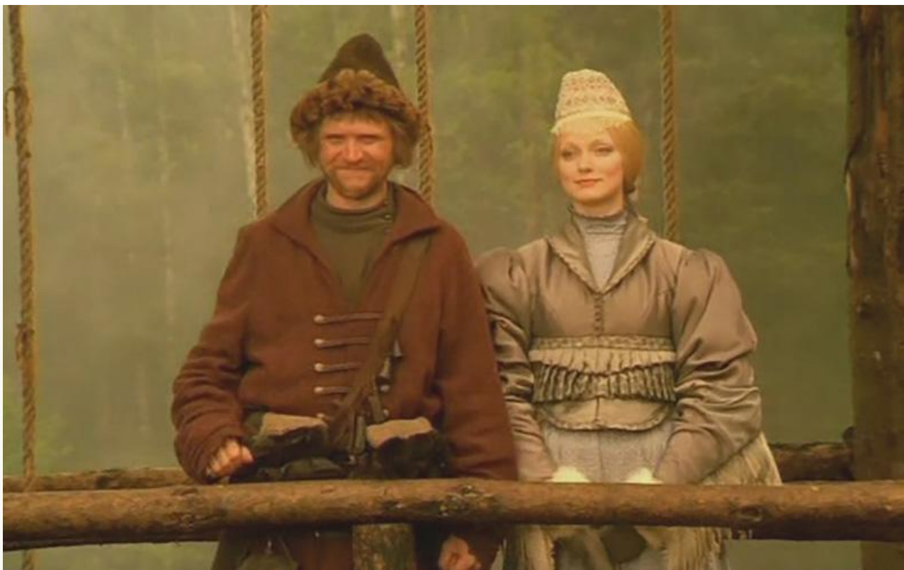
Маруся в фильме «Сказ про Федота- Стрельца», 2001 год