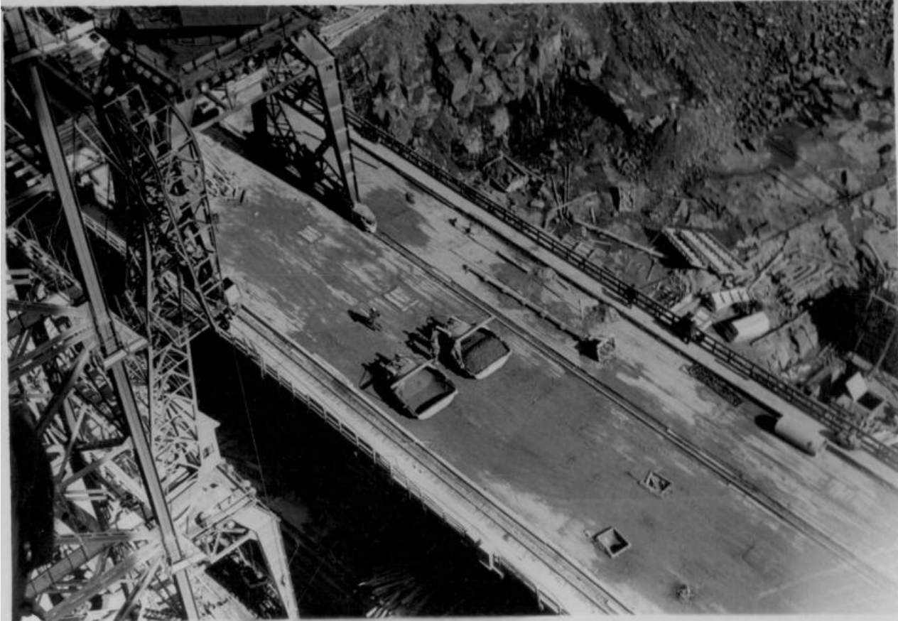
Архивные фото строительства Братской ГЭС в 1961

А каким видят ее будущее наши потомки? В нашем воображении она не просто работает –она преобразилась.