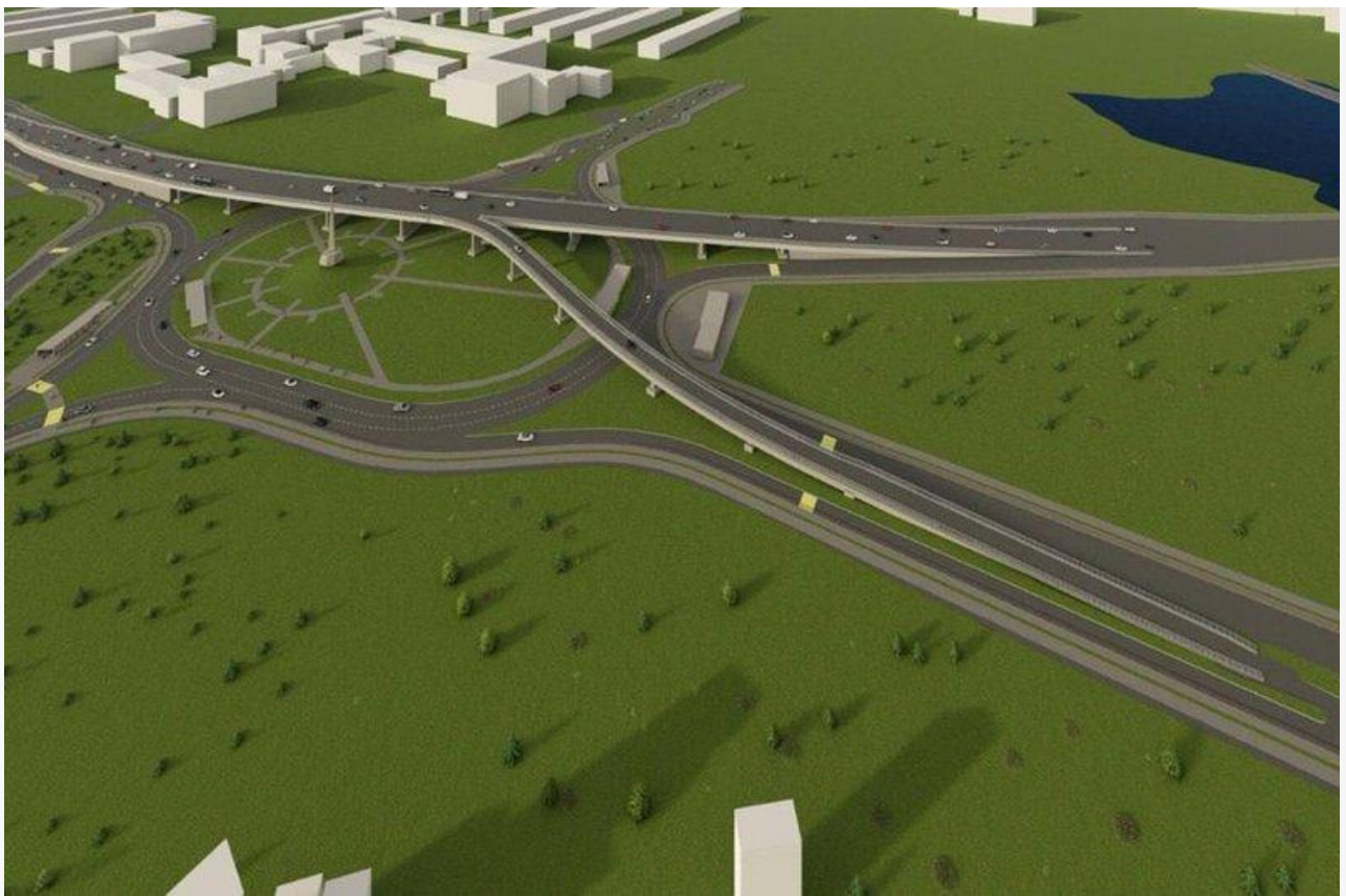
Проект модернизации Байкальской развязки

А в фантазиях о далеком будущем у читателей телеграм канала «Иркутск. Дальше некуда» эта развязка выглядит иначе: