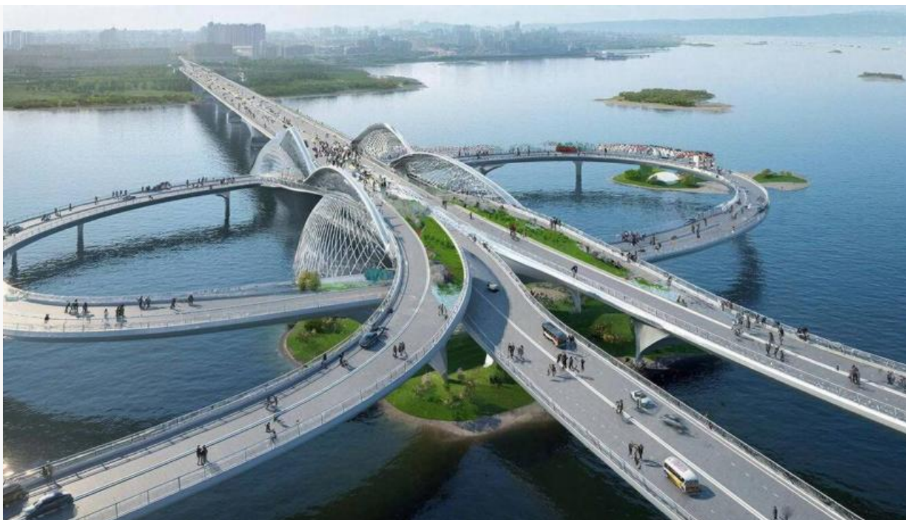
Для Иркутска мы предложили проект модернизации Глазковского моста

Еще одна большая тема для региона – воздушные ворота. Правительство уже приняло решение: новый международный аэропорт Иркутска будет построен в районе Пади Ключевой в пригороде Ангарска. Аэропорт класса «А» будет способен принимать самые большие самолеты и обслуживать до 10 миллионов пассажиров в год.