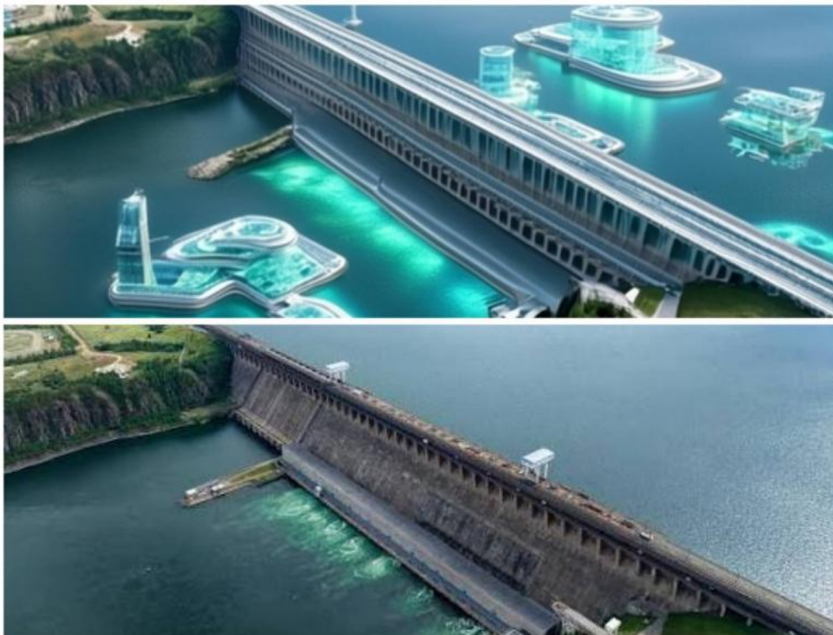
Будущее и настоящее Братской ГЭС