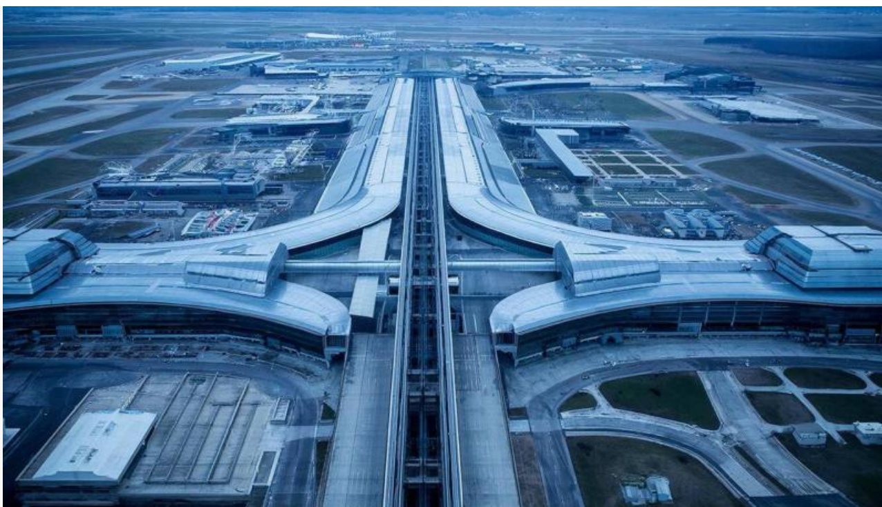
Наш проект аэропорта

Мы предложили нашим читателям порассуждать о будущем аэропорта. Большинство поддержало план правительства, признав, что перенос – единственный логичный выход для развития. Но немало голосов было и за второй вариант: оставить аэропорт на месте, модернизировав его до неузнаваемости.