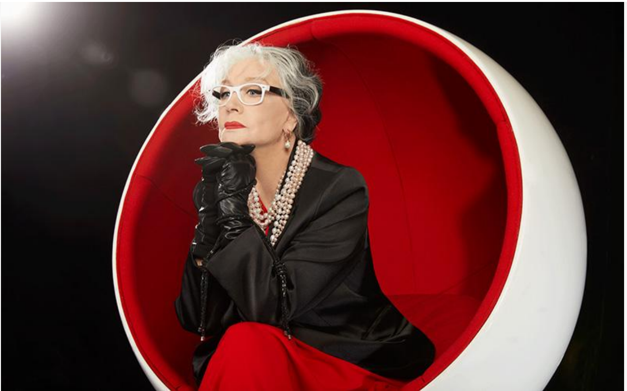
Хелена Рубинштейн в спектакле «Мадам Рубинштейн». Театра Пушкина, постановка 2022 года

В кино Вера Алентова дебютировала в год окончания Школы-студии, снявшись в драме Николая Литуса и Леонида Ризина «Дни лётные».