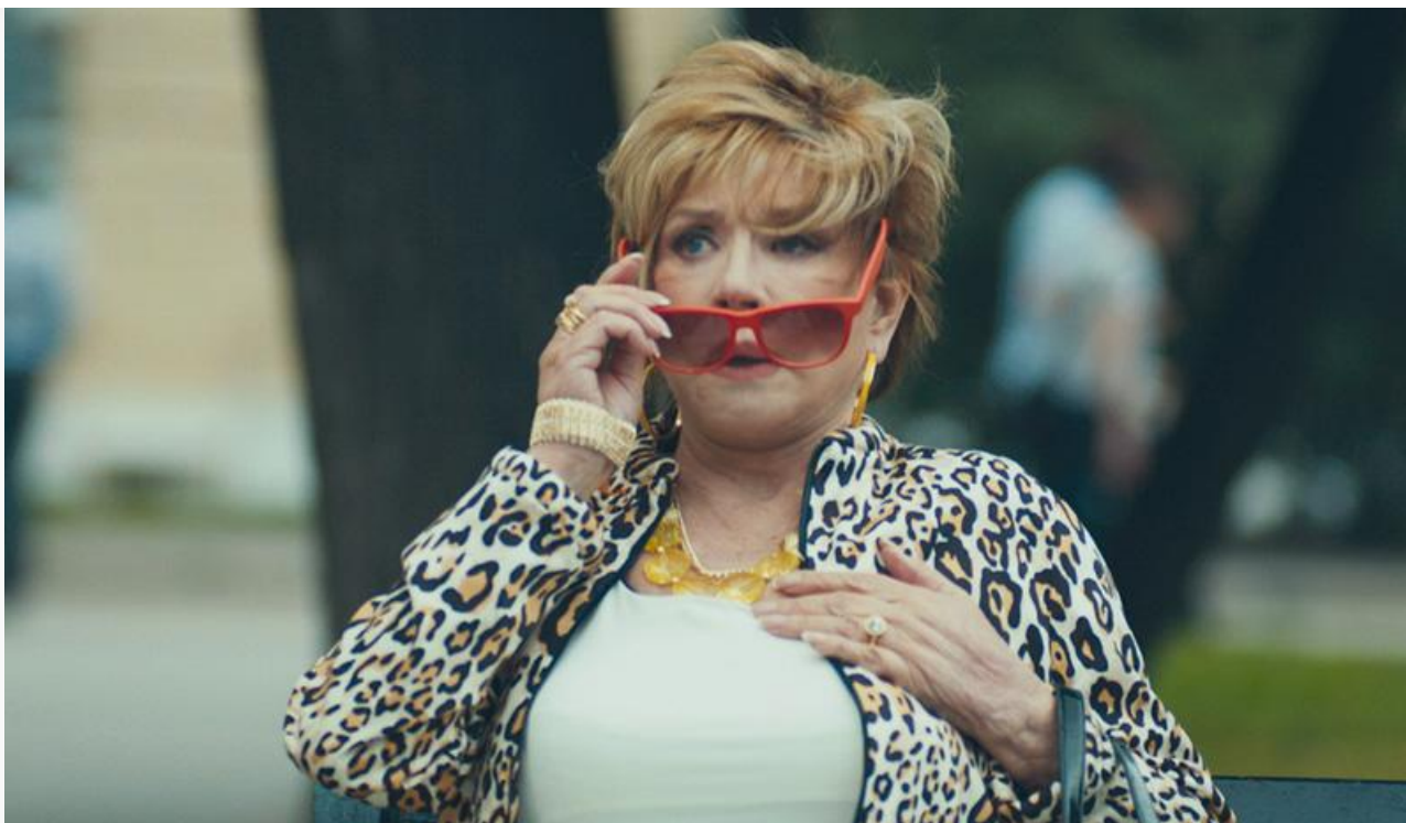
Галина Семёновна в фильме «С 8 марта, мужчины!», 2014 год

В 1982 году ведущая актриса Театра Пушкина стала заслуженной артисткой РСФСР. Спустя ещё десять лет ей было присвоено звание «Народная артистка Российской Федерации».