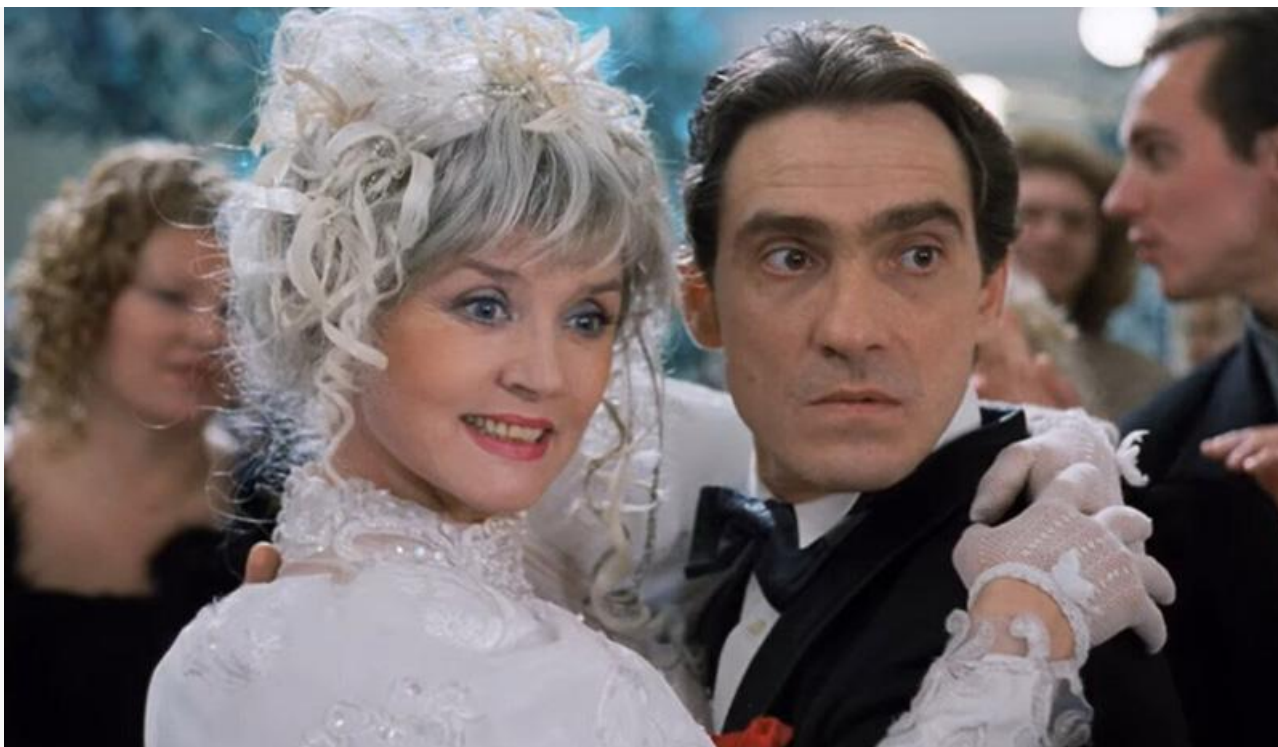
Кэрол Абзац в фильме «Ширли-мырли», 1995 год