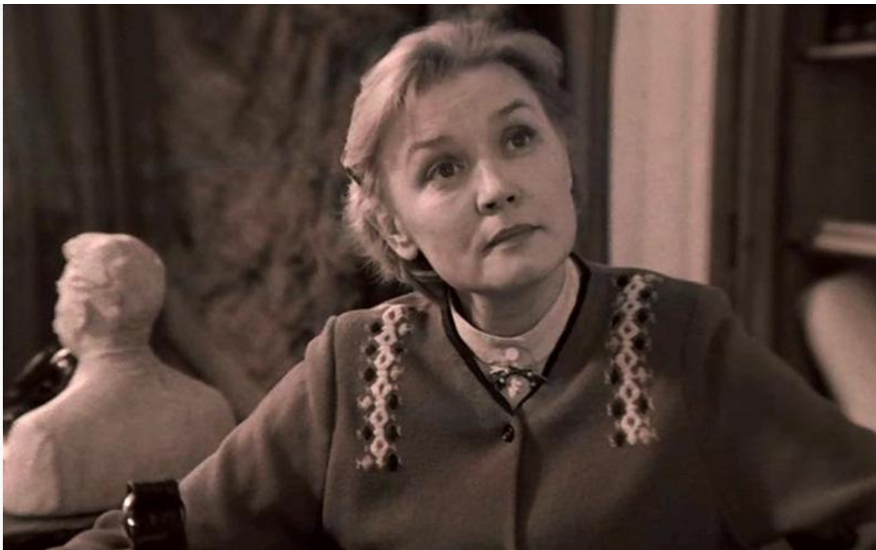
Валендра в фильме «Завтра была война», 1987 год