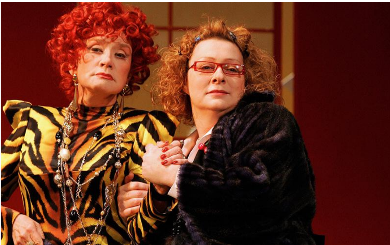
Люсиль в спектакле «Девичник club». Театр Пушкина, постановка 2006 года