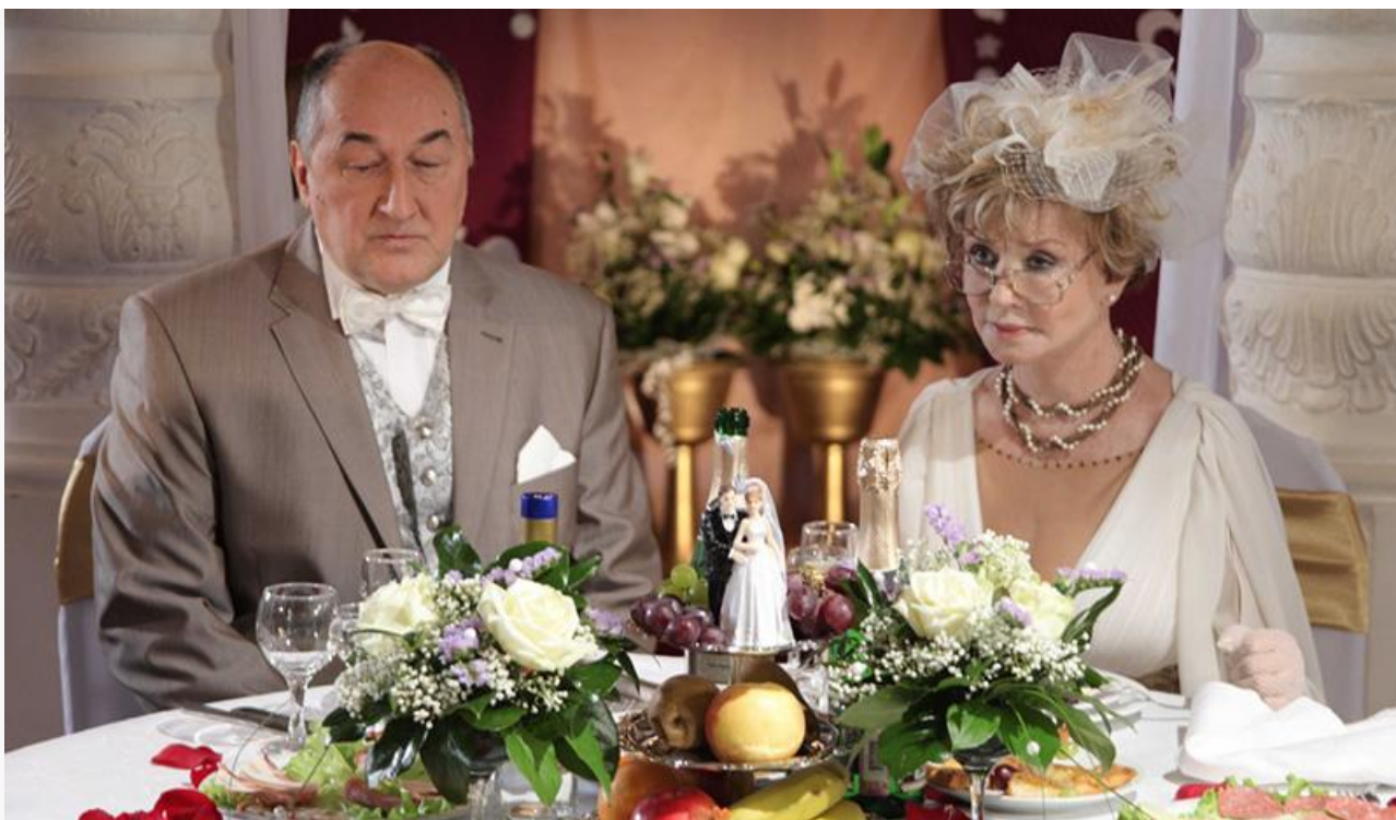
Зинаида Семёновна в фильме «Бальзаковский возраст, или Все мужики сво... 5 лет спустя», 2013 год