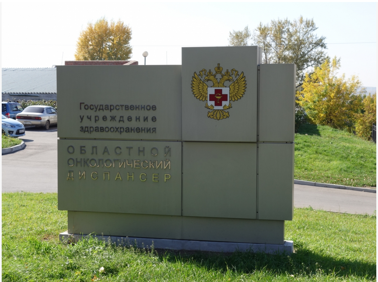
Автор: Алёна Штерн

Автор: Алина Саратова © Babr24.com СКАНДАЛЫ, ЗДОРОВЬЕ, НЕДВИЖИМОСТЬ, ИРКУТСК 👁 42 25.12.2025, 08:19