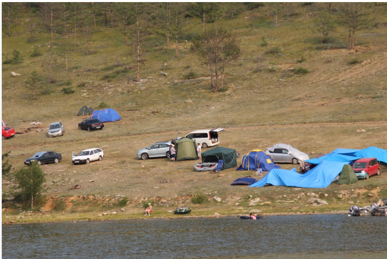
Автор: Даниил Тетерин Фото из альбома "Турбазы и гостиницы на Байкале" © Фотобанк "RuBabr"

Автор: Алина Саратова © Babr24.com ЭКОНОМИКА, ТУРИЗМ, ИРКУТСК 👁 61 19.12.2025, 13:55