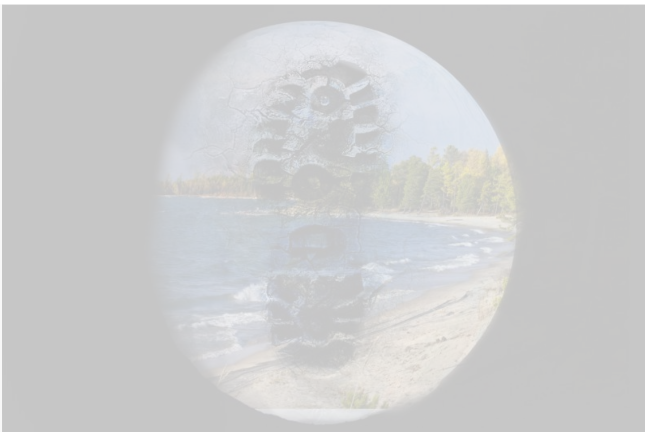
Око Байкала (@okolo_baikala)