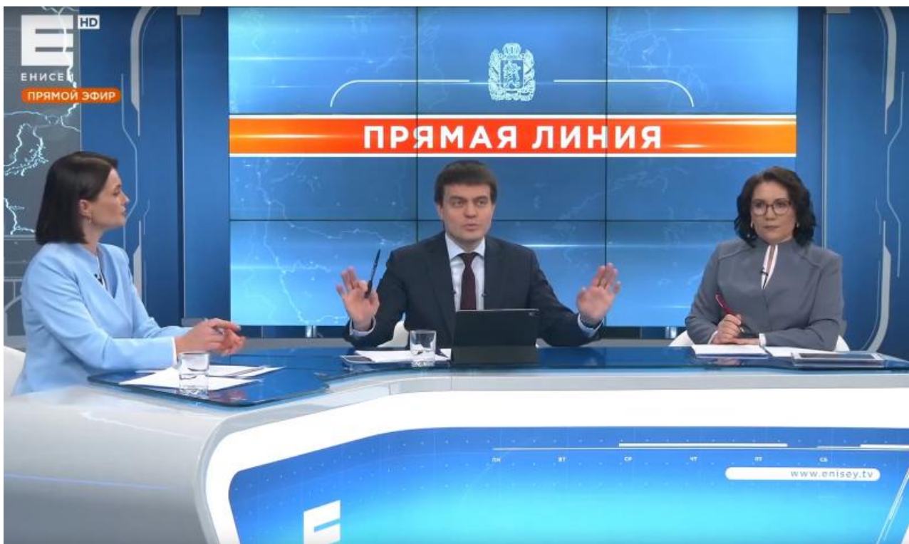
Фото: скрины телеканала «Енисей», t.me/kras_golub

Автор: Валерий Лужный © Babr24.com ОБЩЕСТВО, ПОЛИТИКА, СКАНДАЛЫ, КРАСНОЯРСК 12.12.2025, 19:14 0 180