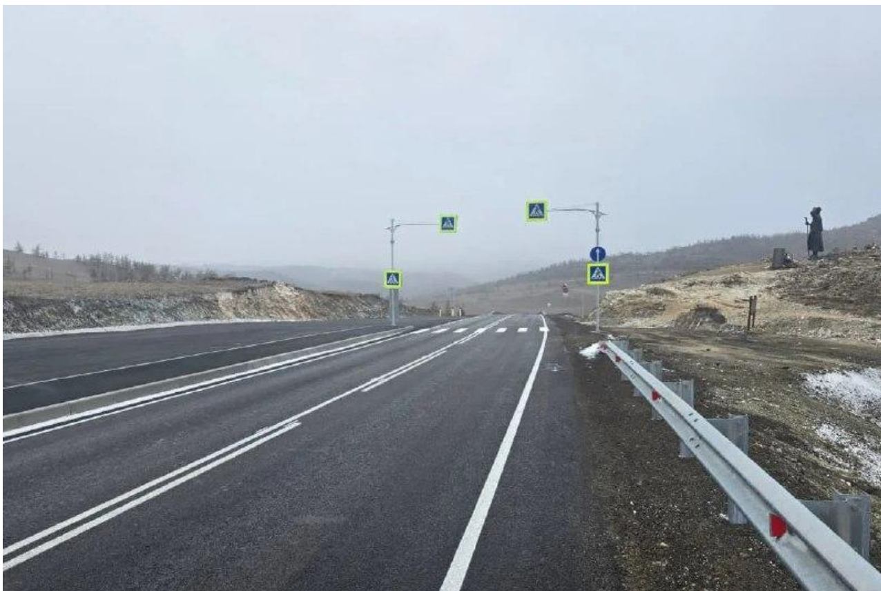
Фото: телеграм-канал Игоря Кобзева

Автор: Алина Саратова © Babr24.com ТРАНСПОРТ, ИРКУТСК 👁 161 12.12.2025, 13:43 📌 0