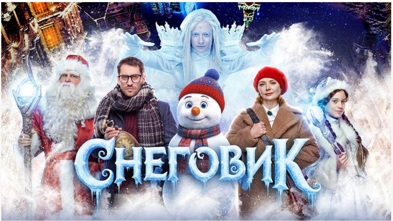
Постер к фильму «Снеговик»