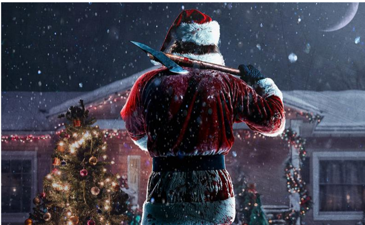
Постер к фильму «Тихая ночь, смертельная ночь»