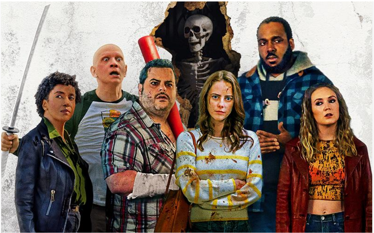
Постер к фильму «Дело семейное»