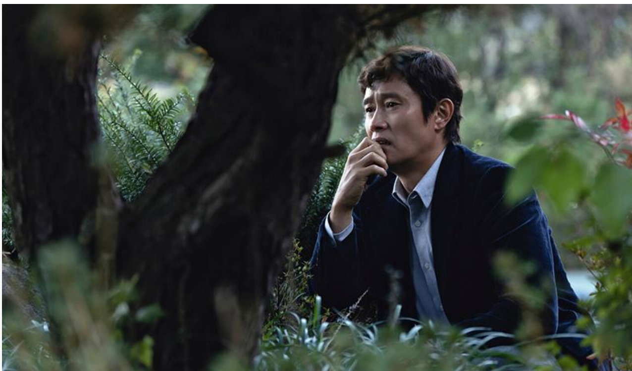
Ли Бён-хон в фильме «Метод исключения»

Кроме «Иллюзии обмана» места в топ-10 сохранили «Письмо Деду Морозу» (23,6 миллиона с потерей в сборах 49 % и четвертое место), «Горыныч» (16,8 миллиона с потерей в сборах 54 % и седьмое место), «Умри, моя любовь» (15,8 миллиона с потерей в сборах 58 % и девятое место) и «Маша и Медведи» (14,2 миллиона с потерей в сборах 67 % и десятое место).