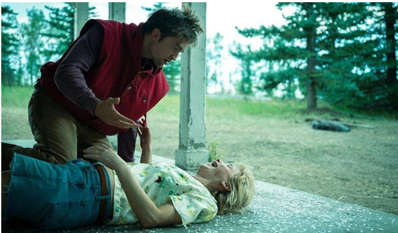
Дженнифер Лоуренс и Роберт Паттинсон в фильме «Умри, моя любовь»

Общая касса топ-20 фильмов уикенда составила 627,8 миллиона рублей. Это на 5,42 % меньше по сравнению с предыдущими выходными .