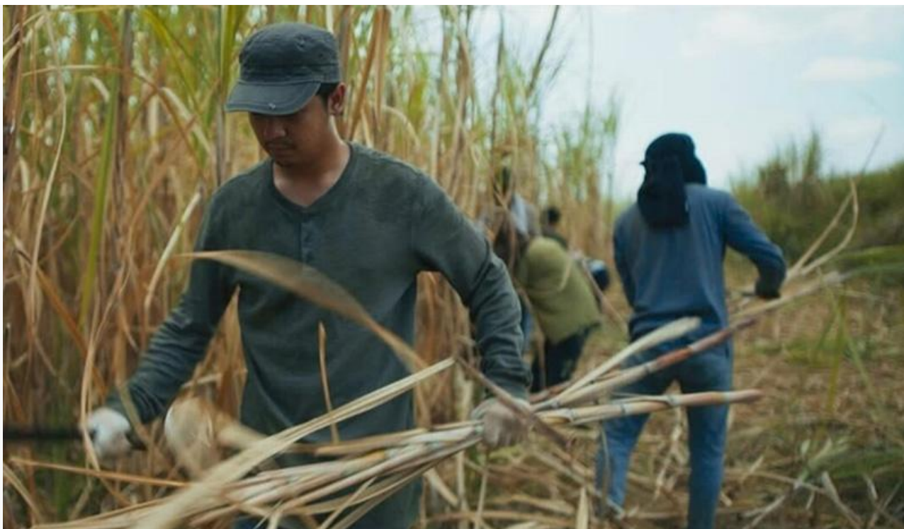
Кадр из фильма «Сахарная фабрика»