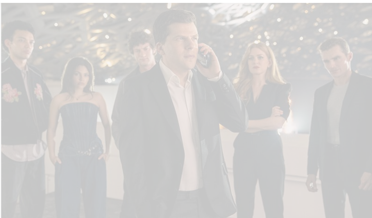
Кадр из фильма «Иллюзия обмана 3»

Общие сборы криминального триллера Рубена Фляйшера к вечеру воскресенья составили 1,56 миллиарда рублей. Это на сегодня пятый результат года. Позади оставлены и «Горыныч», и «Август», и «Кракен» с «Дракулой», а до третьего места, которое сейчас занимает «Пророк. История Александра Пушкина», «Иллюзии» не хватает всего 99 миллионов, которые она без проблем соберёт к концу текущей недели.