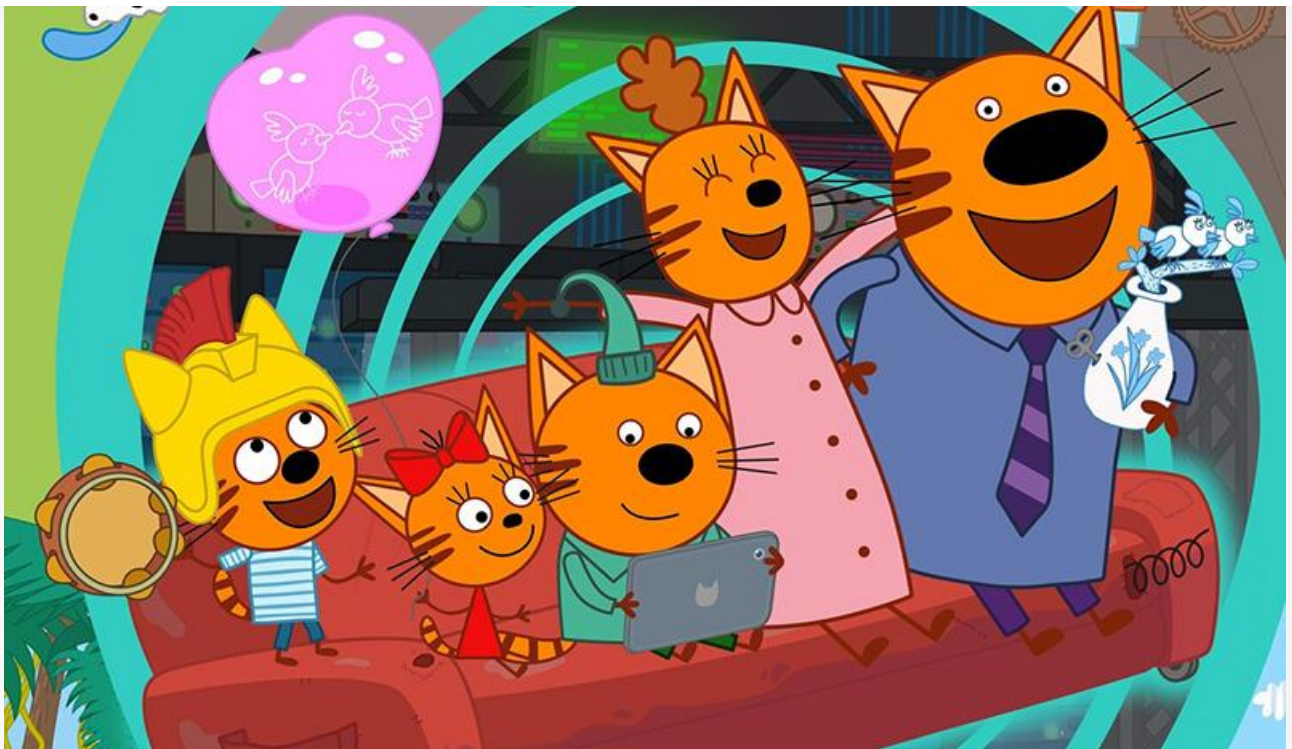
Постер к фильму «Три кота. Путешествие во времени»

Поклонников голливудских мелодрам порадует «Сожалению о тебе» (18+) Джоша Буна.