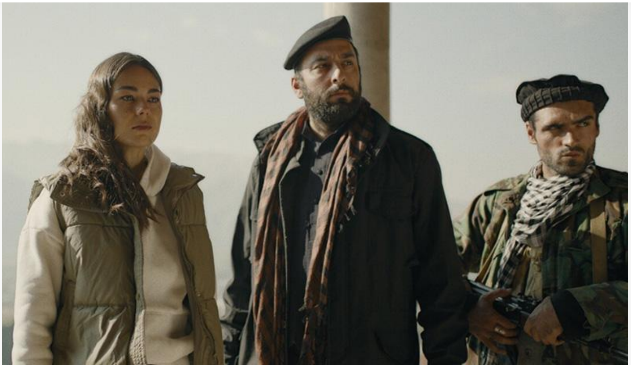
Кадр из фильма «Тропа гнева»