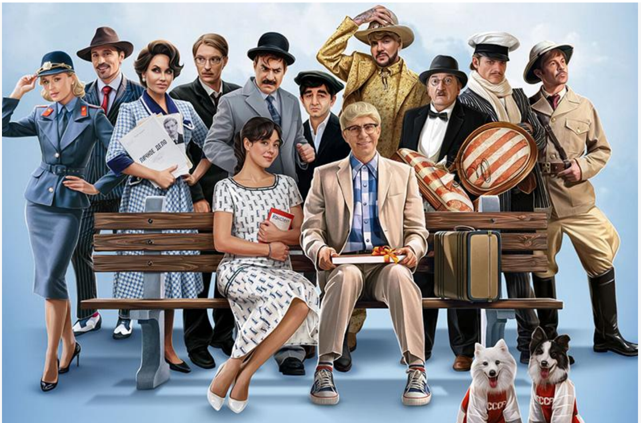
Постер к фильму «Невероятные приключения Шурика»