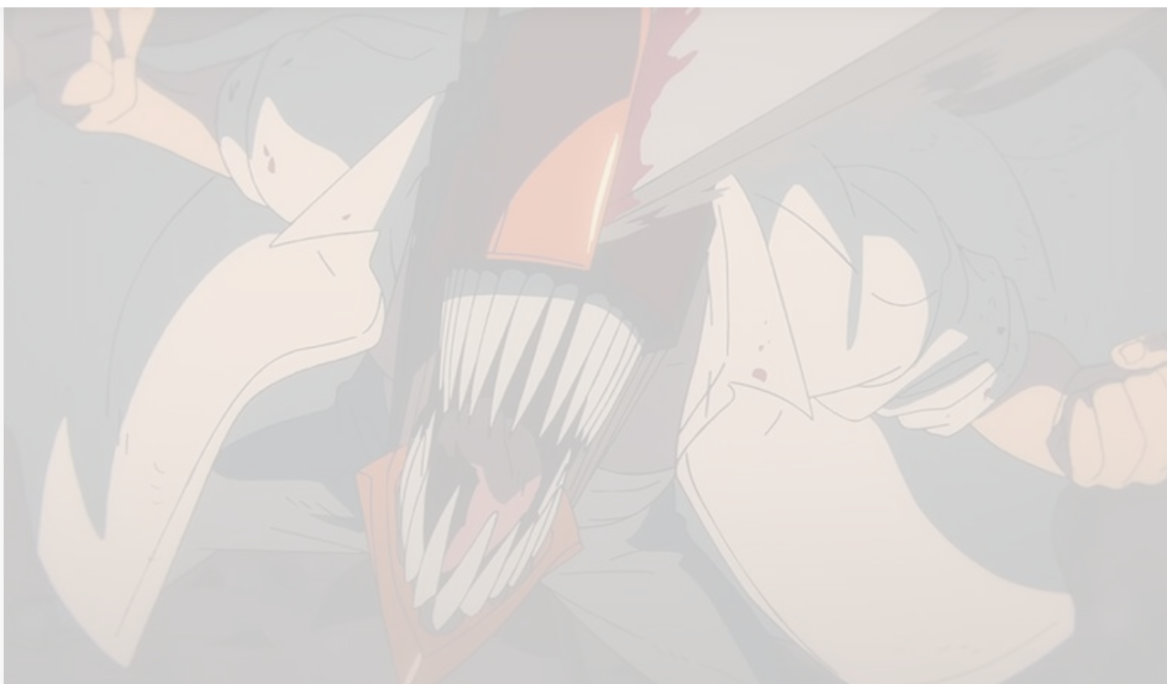
Кадр из фильма «Человек-бензопила». Фильм: История Резе»