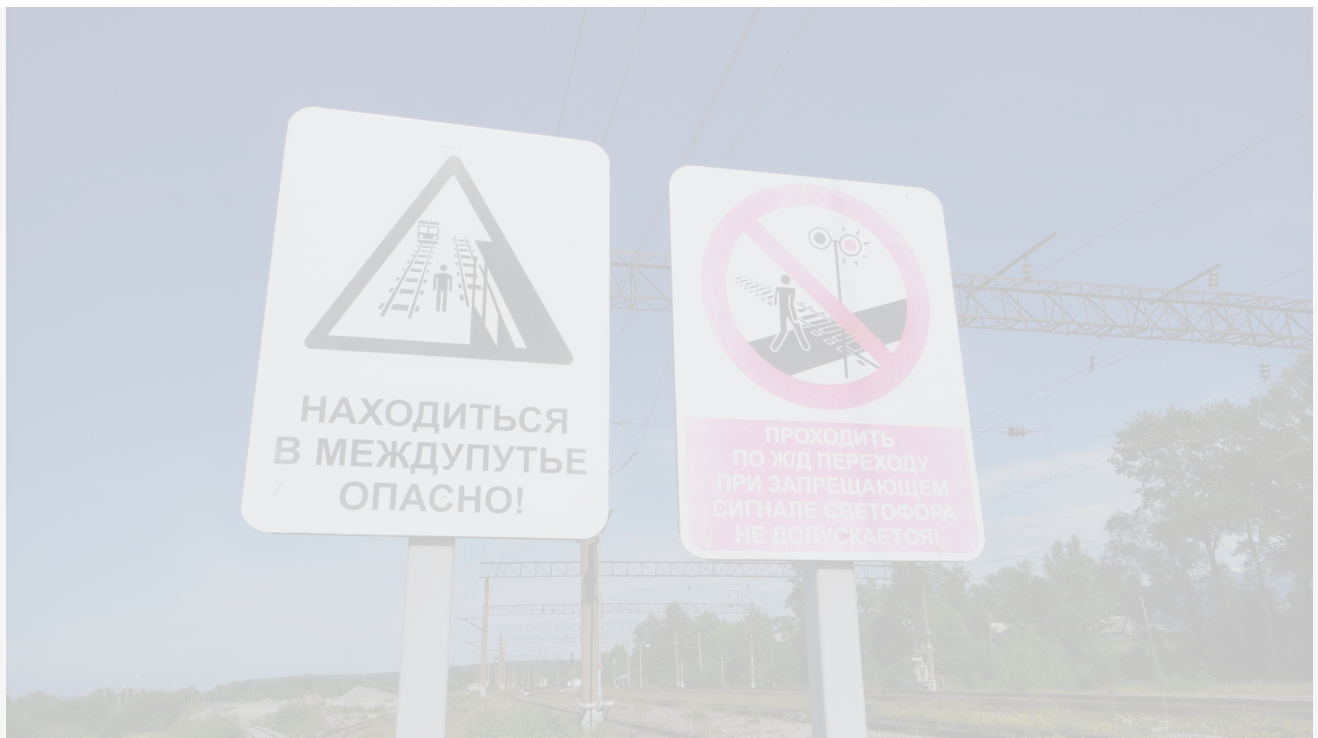
Автор: Ольга Новикова

Не выдерживают нагрузки на экономику ни гиганты федерального уровня, ни средние предприниматели. Так, например, гигант лесопромышленной отрасли группа компаний «Сегежа» и вовсе закрыл одно из представительств в Иркутской области: предприятие в городе Усть-Куте с лета 2025 года идет по процедуре ликвидации. Без работы остаются тысячи сотрудников. Аналогов трудоустройства в данной сфере в северном городе нет. А значит впереди его ждет маховик оттока населения или перехода бывших лесников на вахтовый режим работы.