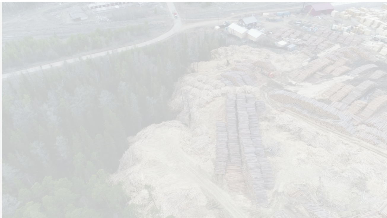
Фото из альбома "Лесная промышленность и лесозаготовки" © Фотобанк "RuBabr"