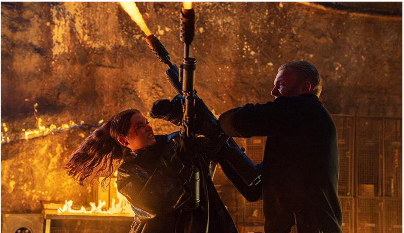
Кадр из фильма «Балерина»

Покинули десятку лучших «Кракен», «Жизнь Чака», «Притворись моим мужем», «Астрал. Остров проклятых» и «Верни её из мёртвых».