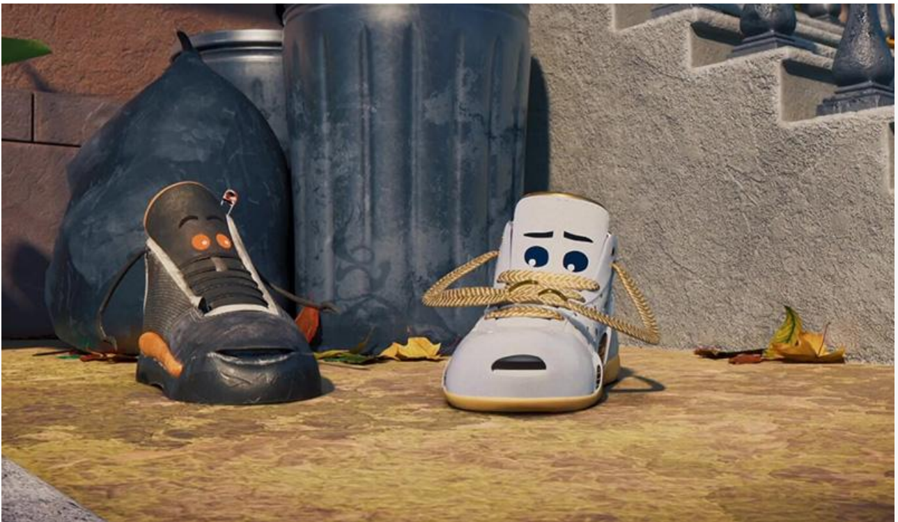
Кадр из фильма «Кроссы»

Серебряный призёр предыдущего уикенда – « Балерина » Лена Уайзмана – потерял в сборах 53 % и с прибылью 45,2 миллиона опустился на третью строку чарта.