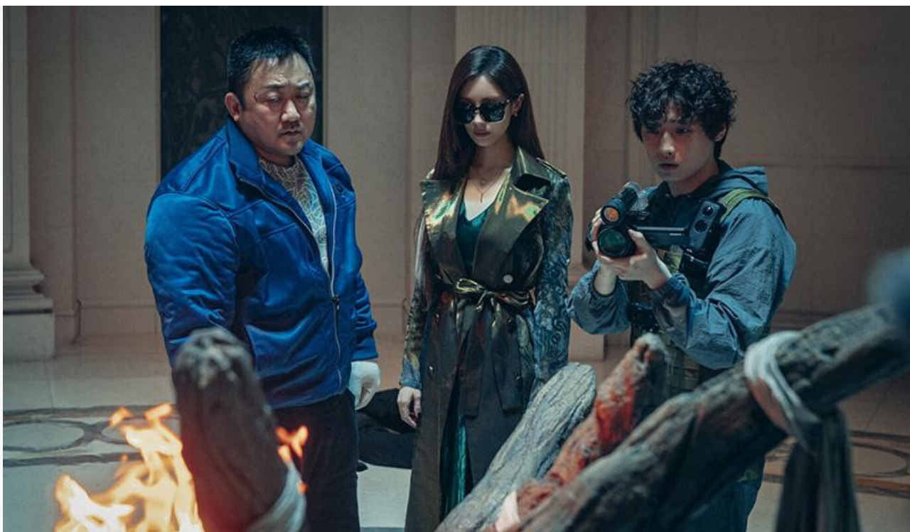
Кадр из фильма «Святая ночь. Охотники на демонов»