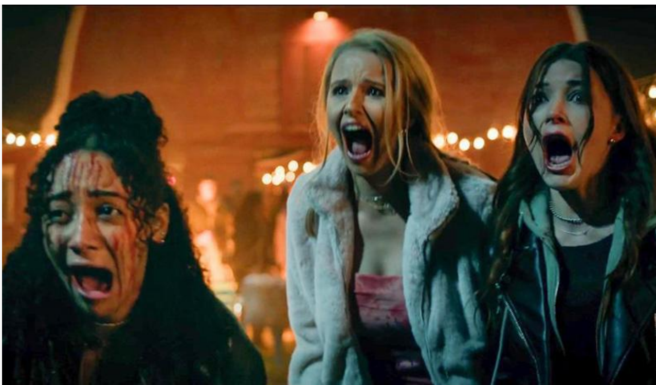
Кадр из фильма «Кровавый урожай»