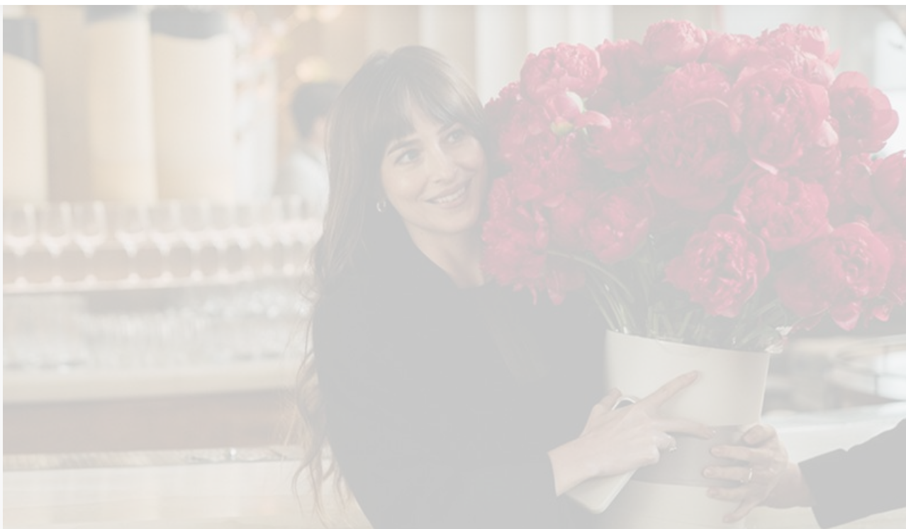
Дакота Джонсон в фильме «Материалистка»

Пожалуй, у «Материалистки» действительно могли быть шансы побороться за первую строку чарта, тем более что конкурентов в борьбе за лидерство в прокате у неё и российского «Дедушки» в наступающем уикенде не предвидится. Проблема в том, что информация от прокатчиков о «выдающемся сарафане» слегка преувеличена: отзывы на фильм весьма средние, а рейтинг «Материалистки» на портале «Кинопоиск» замер на отметке 6,5. «На деревню дедушке» при этом уверенно держит рейтинг 7,0.