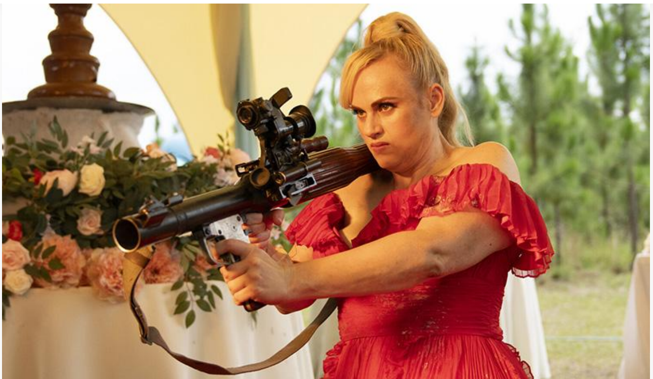
Кадр из фильма «Шпионская свадьба»

Также выходят на экраны казахстанская спортивная драма с Никитой Кологривым от Даулета Жумабаева «Арлан. Решающий раунд» , казахстанская комедия Рустема Омарова «Патруль. Миссия Тамби» (18+), американская биографическая драма Майкла Кристофера «Великая Лилиан Холл» с Джессикой Лэнг в образе знаменитой бродвейской актрисы, франко-болгарский триллер Жереми Минуи «Смерть в лифте» (18+), германская драмеда Фредерика Хамбалека «Что знает Мариэль» (18+), номинированная на «Золотого медведя» минувшего Берлинского кинофестиваля, южнокорейский боевик ужасов Лима Дэ-хи «Святая ночь. Охотники на демонов» (18+), южнокорейский мультфильм «Мистер Робот» (18+) и полностью созданный при помощи искусственного интеллекта отечественный мультфильм «Чингис-Хан» .