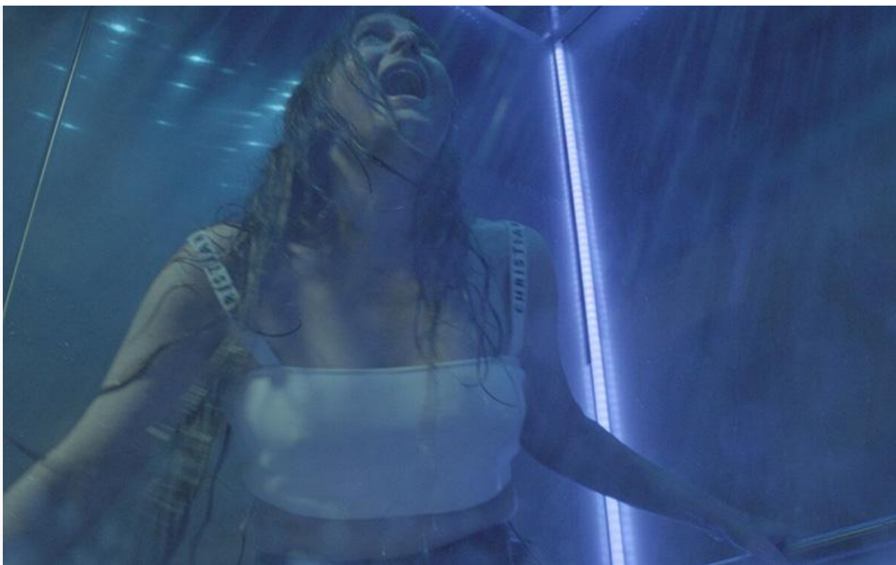
Постер к фильму «Смерть в лифте»