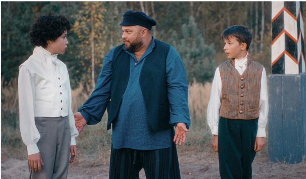
Кадр из фильма «Артек. Сквозь столетия»

Общая касса топ-20 фильмов уикенда составила 430,4 миллиона рублей. Это на 16,28 % меньше по сравнению с предыдущими выходными .