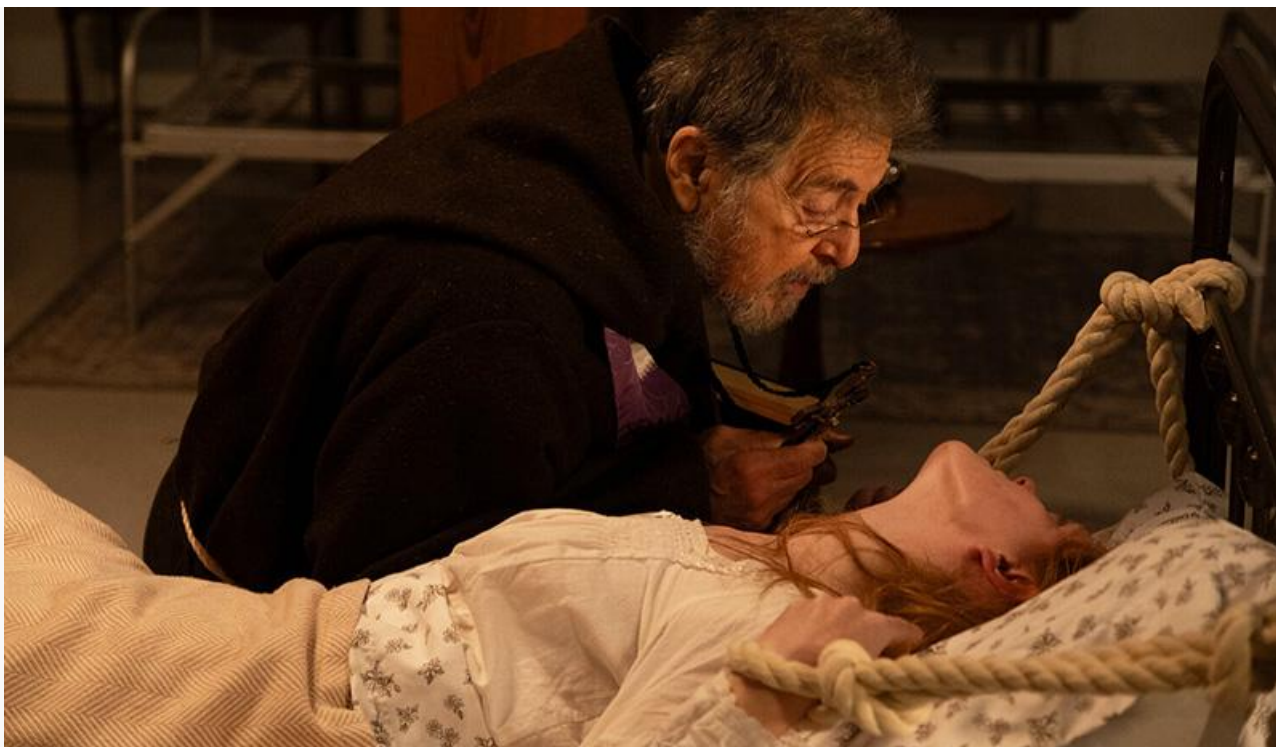
Кадр из фильма «Ритуал»