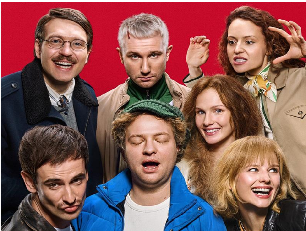
Постер к фильму «Качели»