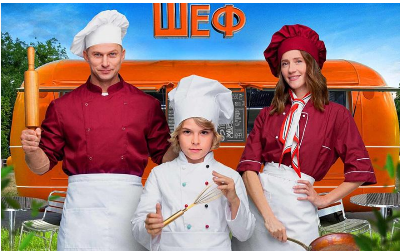
Постер к фильму «Маленький шеф»