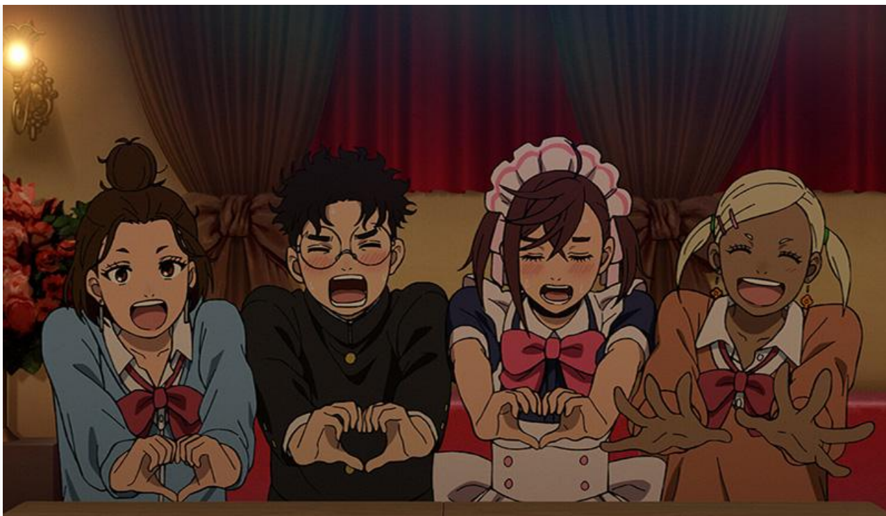
Кадр из фильма «Дандадан: Злой глаз»