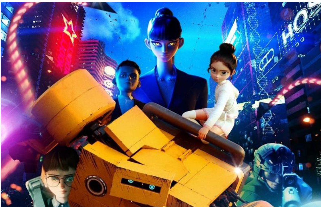
Постер к фильму «Мистер Робот»