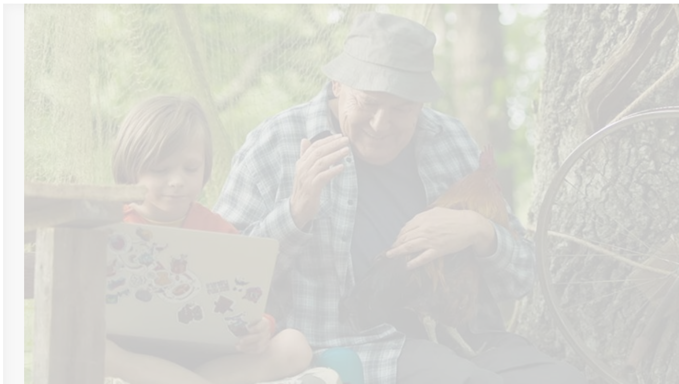
Кадр из фильма «На деревню дедушке»