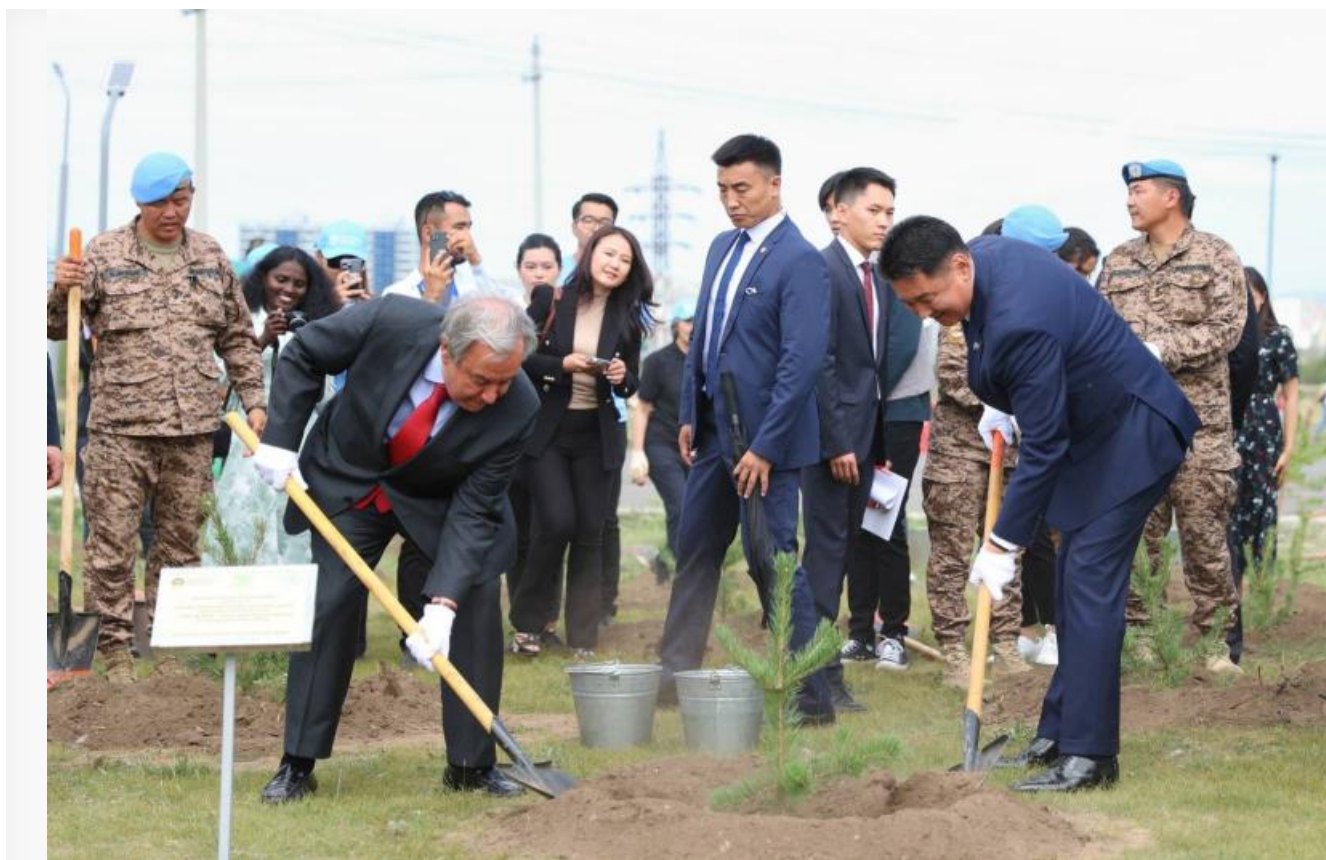
Экс-президент Монголии У.Хүрэлсүх помогает высаживать саженцы в рамках госпрограммы «Миллиард деревьев»

Проблему усугубляет также и слабое регулирование. Во многих аймаках нет контроля за арендаторами земель, нет данных о водоносных горизонтах, а фермеры действуют по принципу «здесь и сейчас». При этом в последние годы мы можем наблюдать политизацию темы: власти стараются делать заявления под крупные международные события, но реального финансирования на местах катастрофически не хватает .