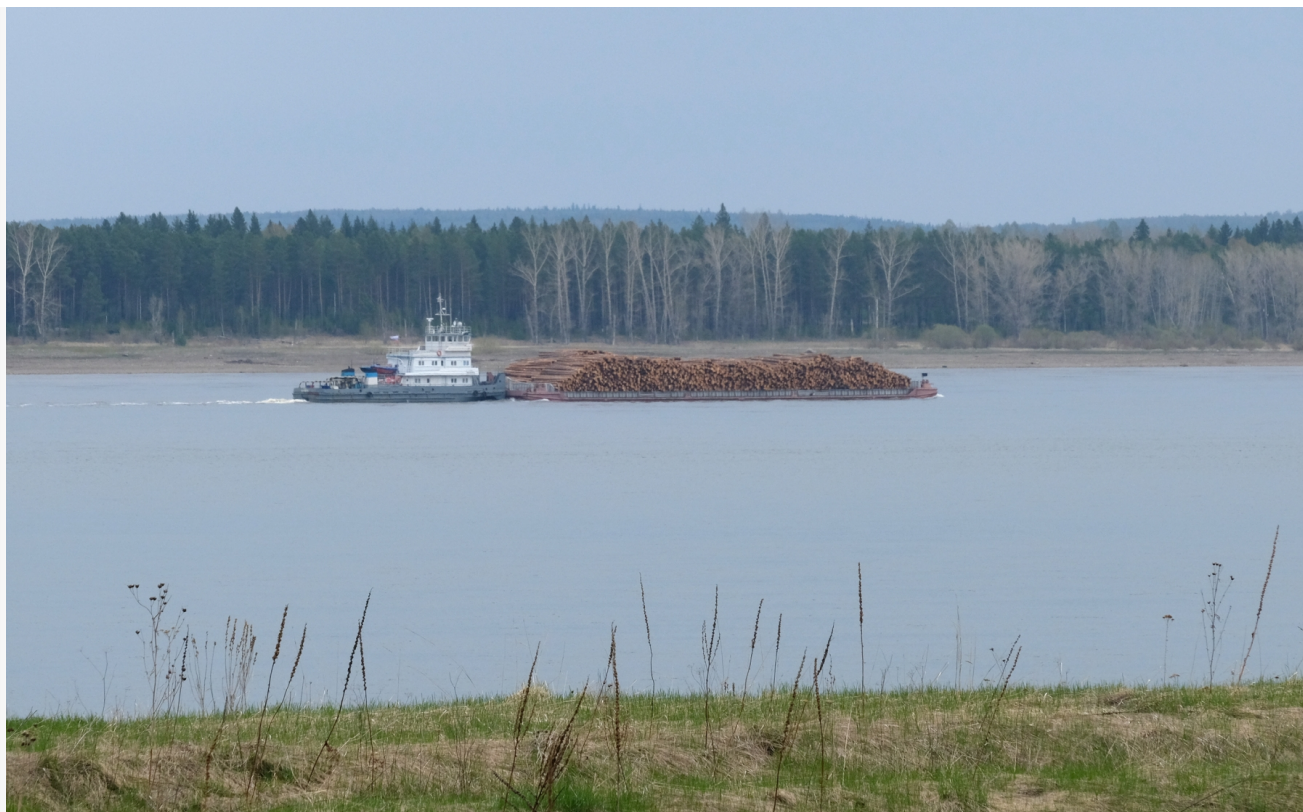
Автор: Алёна Штерн Фото из альбома "Красноярский край. Енисейский район. Река Енисей" © Фотобанк "RuBabr"

Специалисты говорят, что на устранение последствий аварии уйдёт минимум десять дней. Пока ситуация в районе Казачинских порогов стабилизировалась, спасатели обеспечены всем необходимым, включая сорбенты. Однако остаётся открытым главный вопрос: кто и как будет нести ответственность. Министерство экологии края занимается мониторингом загрязнения, Росприроднадзор — оценкой ущерба, но реальное восстановление требует времени и вложений.