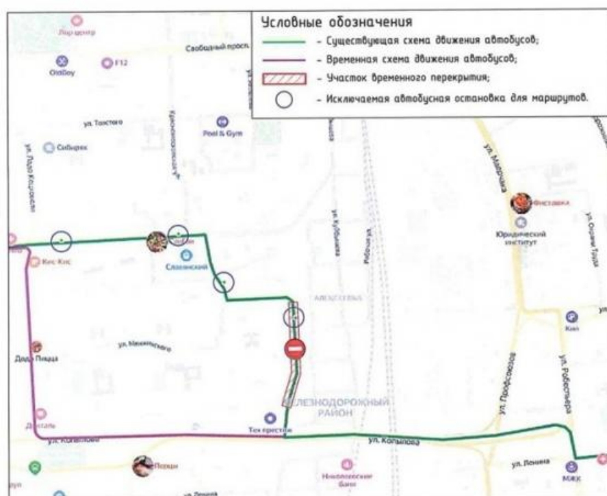
Схема движения автобусов маршрут №90 на период производства работ по пер. Боготольский

Тем самым жителям улицы Новосибирской, чтобы попасть к своим домам придется теперь делать круг через улицу Ладю Кецовели. В департаменте градостроительства пояснили, что перекрытие Боготольского переулочка продлится 2,5 года, пока не закончатся раскопки. После и сама реконструкция, к которой приступят только в следующем году.