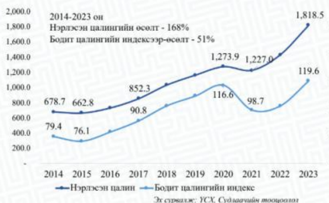
Барилгын салбарт ажиллагчдын сарын дундаж нэрлэсэн цалин ба бодит цалингийн индекс (ХҮИ, 1995=100)

Улсын дүнгээр: Нэрлэсэн цалингийн өсөлт 143%, бодит цалингийн өсөлт 23%