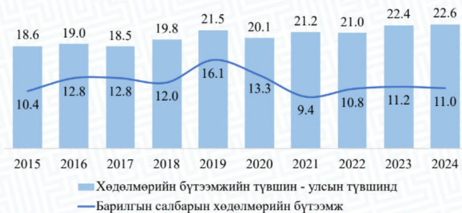
Барилгын салбарын нэг ажиллагчид ногдох бодит ДНБ

2015-2024 оны энэ өнгөрсөн 10 жилд тус салбарын хөдөлмөрийн бүтээмж 12 сая орчимд хэлбэлзэж өөрөөр хэлбэл бүтээмж доривтой өсөөгүй байна.