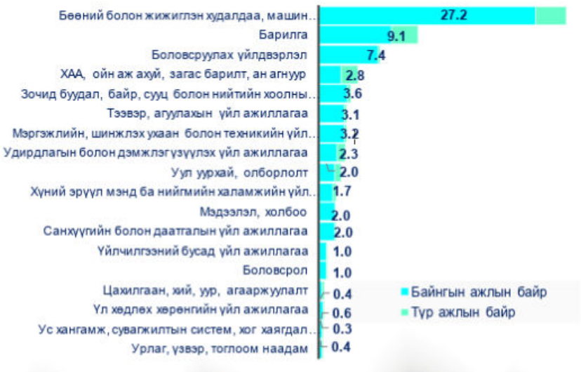
Зураг 8. 2025 оны ажиллах хүчний эрэлт, салбарын ангиллаар

Работа в строительстве зависит от сезона. Летом количество занятых растёт, зимой — резко падает. Такая нестабильность не привлекает квалифицированных специалистов. Вся строительная активность сосредоточена в Улан-Баторе. Там работает 74,8 % всех строителей страны . Регионы, особенно гобийская зона, остаются без развития и рабочих мест.