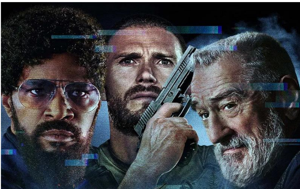
Постер к фильму «Игры возмездия»