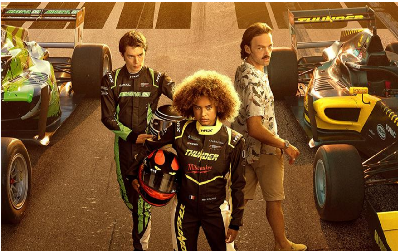
Постер к фильму «Быстрее ветра»