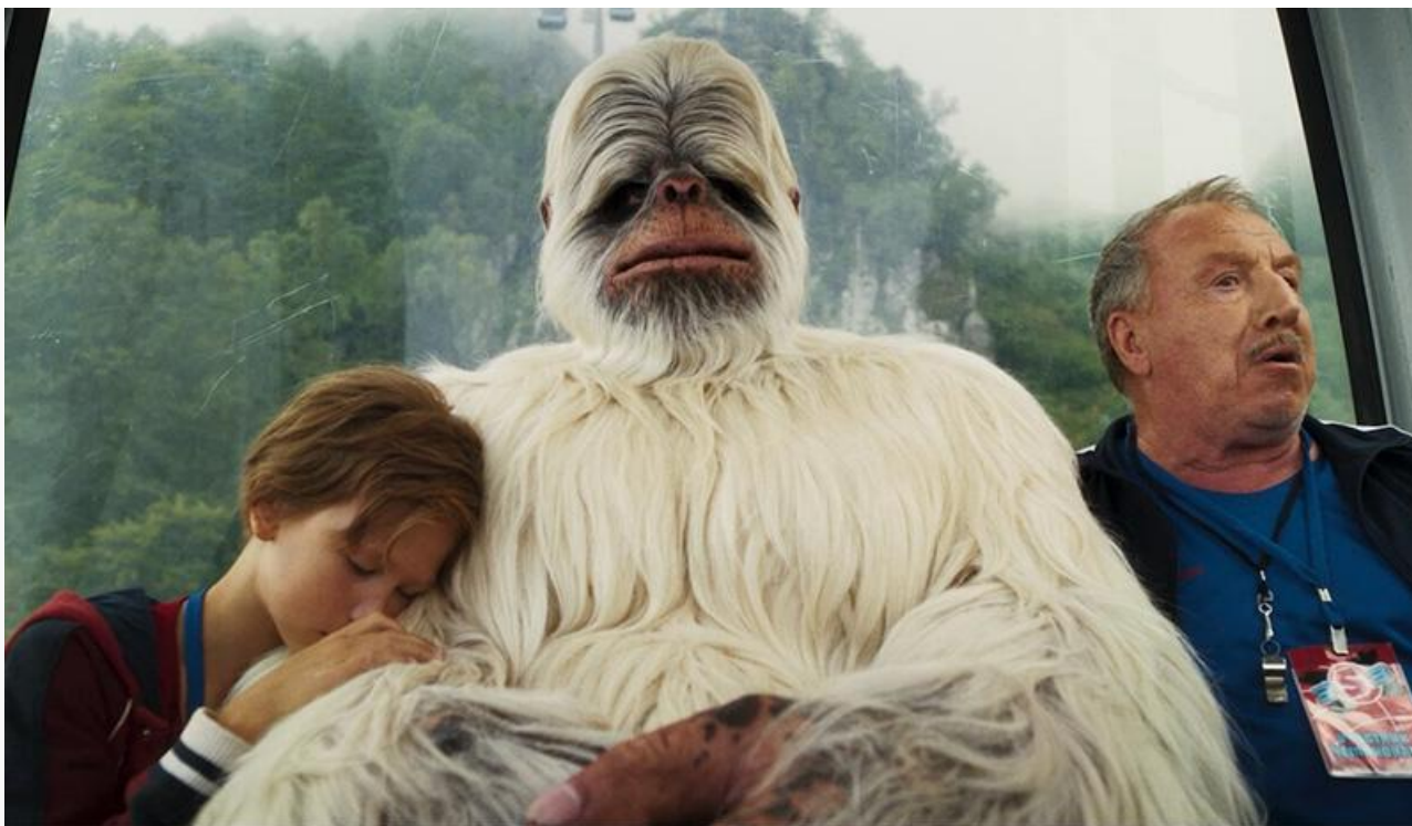
Кадр из фильма «Снежный человек»

Главным конкурентом отечественного релиза выглядит нашумевший китайский мультфильм Яна Юя «Нэчжа побеждает Царя драконов» , который выходит на российские экраны в статусе самого кассового мультфильма и самого кассового неголливудского фильма в истории.