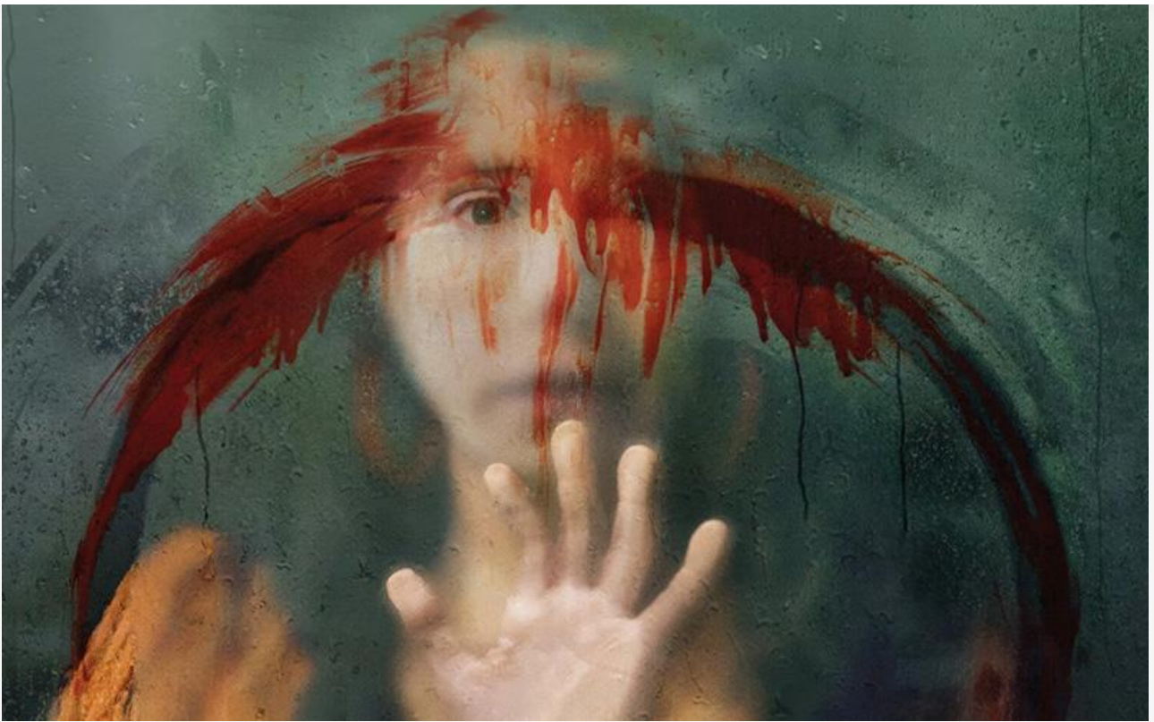
Постер к фильму «Верни её из мёртвых»

Видео дня. The Weeknd в нереальном «Последнем завтра»