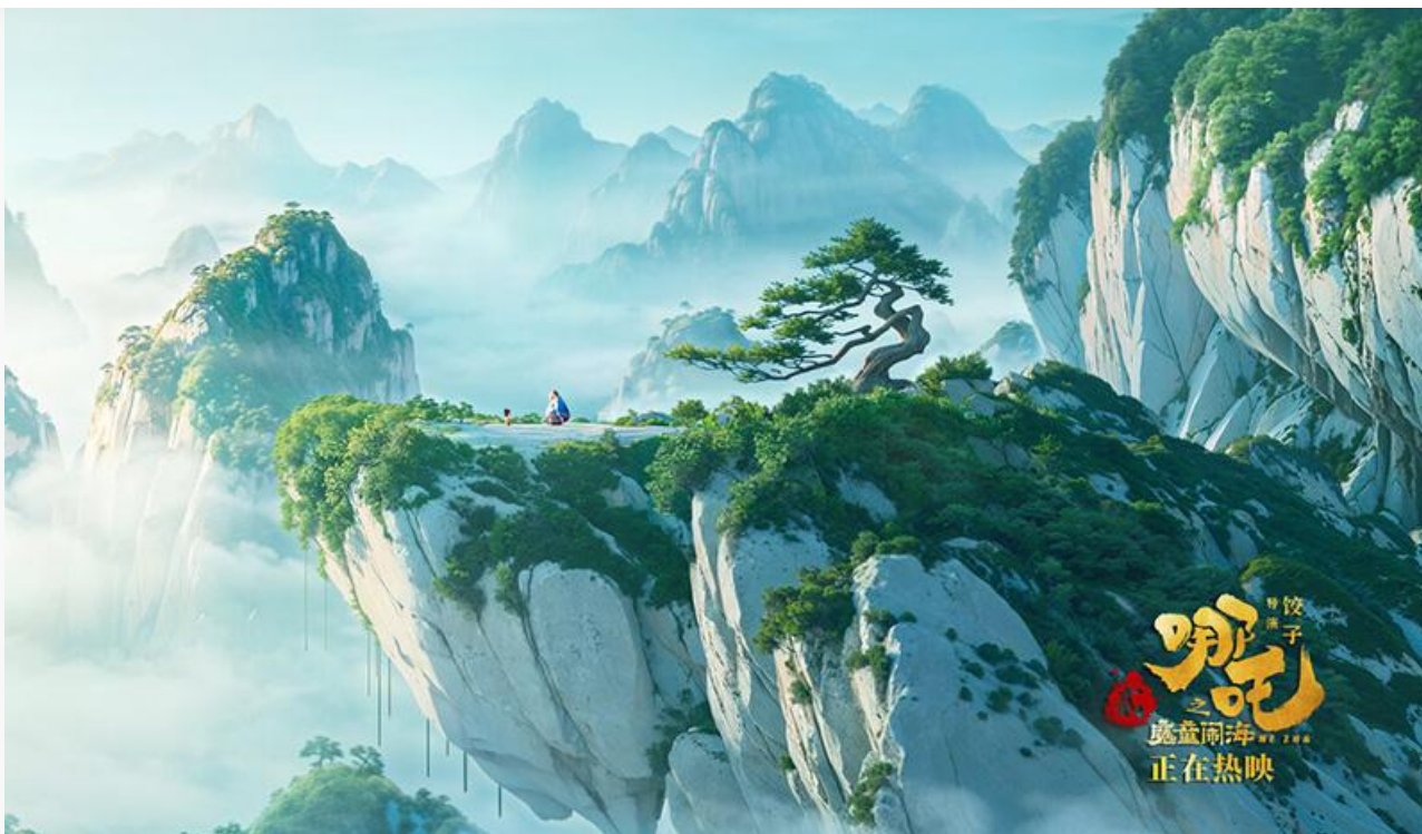
Кадр из фильма «Нэчжа побеждает Царя драконов»