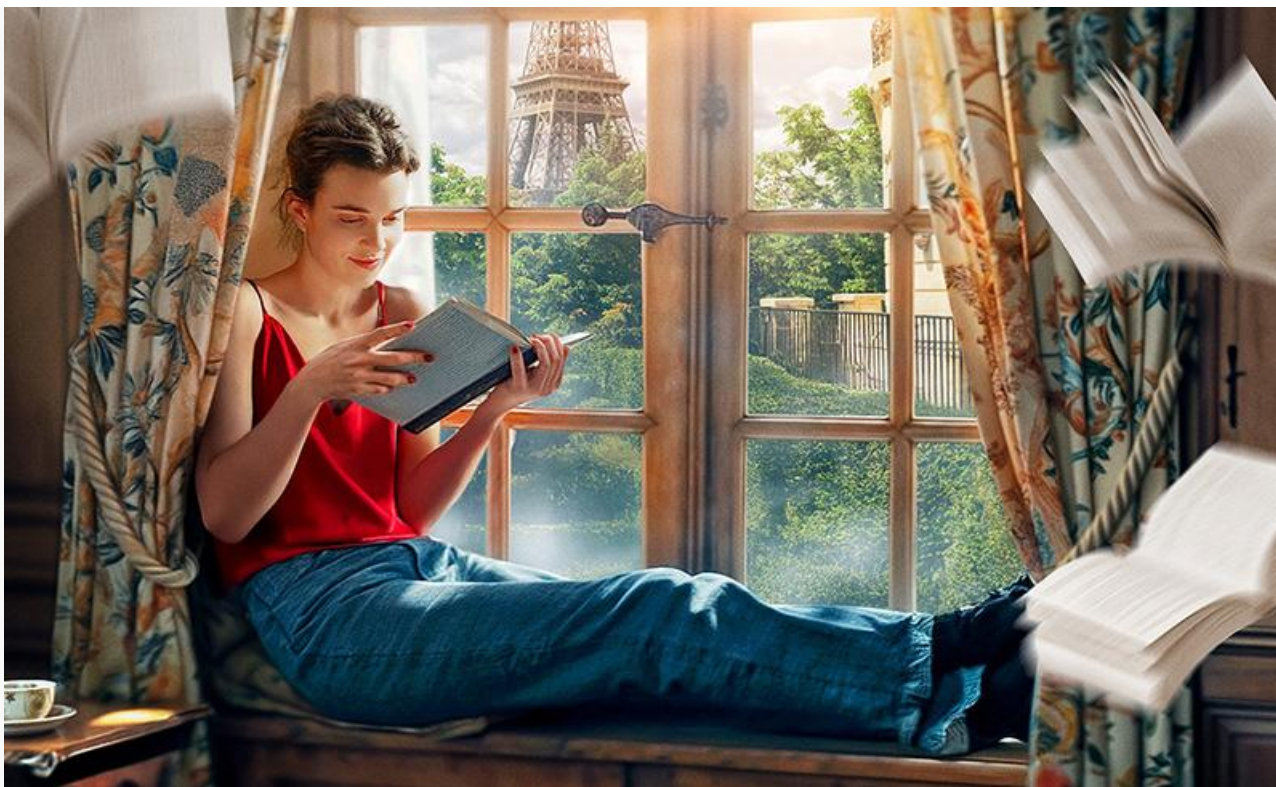
Постер к фильму «Джейн Остин испортила мне жизнь»