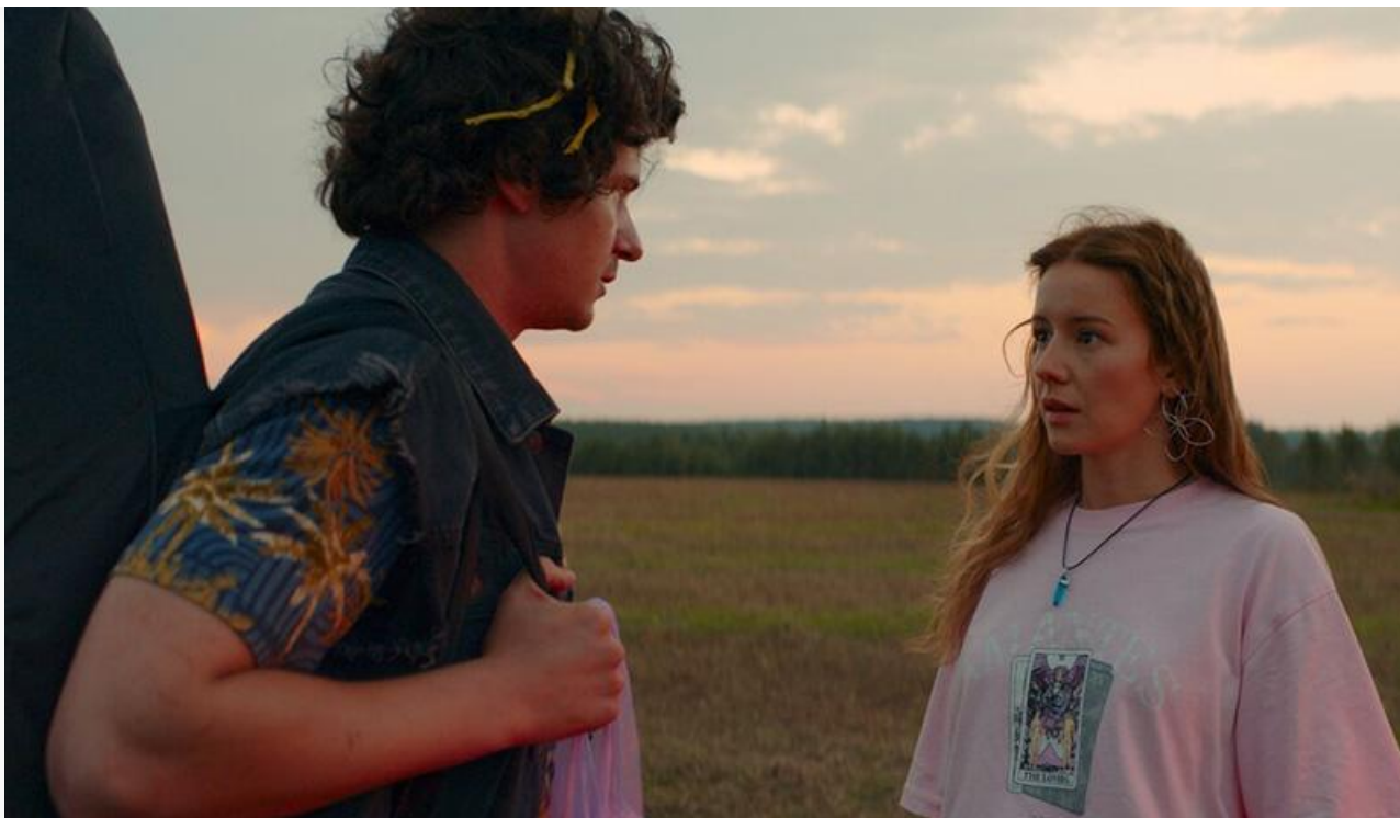
Кадр из фильма «Туда»

Покинули топ-10 «Олень», «Финал», «Багровая отмель» и «Сущность. Семейный кошмар».