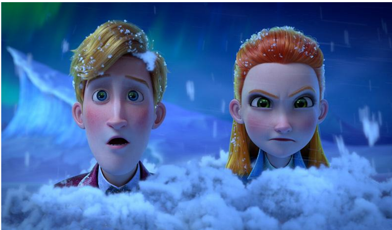
Кадр из фильма «Ганзель и Гретель: Миссия „Спящая красавица“»