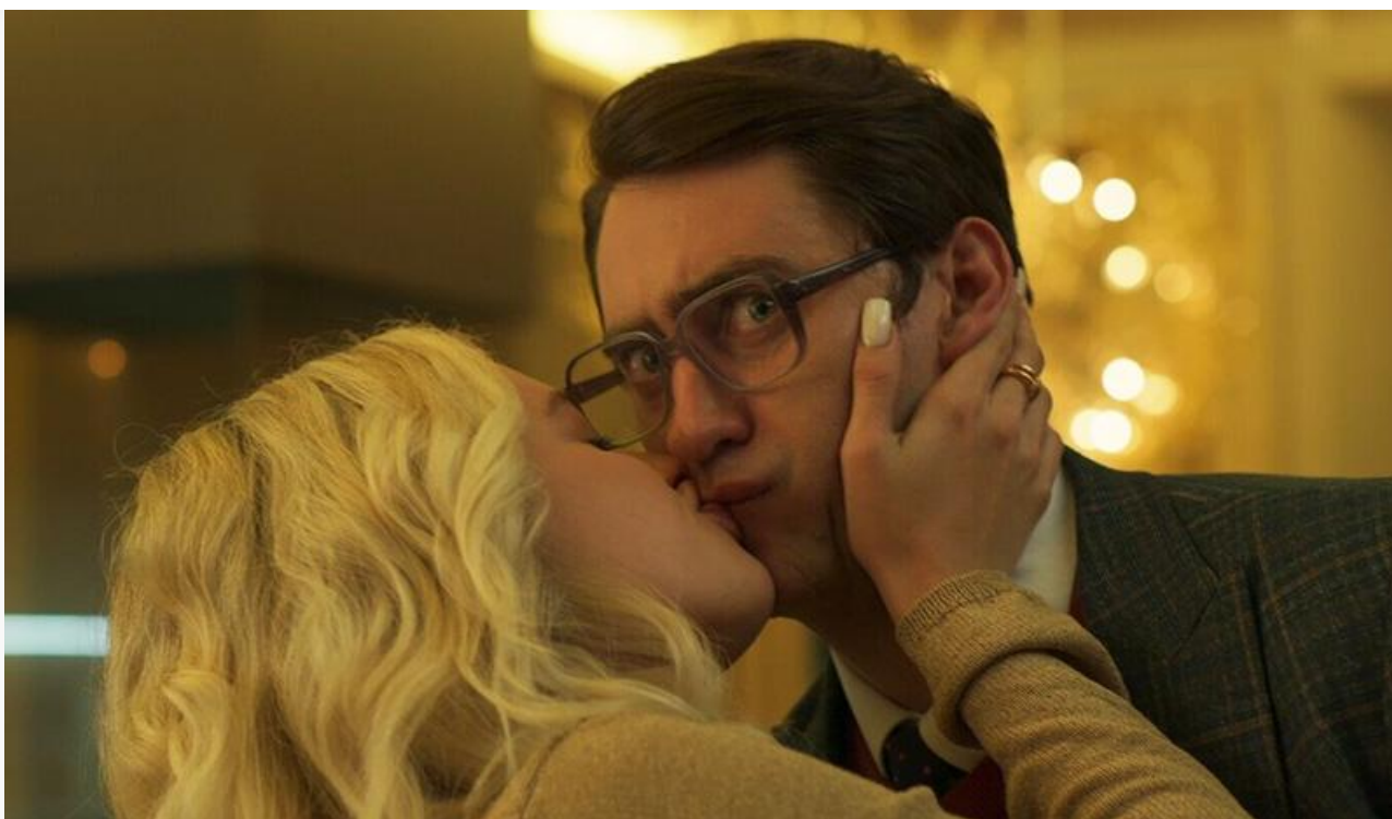
Кадр из фильма «Пара на пару»

Лучшую посещаемость среди топовых релизов продолжает демонстрировать «Кракен» , перешагнувший наконец миллиардный рубеж по общим сборам. В минувшие выходные фантастический боевик Николая Лебедева пополнил копилку на 43,9 миллиона, привлекая в кинозалы в среднем 13 зрителей за сеанс, и занял второе место, ниже которого не опускается уже шесть уикендов.