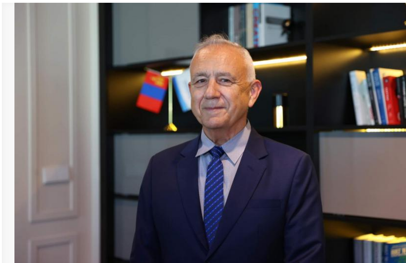
Автор книги «Чингисхан и рождение современного мира» Джек Уэзерфорд

Рах Mongolica стимулировал обмен технологиями, товарами и идеями между Востоком и Западом, а Европа, которая изначально приняла наименьший удар от монгольских завоеваний, получила максимальную выгоду. Компас, порох, печать , заимствованные у монголов, способствовали европейскому Возрождению и стали основой для дальнейшего технологического и социального развития.