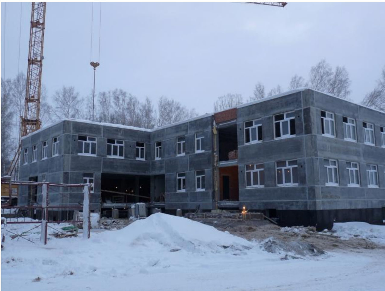
Детский сад в Мельниково

Кроме того, ЗАО «СУ ТДСК» строило хирургический корпус онкодиспансера четыре года вместо оговоренных двух с половиной лет.