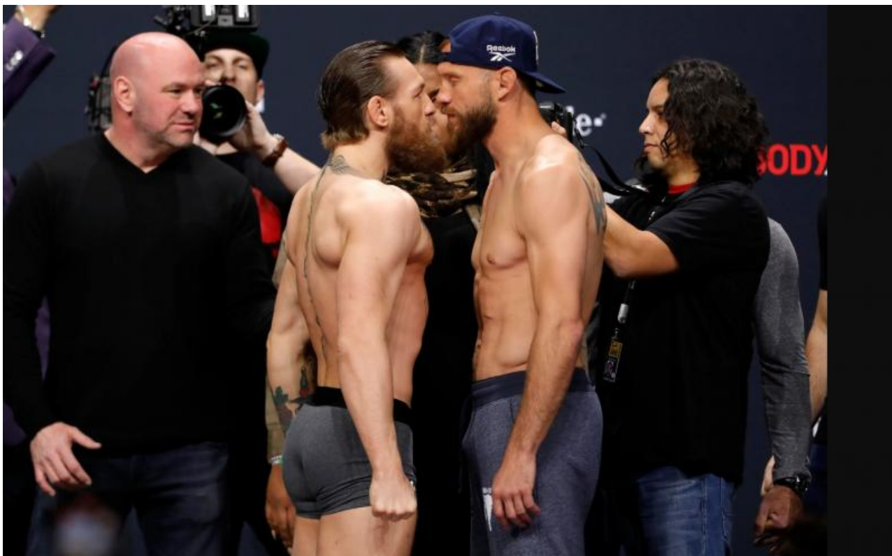
Фото: forbes.com , rpn.gov.ru , mcx.gov.ru , meme-arsenal.com

Автор: Георгий Булычев © Babr24.com ЭКОНОМИКА И БИЗНЕС, ПОЛИТИКА, ИРКУТСК 👁 810 23.04.2025, 23:51 📌 6