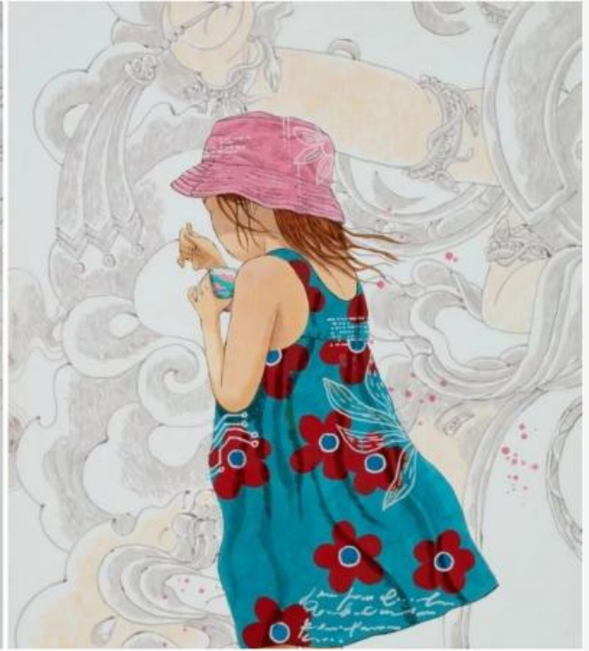
«Небесный пломбир. Шоколад» и «Небесный пломбир. Малина» (2024)