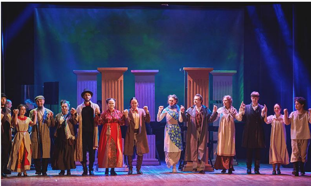
Сцена из спектакля «Гроза»

Да и в целом спектакль продолжительностью два часа без антракта нисколько не утомляет, а значит, захватывает и держит в интересе и сопереживании, оставляя послевкусие не зря потраченных денег на билет. Которые, впрочем, и без того, что называется, дешевле некуда.