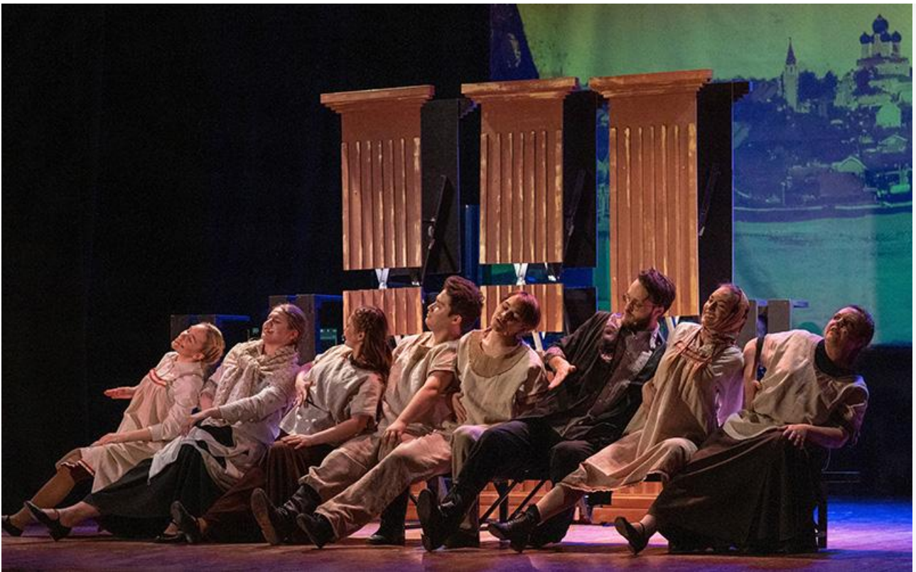
Сцена из спектакля «Гроза»

Впрочем, модный нынче жанр sound-драмы оставляет за собой право вообще обойтись без вокальных номеров. Так что неудивительно, что без своего «музыкального лица» оставлены все представители «тёмного царства»: Дикой, Кабаниха, Тихон и почему-то примкнувшая к ним Варвара. Неожиданный авторский ход, оставивший безголосыми отрицательных персонажей, принёс в жертву потенциально интересные музыкальные характеристики героев, но зато упростил кастинг.