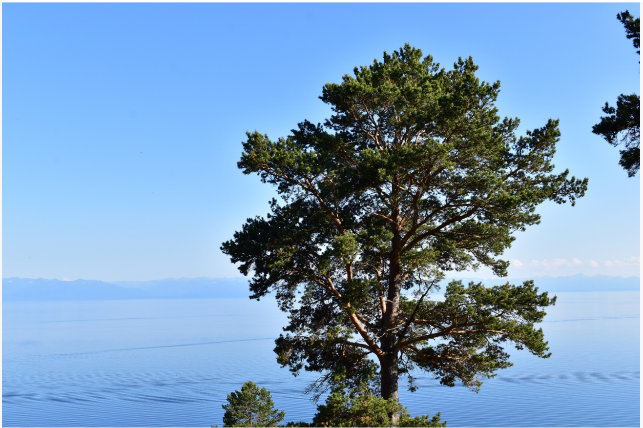
Автор: Екатерина Долинская Фото из альбома "Байкал. Виды - лето" © Фотобанк "RuBabr"