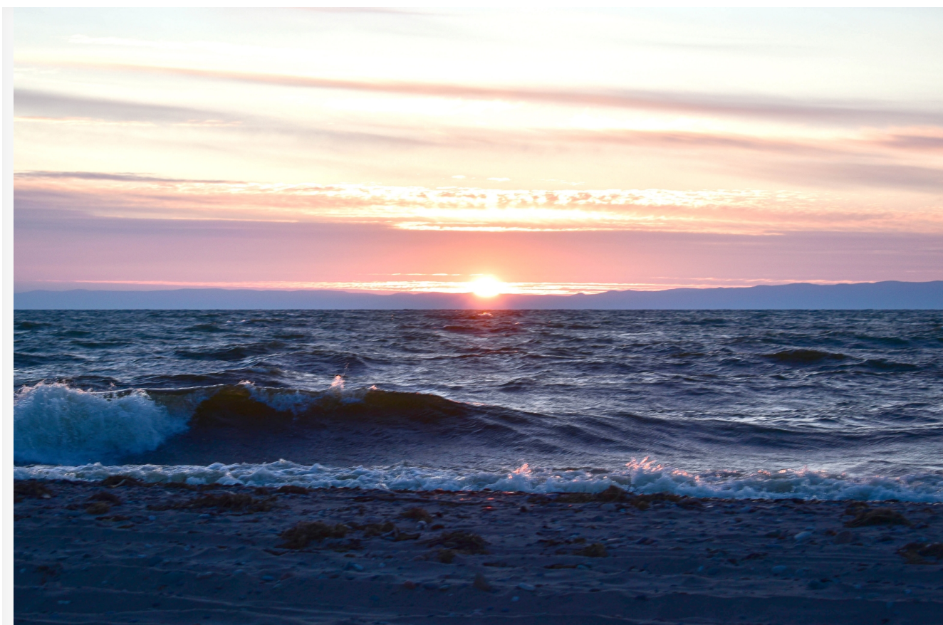
Автор: Екатерина Долинская Фото из альбома "Байкал. Виды - лето" © Фотобанк "RuBabr"

В последние годы вокруг защиты Байкала разворачивается настоящая драма, где переплетаются наука, политика и большие деньги. Проекты, призванные спасти уникальный водоем, вызывают больше вопросов, чем дают ответов, а действия властей напоминают борьбу с ветряными мельницами.