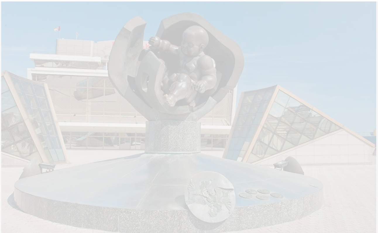
Композиция «Золотое дитя». Установлена в 1995 году возле Морского вокзала в Одессе в честь 200-летия города. Высота 5 метров

Невидимое гораздо важнее видимого. Никогда не надо подчиняться логике карьеры.