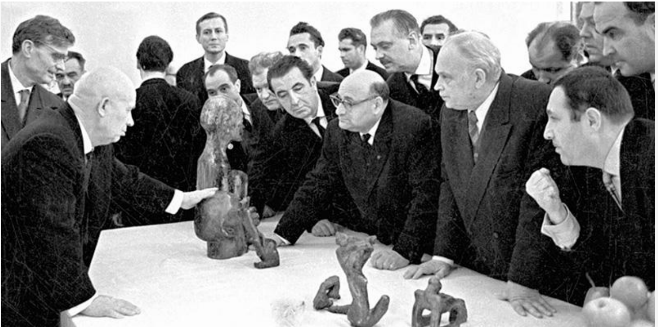
Никита Хрущов (слева) и Эрнст Неизвестный (крайний справа) на выставке художников-авангардистов студии «Новая реальность» в Манеже 1 декабря 1962 года

Скончался Эрнст Неизвестный 9 августа 2016 года в нью-йоркской больнице «Стони Брук» в возрасте 91 года. Похоронен на острове Шелтер-Айленд, где провёл в собственной мастерской последние годы жизни. Его желанием пожеланием перед смертью было отсутствие на могиле каких бы то ни было скульптур.