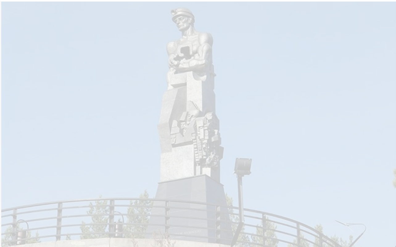
Монумент «Память шахтёрам Кузбасса». Установлен в 2003 году на территории музейного комплекса «Красная горка» в Кемерово. Высота 12 метров