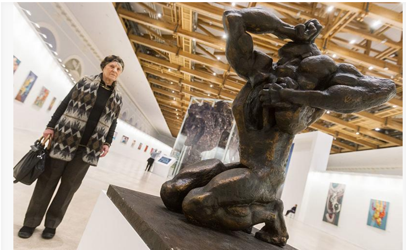
Скульптура «Орфей». Создана в 1962 году,

В день 100-летия остроумного гения мы вспоминаем его скульптурные творения, а также ироничные высказывания в адрес себя и окружающего мира.