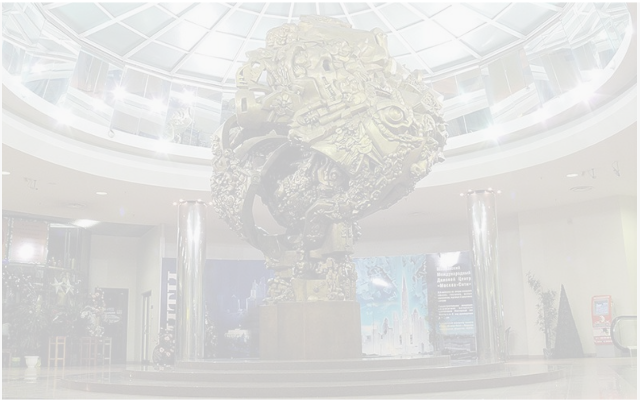
Скульптурная композиция «Древо жизни». Установлена в 2004 году в торгово-пешеходном переходе «Багратион» в Москве. Высота 7 метров

Вертикаль – это бог, горизонталь – это жизнь, в точке пересечения – я, Микеланджело, Шекспир и Кафка.