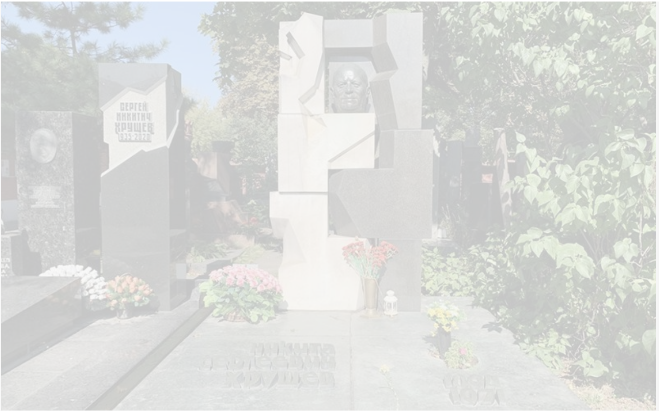
Памятник Никите Хрущеву. Установлен на Новодевичьем кладбище Москвы в 1975 году по просьбе семьи генсека, который в своё время назвал творения Неизвестного «дегенеративным искусством». Высота 2,5 метра

Нужно смотреть на жизнь так, чтобы от этого взгляда не протухла простокваша.