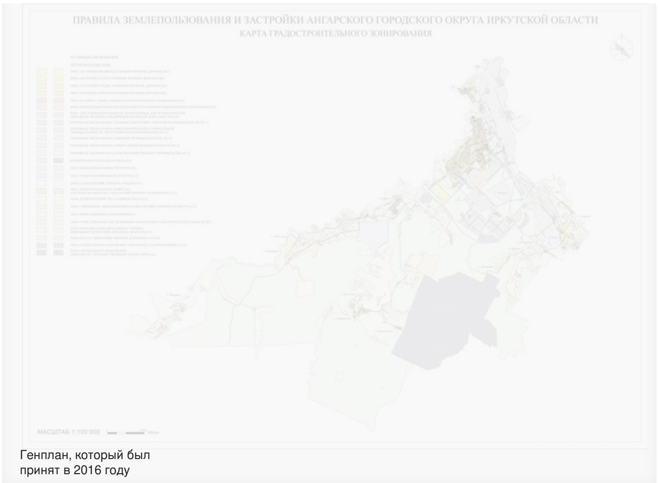
Генплан, который был принят в 2016 году