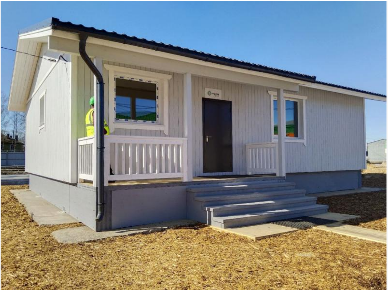
Ну а что. Не дом - мечта! Это первый CLT-prefab-дом на Вологодчине

Правда, CLT-панели делаются из низкокачественной древесины, что позволяет производителям экономить на сырье. Склеивается оно клеями с использованием формальдегида. Да, есть клеи без этого токсичного компонента, но они относятся уже к элитному сегменту. Кто будет использовать их в массовом процессе? Кроме того, этот стройматериал требует утепления (которое тоже в массовом сегменте далеко от экологичности). Также вопросы к качеству соединения отдельных «запчастей» каркасника – в этом аспекте тоже его слабое место (особенно, опять же, при строительстве в больших объемах). Не будет ли, попросту говоря, дуть из щелей?