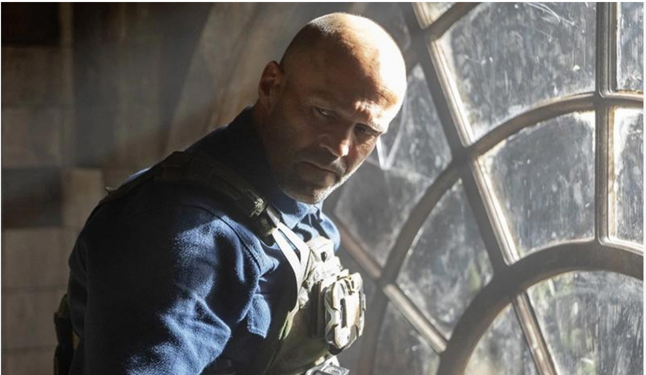
Джейсон Стэйтем в фильме «Мастер»

Это лучший старт среди зарубежных релизов в российском прокате в 2025 году. Слабее « Мастера » начинали прокат и «Холоп. Великолепный век» (101,6 миллиона), и «Оставь это ветру» (84,5 миллиона), и «Обезьяна» (74,4 миллиона), и «Плохая девочка» (70 миллионов).