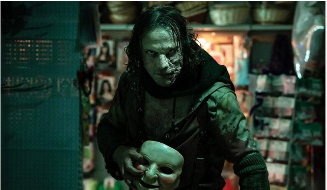
Кадр из фильма «Питер Пэн. Кошмар в Нетландии»

Что касается лидера проката, то сиквел «Пальмы» от Владимира Кондаурова потерял в сборах по сравнению с предыдущим уикендом всего 9 % и пополнил копилку на 134,7 миллиона. Ещё меньше – 2 % – составили потери фантастической комедии Дмитрия Суворова «Ждун» , однако 93,4 миллиона для конкурентной борьбы с «Мастером» не хватило. В итоге – третье место.