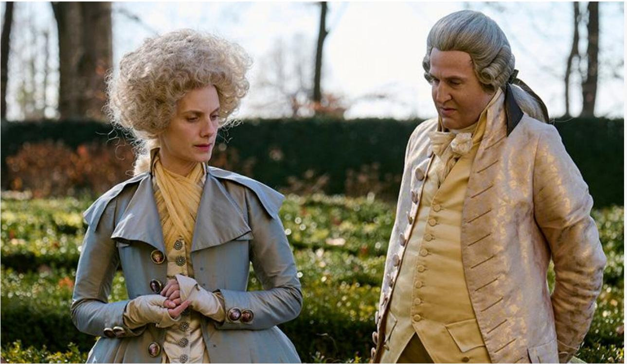
Кадр из фильма «Падение короны»