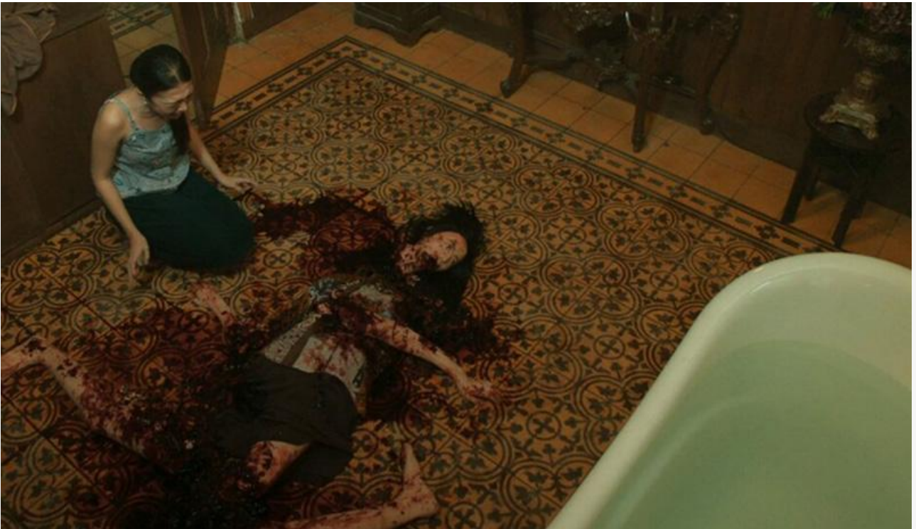
Кадр из фильма «Пункт назначения: Комната 666»

На девятой строчке чарта обосновался индонезийский «Пункт назначения: Комната 666» (14,5 миллиона на 676 экранах), а замкнула группу лидеров сказочная адаптация Скотта Чемберса «Питер Пэн. Кошмар в Нетландии» (12,4 миллиона на 871 экране).