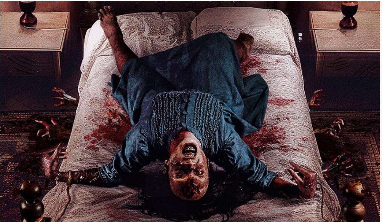
Постер к фильму «Проклятие матери. Одержимая»