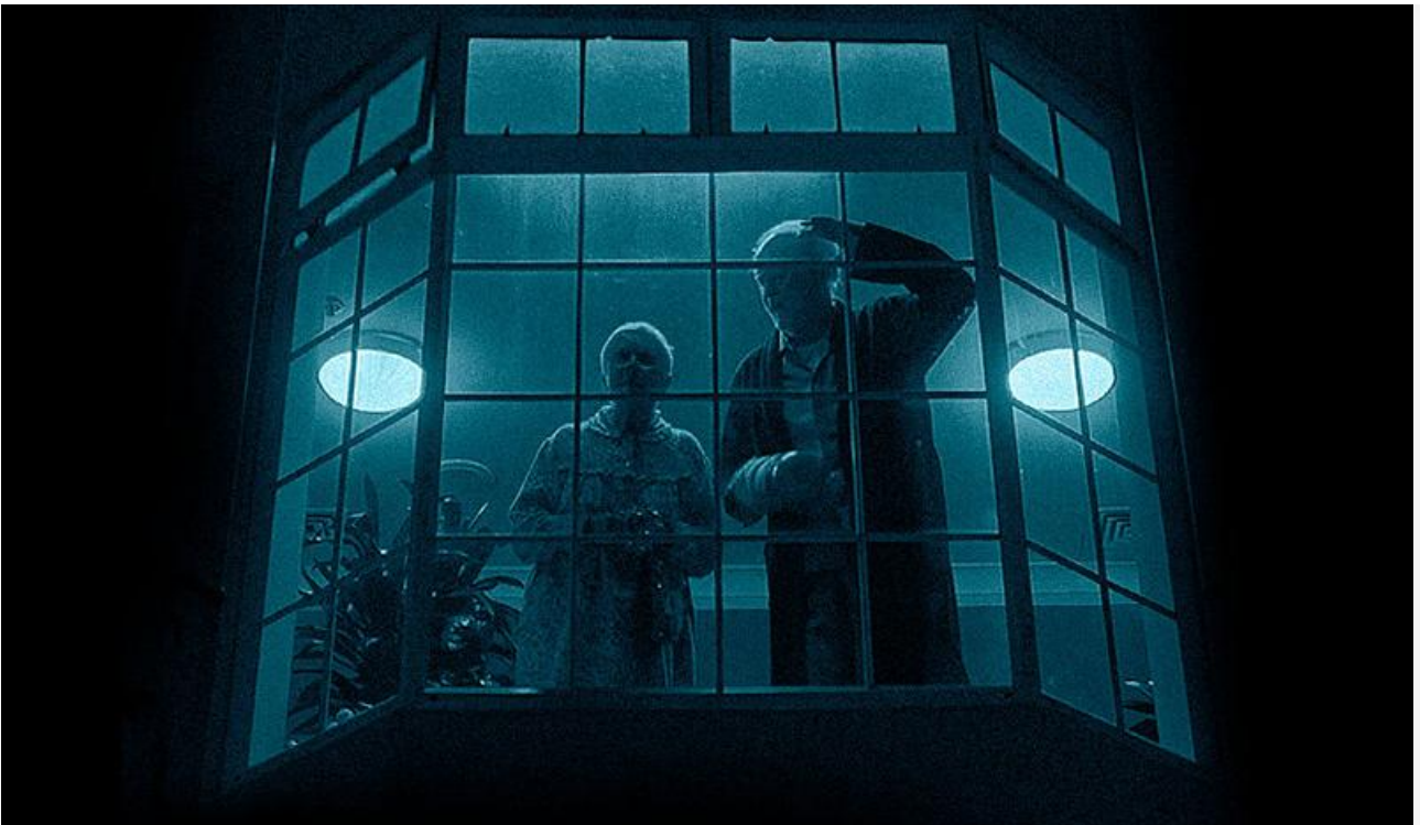
Постер к фильму «Обитель смерти»