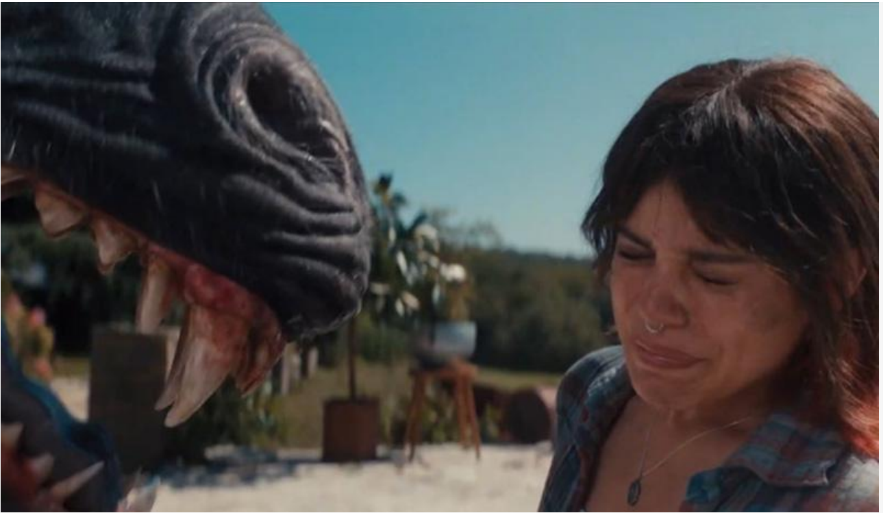
Кадр из фильма «Смерть единорога»