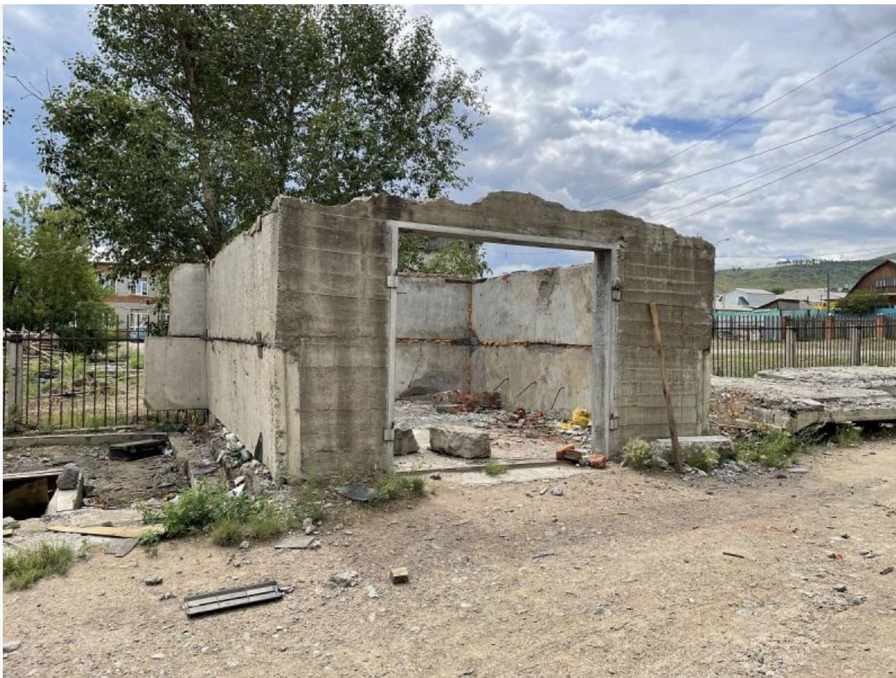
Такие развалины в пригородах Улан-Удэ предпочитают дети для игр

В результате ребята предпочитают играть где угодно — на гаражах или заброшенных участках — но только не на таких площадках. В Иркутске уже давно используют резиновые покрытия, которые безопаснее, долговечнее и удобнее в эксплуатации, а также устанавливают современные игровые элементы, отвечающие требованиям времени.