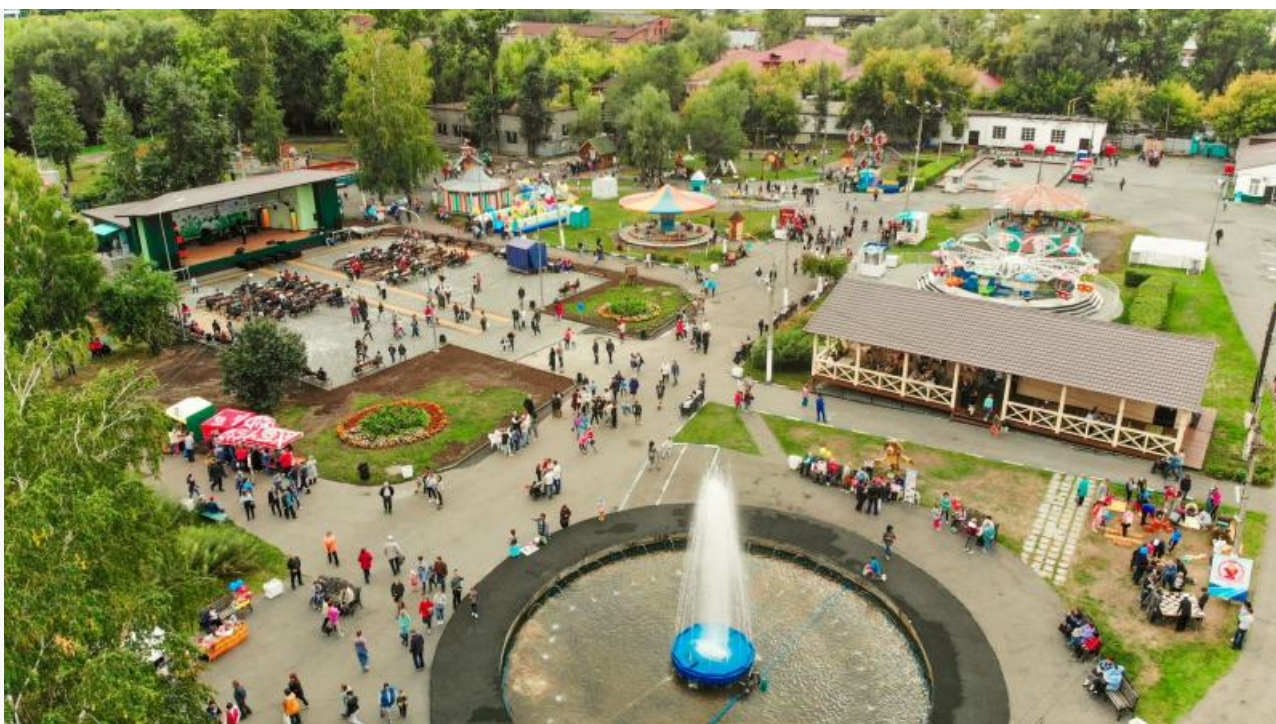
Центральный парк Барнаула

Сравнение с другими сибирскими городами подчёркивает отставание Улан-Удэ. Иркутский Комсомольский парк , созданный бюро MAD Architects, использует идею взлётно-посадочной полосы, включает крупномеры, малые архитектурные формы (МАФы) и точки притяжения ( проект ). Центральный парк Барнаула после реновации от лучших архитектурных бюро Алтая предлагает спортивные площадки, амфитеатры и ухоженные зоны ( проект ). Улан-Удэ же довольствуется качелями и песком.