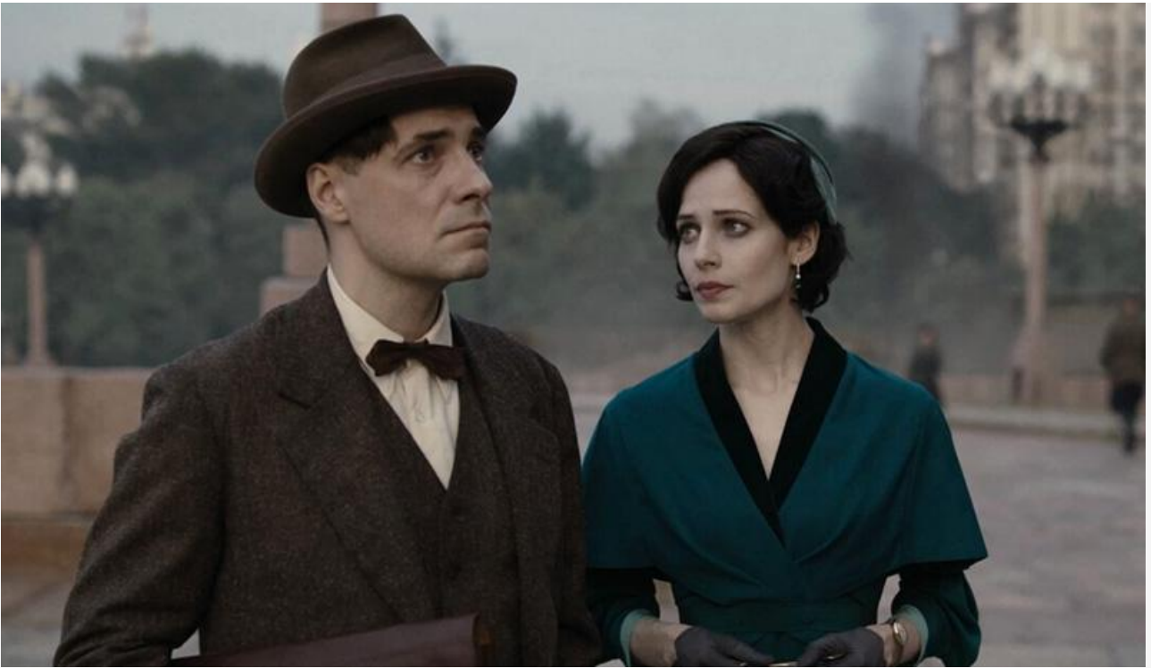
Евгений Цыганов и Юлия Снегирь в фильме «Мастер и Маргарита»