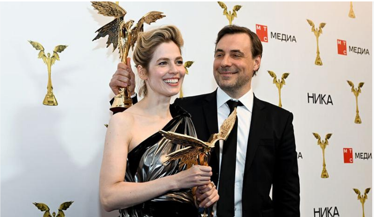
Мастер и Маргарита с премиями «Ника»