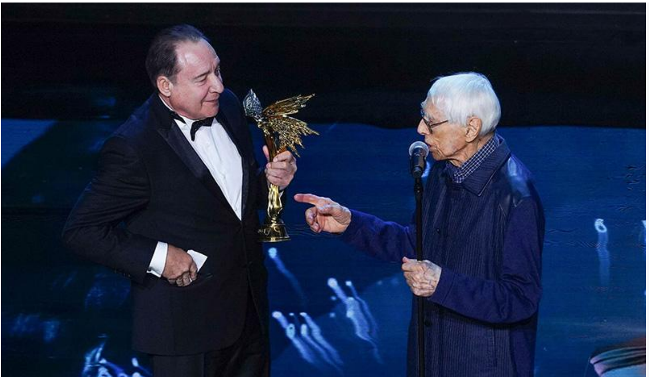
Максим Дунаевский вручает «Нику» Александр Зацепину

Если же в целом посмотреть на список номинантов и лауреатов, то при всех вводных более про кино и искусство всё же «Ника», а не правильно-позиционный и откровенно предвзятый «Золотой орёл». Впрочем, так было всегда.