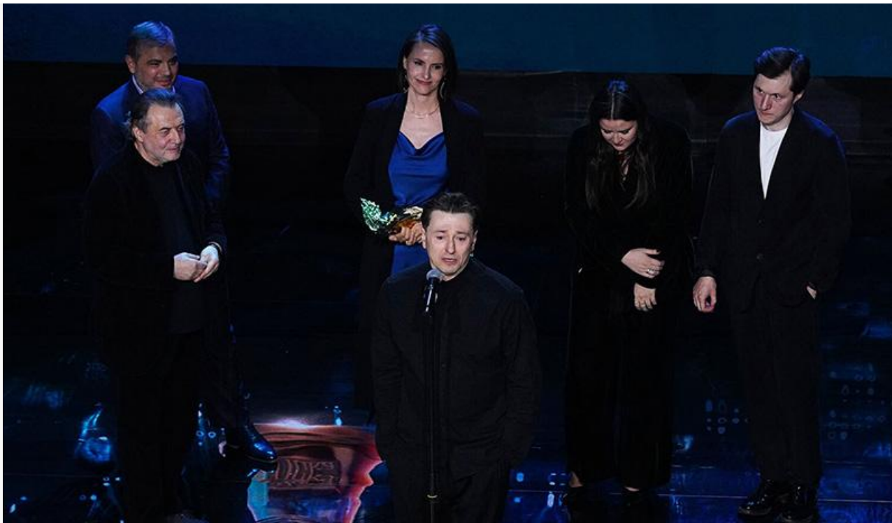
Команда сериала «Плевако» на церемонии «Ника»