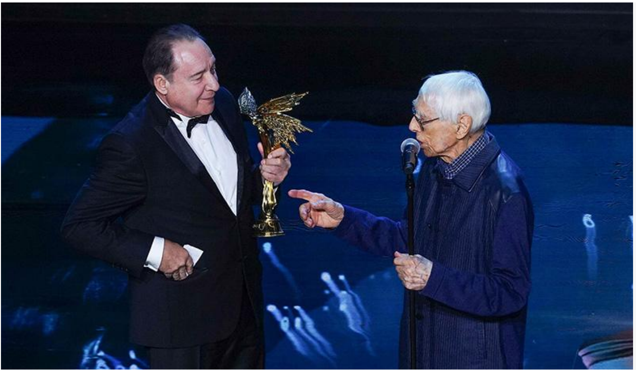
Максим Дунаевский вручает «Нику» Александр Зацепину

Если же в целом посмотреть на список номинантов и лауреатов, то при всех вводных более про кино и искусство всё же «Ника», а не правильно-позиционный и откровенно предвзятый «Золотой орёл». Впрочем, так было всегда.