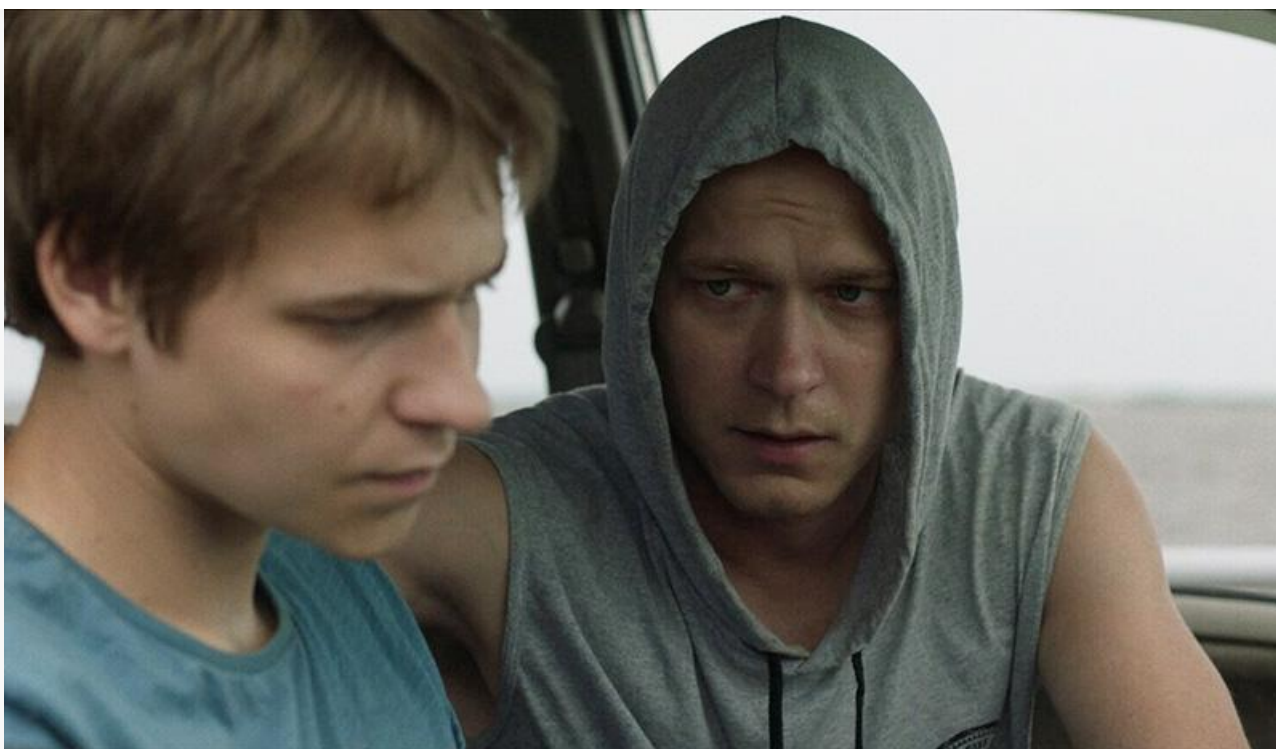
Юра Борисов в фильме «Кончится лето»

Борисов, к слову, спасибо «Аноре», объездил нынче все церемонии, включая «Оскара», за исключением... «Золотого орла». По понятным причинам не было среди номинантов на «Золотого орла» и Евгения Цыганова , сыгравшего Мастера в фильме Локшина. Поэтому академики «Ники» выстрелили дуплетом, наградив обоих премией в категории «Лучшая мужская роль», оставив при этом без награды лауреата «Золотого орла» Сергея Безрукова из «Воздуха».