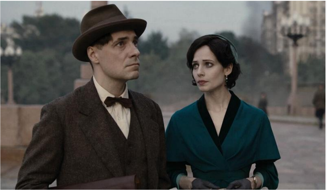
Евгений Цыганов и Юлия Снигирь в фильме «Мастер и Маргарита»