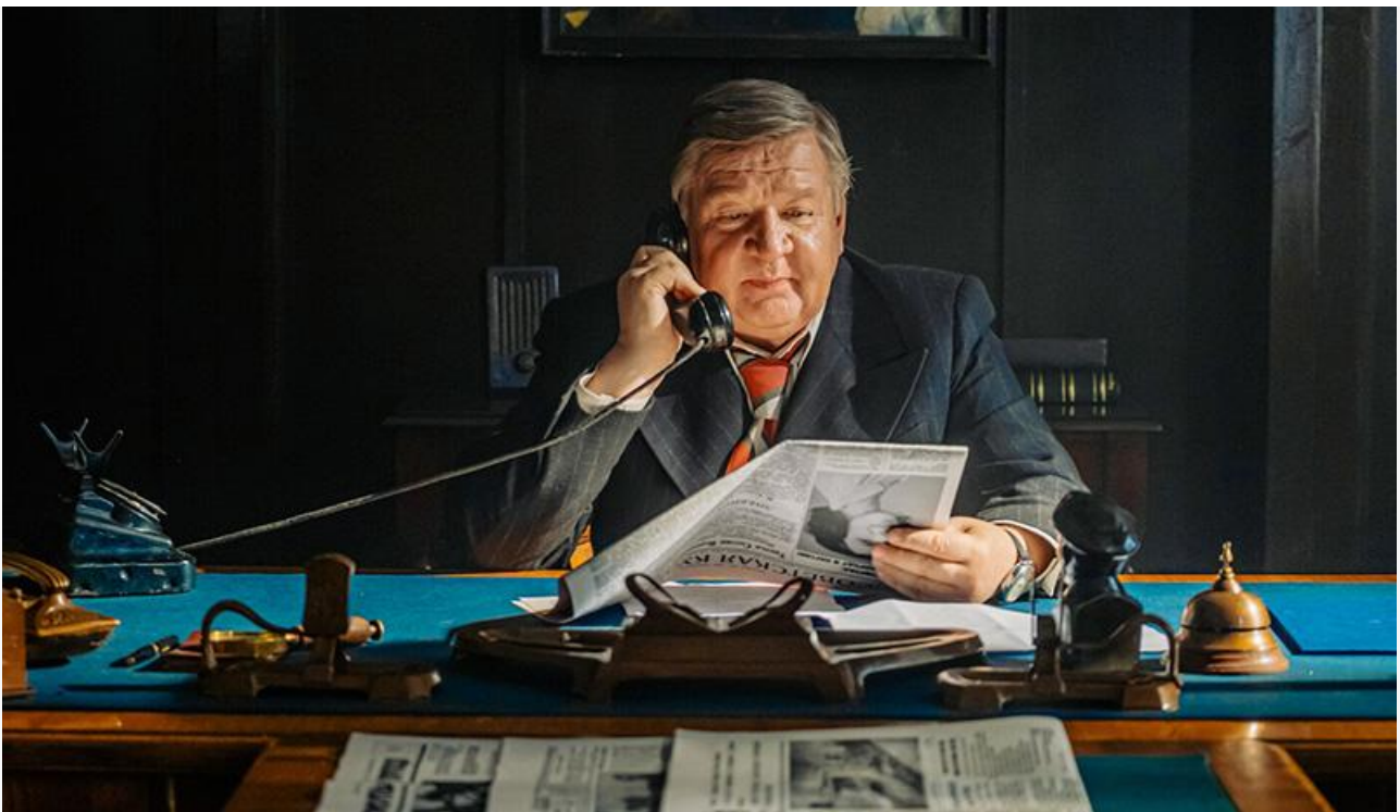
Роман Мадянов в фильме «Любовь Советского Союза». Премия «Ника» в

Ну а главным триумфатором «Ники» стала полностью проигнорированная «Золотым орлом» экранизация романа Михаила Булгакова, получившая семь статуэток и звание лучшего фильма года. Шах и мат.