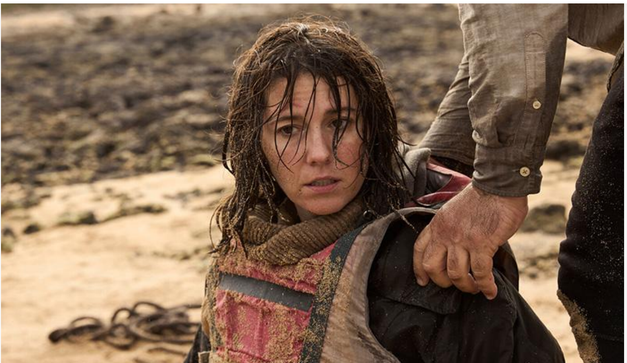
Мэри Элизабет Уинстэд в фильме «Крушение

Историческая драма Тима Милантса с Киллианом Мерфи и Эмили Уотсон «Мелочи жизни» , номинированная в минувшем году на «Золотого медведя» Берлинского кинофестиваля, с шикарной наработкой 62 тысячи с экрана всего на 306 экранах собрала 19 миллионов. Для сравнения: отечественный мелодраматический альманах Владимира Котта «Мужчина и женщина» на 498 экранах наскрѐб всего 2,3 миллиона с наработкой 4,7 тысячи с экрана и занял 18-е место.