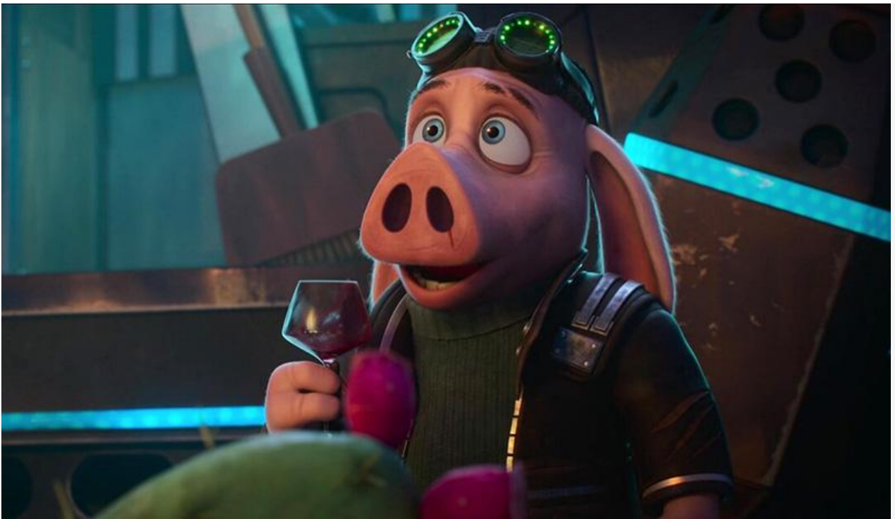
Кадр из фильма «Зверопоиск»

Ещё две новинки уикенда зарезервировали за собой шестую и седьмую строки чарта.