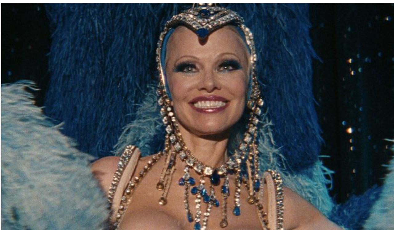
Памела Андерсон в фильме «Шоугёрл»