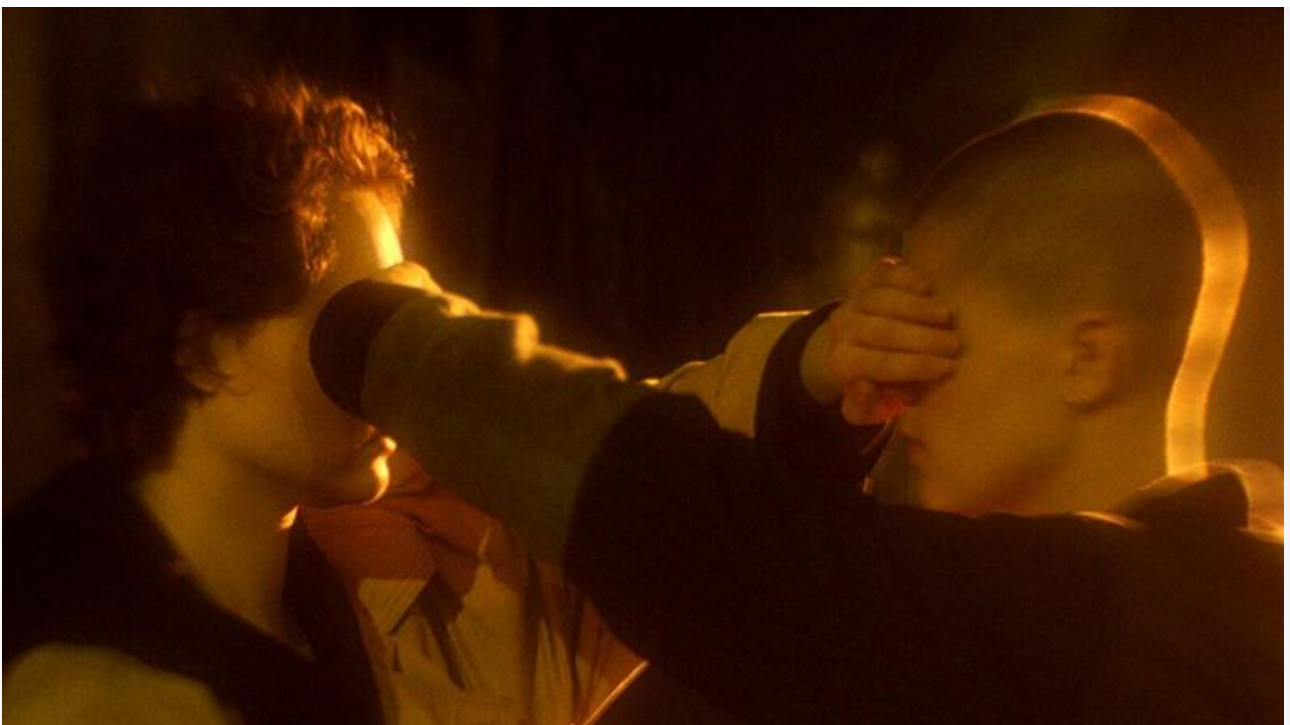
Кадр из фильма «Жар-птица»

В формате повторного перевыпуска зрители смогут вновь посмотреть на большом экране аниме Хаяо Миядзаки 1986 года «Небесный замок Лапута» .