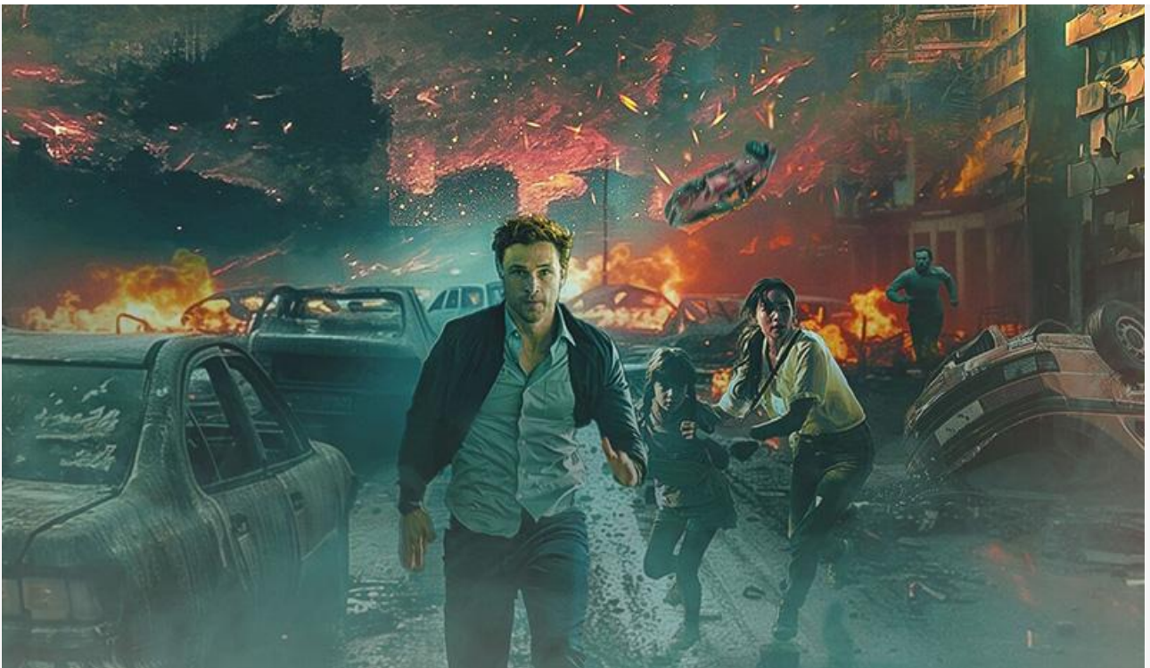
Постер к фильму «Последний охотник на демонов»