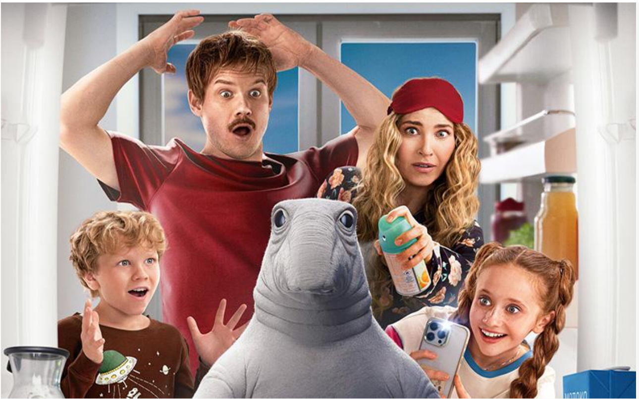
Постер к фильму «Ждун»