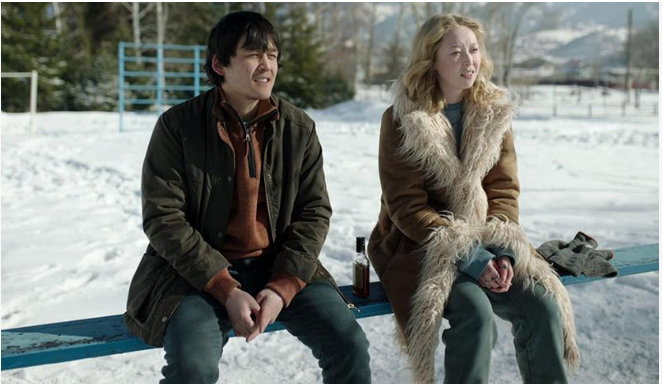
Кадр из фильма «Папа умер в субботу»