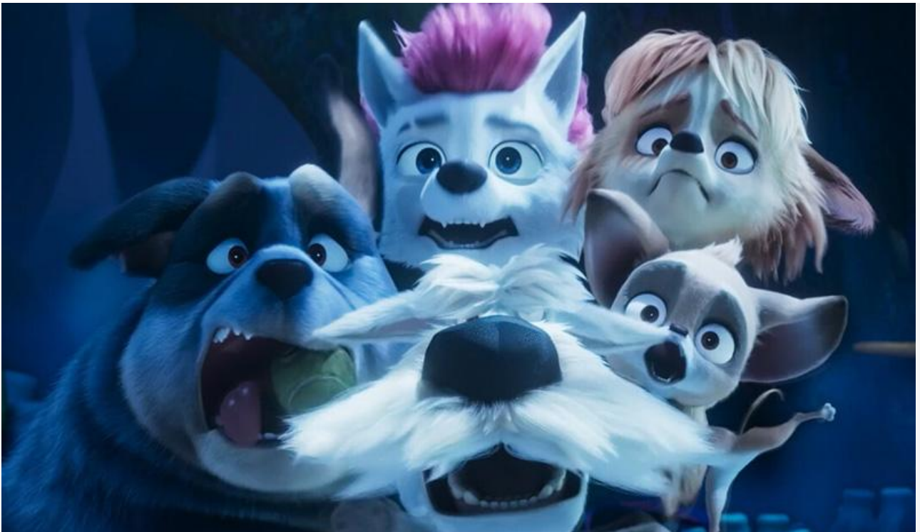
Кадр из фильма «200% Волк»

Видео дня. Памела Андерсон в «Шоугёрл» внучки Копполы