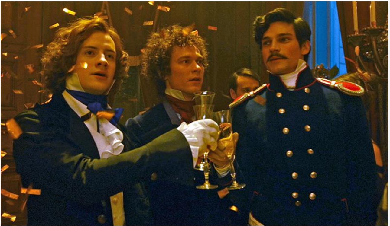
Кадр из фильма «Пророк. История Александра Пушкина»

Сохранил своё место и бронзовый призёр предыдущих выходных. На счету ретро-детективного боевика Андрея Волгина «Красный шёлк» – 57,1 миллиона на 787 экранах с потерей в сборах 37 % и 582,6 миллиона в общей кассе.