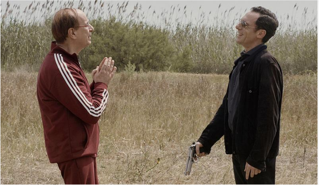
Кадр из фильма «Босс»