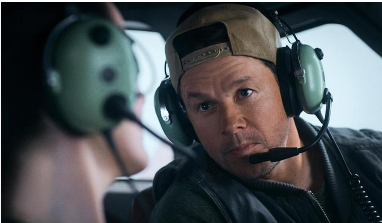
Марк Уолберг в фильме «Особо опасный пассажир»

Поклонники фильмов ужасов смогут потешить себя просмотром американского хоррора Саши Сибли «Астрал. Спуск к дьяволу» (18+).