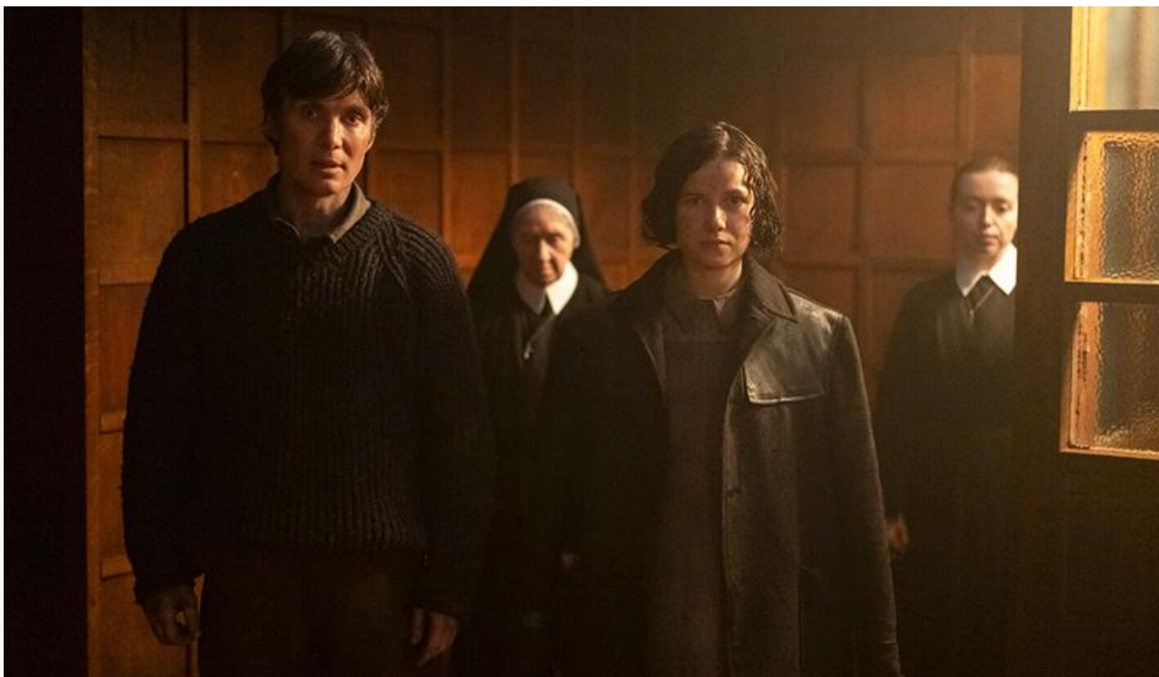
Кадр из фильма «Мелочи жизни»

Замкнули десятку лидеров старожилы проката: «Обезьяна» (17,9 миллиона с потерей в сборах 49 % и восьмое место), «Северный полюс» (17,2 миллиона с потерей в сборах 51 % и девятое место) и «В потерянных землях» (16,7 миллиона с потерей в сборах 62 % и десятое место).