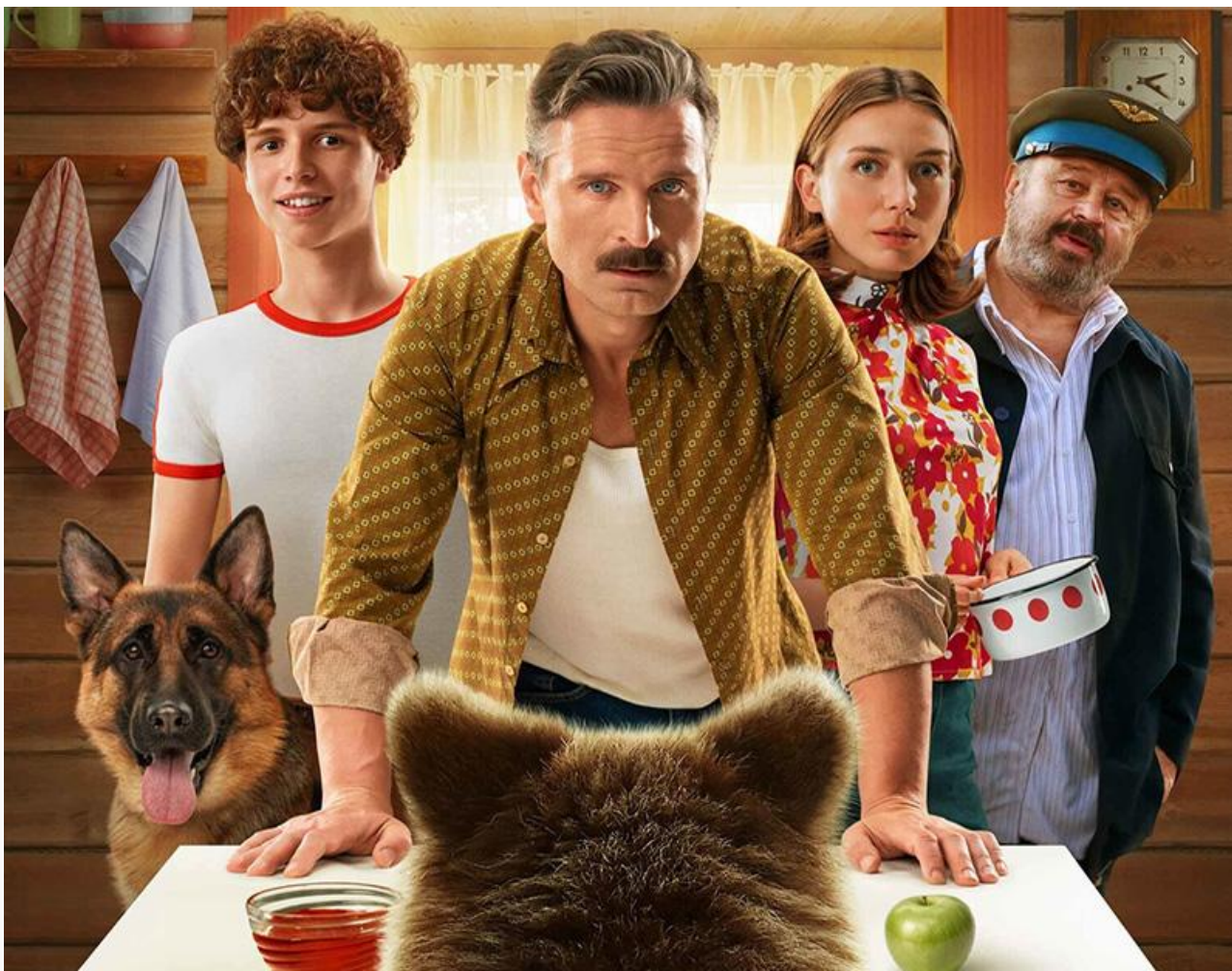
Постер к фильму «Пальма 2»