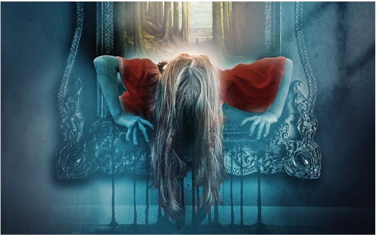
Постер к фильму «Астрал. Спуск к дьяволу»