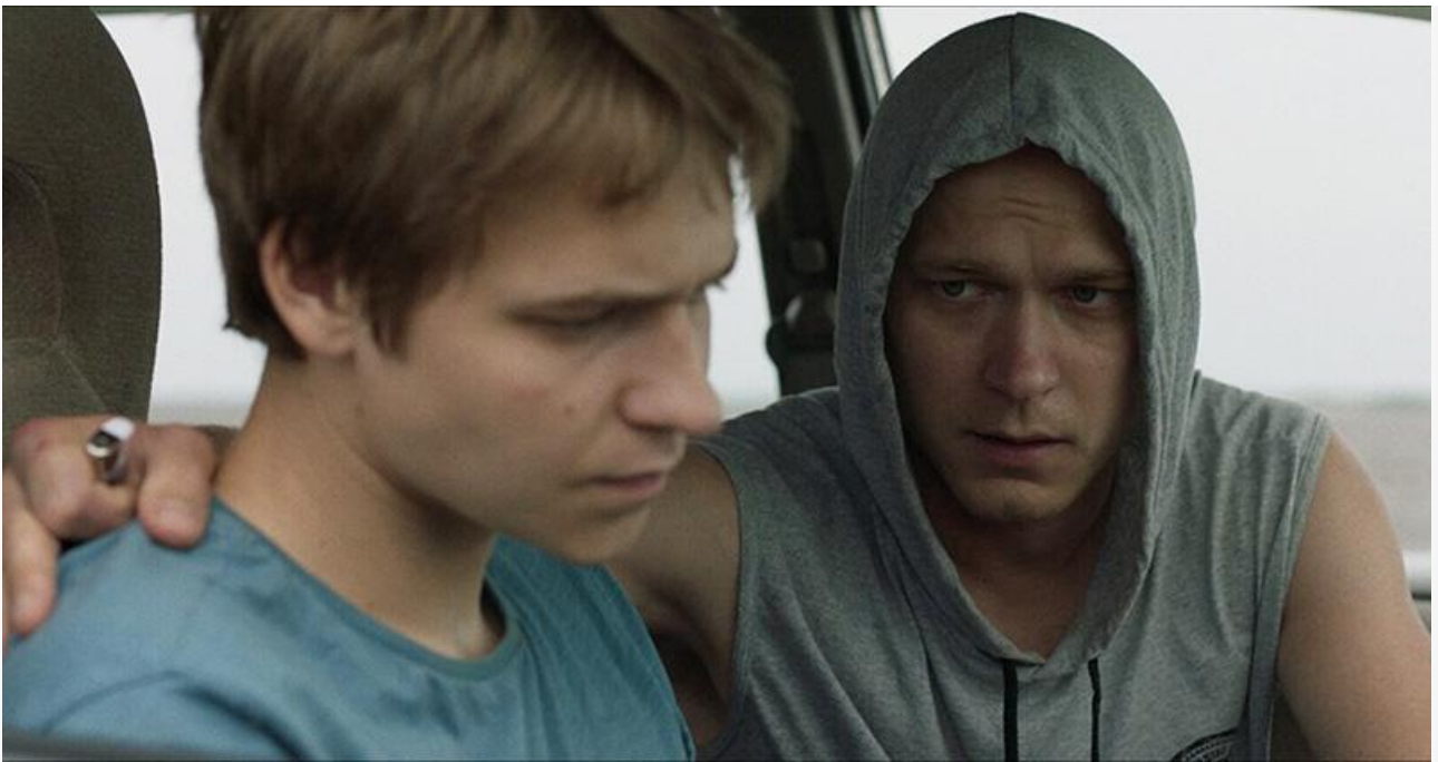
Кадр из фильма «Кончится лето»

Общая касса топ-20 фильмов уикенда составила 619,3 миллиона рублей. Это на 23,24 % меньше по сравнению с предыдущими выходными .