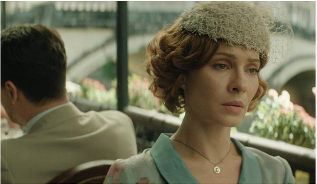
Кадр из фильма «Красный шёлк»

Лучшей новинкой уикенда, собрав на 1 240 экранах 74,4 миллиона с наработкой 60 тысяч рублей с экрана, стал хоррор Осгуда Перкинса «Обезьяна» . Экранизация одноимённого рассказа Стивена Кинга встретила утро первого понедельника в прокате на третьей строке чарта.