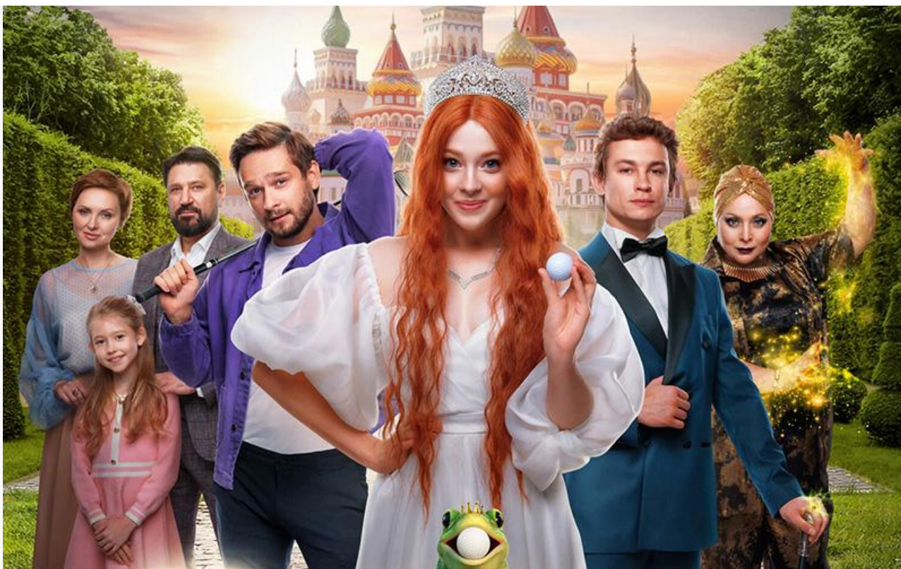
Постер к фильму «Царевна-лягушка»

Рановато сбрасывать со счетов и «Пророка» с «Красным шёлком».