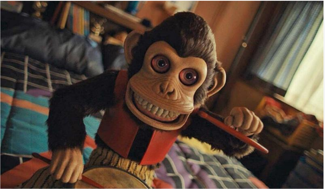
Кадр из фильма «Обезьяна»