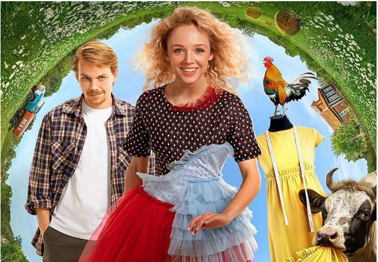
Постер к фильму «Один хороший день»