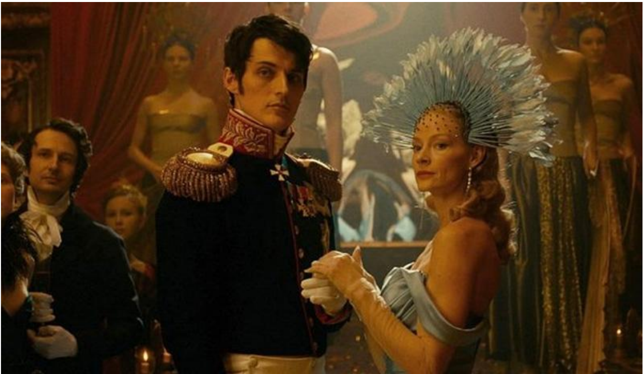
Кадр из фильма «Пророк. История Александра Пушкина»

Отметим, что «Пророк» удерживает лидерство третий уикенд подряд. Так долго на первой строке чарта в 2025 году ещё не задерживался ни один фильм.