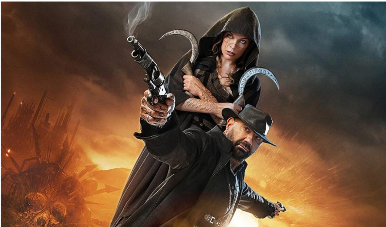
Постер к фильму «В потерянных землях»

Любители фильмов ужасов получат возможность насладиться индонезийским хоррором « Реинкарнация. Предсмертные муки » (18+).