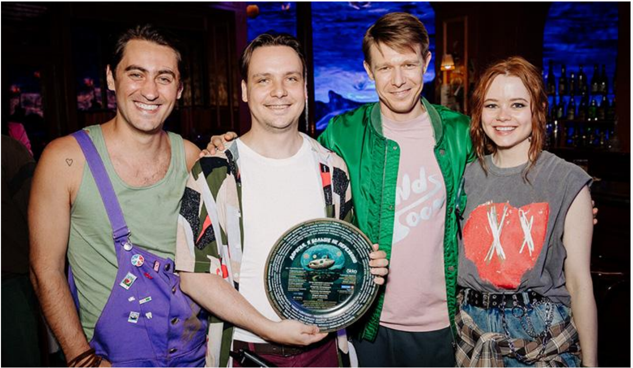
На съёмках фильма «Дорогая, я больше не перезвоню»