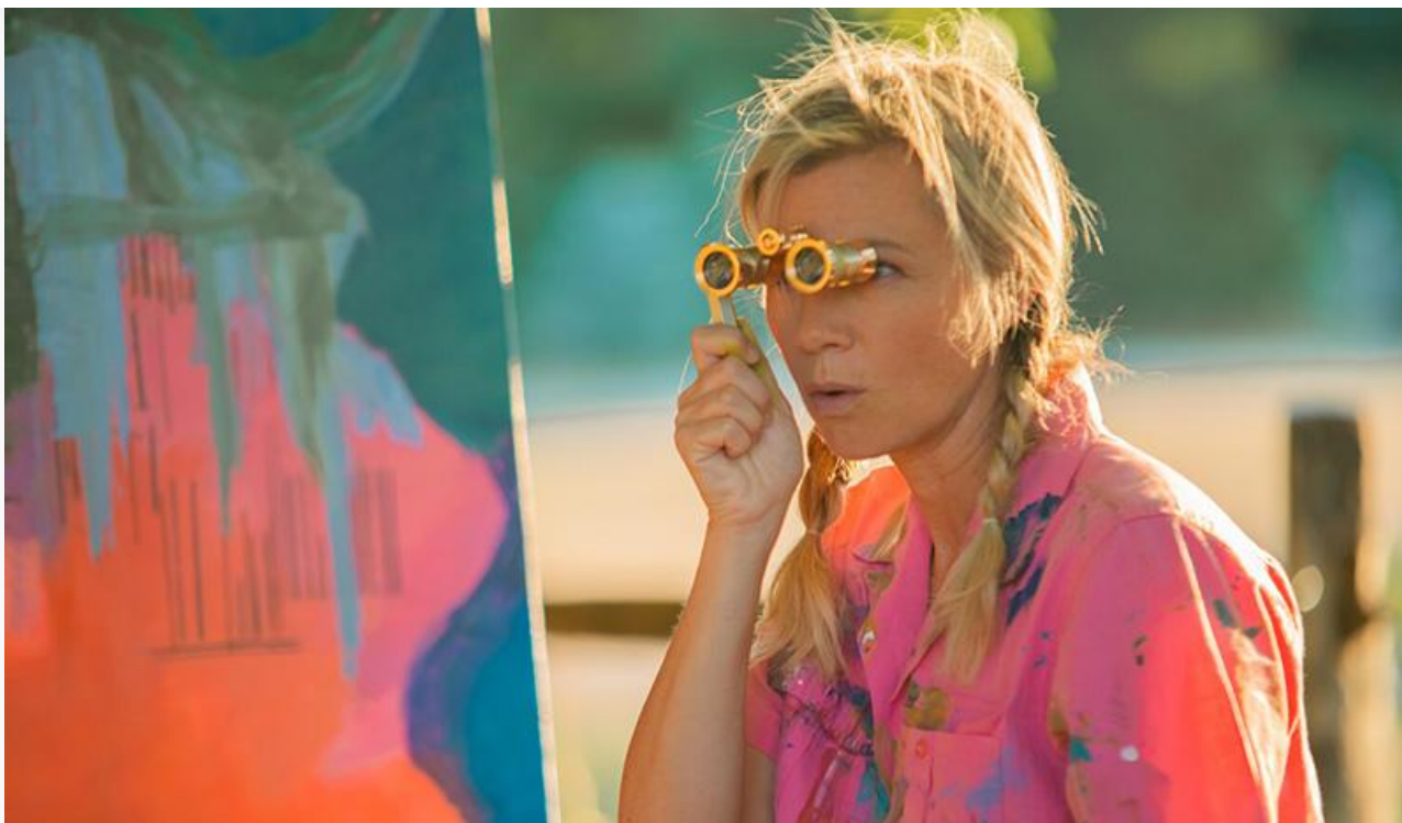
Кадр из фильма «Заложница»

Также выходят в прокат американский детективный триллер Анны Элизабет Джеймс с Эми Сمارт в главной роли « Заложница » (18+), бразильская фэнтезийная мелодрама « Мой парень – принц » и таиландский кассовый хит Пата Буннитипата « Бабушка на миллион ».