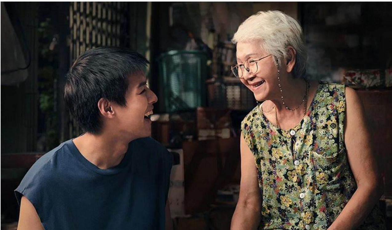
Постер к фильму «Бабушка на миллион»