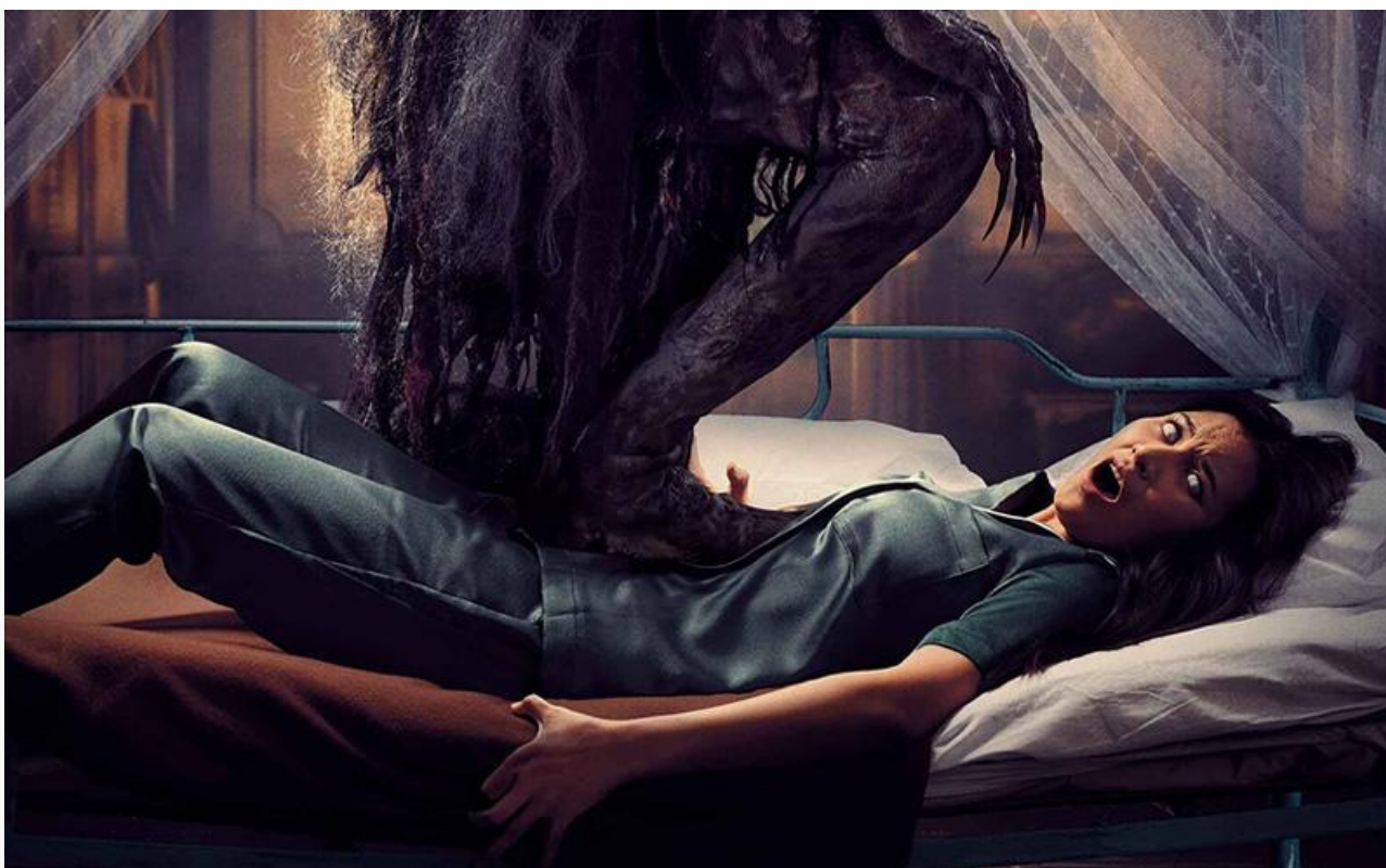
Постер к фильму «Реинкарнация.