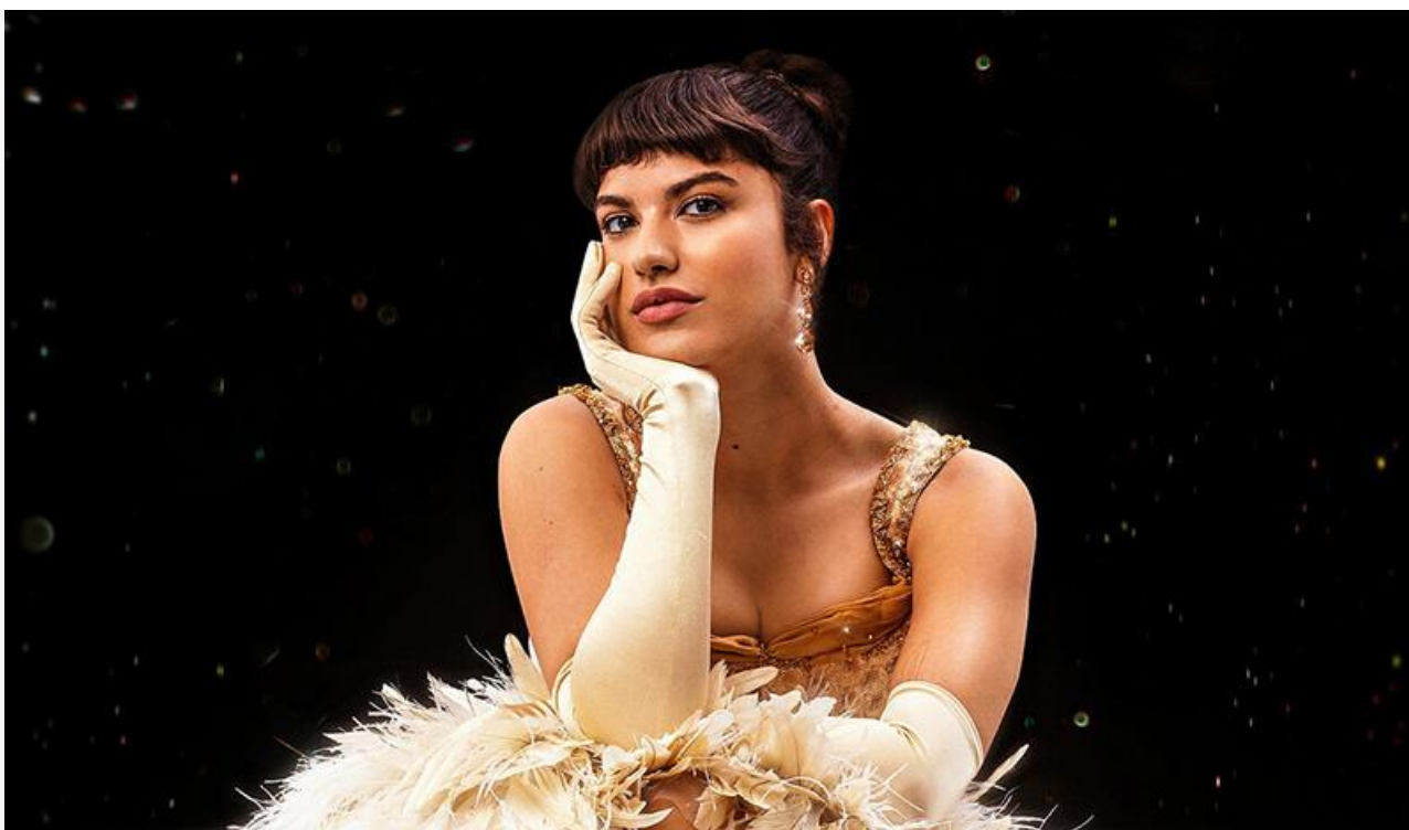
Постер к фильму «Мой парень – принц»