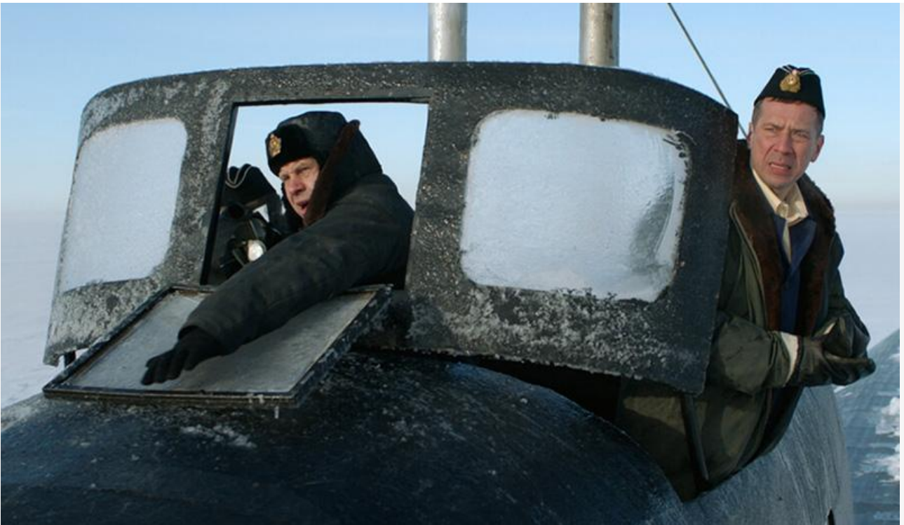
Кадр из фильма «Северный полюс»