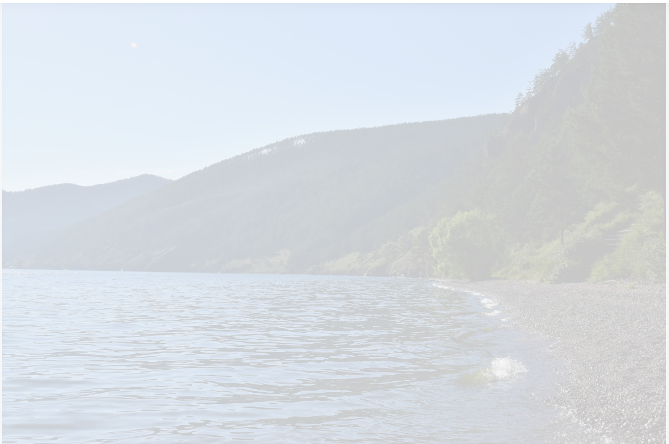
Автор: Екатерина Долинская Фото из альбома "Байкал. Виды - лето" © Фотобанк "RuBabr"

Одно можно сказать точно: совсем закрыть Байкал для туристов невозможно. Но и делать из него всероссийский курорт – тоже не выход. Где-то посередине есть разумный компромисс: ограниченный, но качественный туризм. Например, создание специально оборудованных маршрутов, ограничение количества туристов, обязательное соблюдение экологических норм. Такой подход работает во многих странах, где есть хрупкие природные зоны.