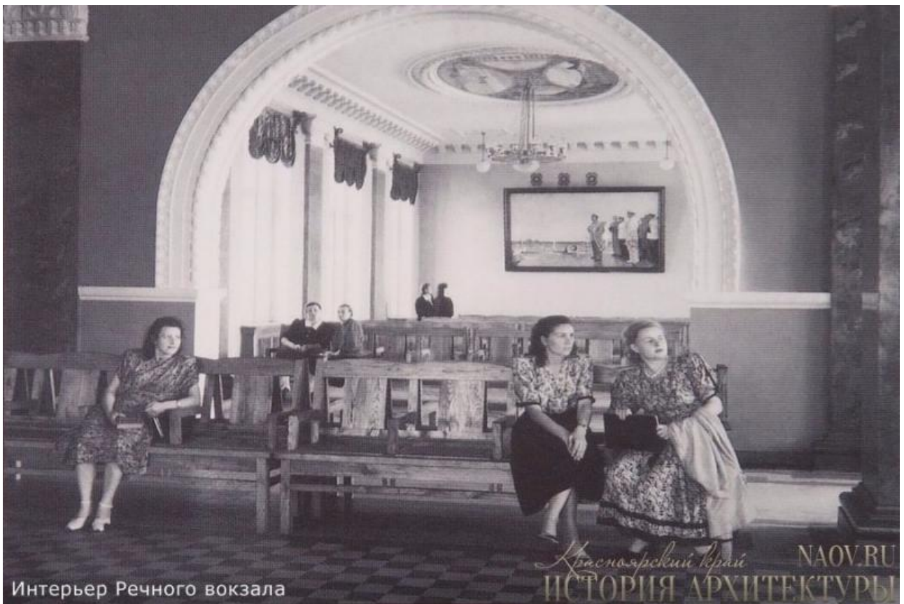
Интерьер Речного вокзала

1958 году мастера Художественного фонда сделали демонстрационную модель здания вокзала длиной три метра по заказу Енисейского пароходства. В том же году модель отправили на Всемирную выставку в Брюсселе, там она удостоилась серебряной медали.