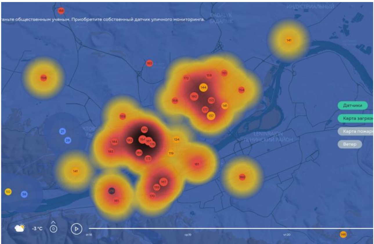
Так выглядит карта загрязнения воздуха в Красноярске днем 21 февраля

С 15 февраля Красноярск окутал густой смог. Власти трижды вводили режим неблагоприятных метеорологических условий (НМУ): с вечера 16 до вечера 17 февраля, затем с 18 по 20 февраля, и снова продлили до 22 февраля. 18 февраля город занял первое место в России по загрязненности воздуха.