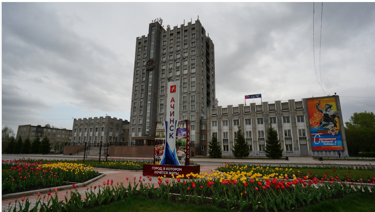
Автор: Ольга Новикова Фото из альбома "Красноярский край. Ачинск. Госструктуры" © Фотобанк "RuBabr"