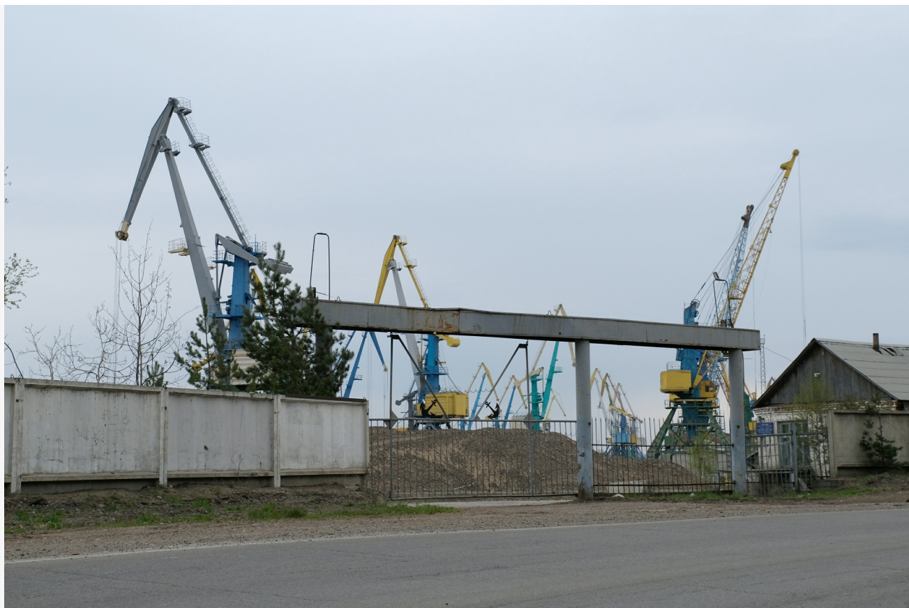
Автор: Алёна Штерн Фото из альбома "Красноярский край. Лесосибирск. Лето" © Фотобанк "RuBabr"