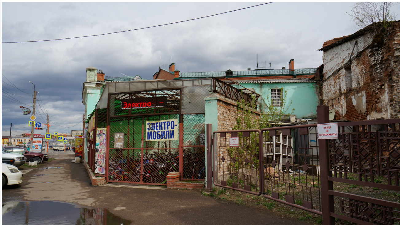
Автор: Ольга Новикова Фото из альбома "Красноярский край. Канск" © Фотобанк "RuBabr"