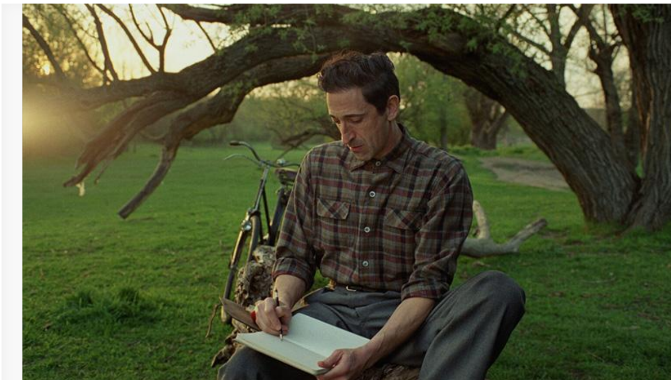
Эдриан Броуди в фильме «Бруталист»

Исполнитель главной роли в «Бруталисте» Эдриан Броуди к полученному в январе «Золотому глобусу» добавил и «Бронзовую маску» в категории «Лучший актёр», оставив не у дел Рэйфа Файнса из «Конклава», Хью Гранта из «Еретика», Тимоти Шаламе из «Боба Дилана: Никому не известный», Себастиана Стэна из «Ученика. Восхождение Трампа» и Колмана Доминго из «Синг-Синга».