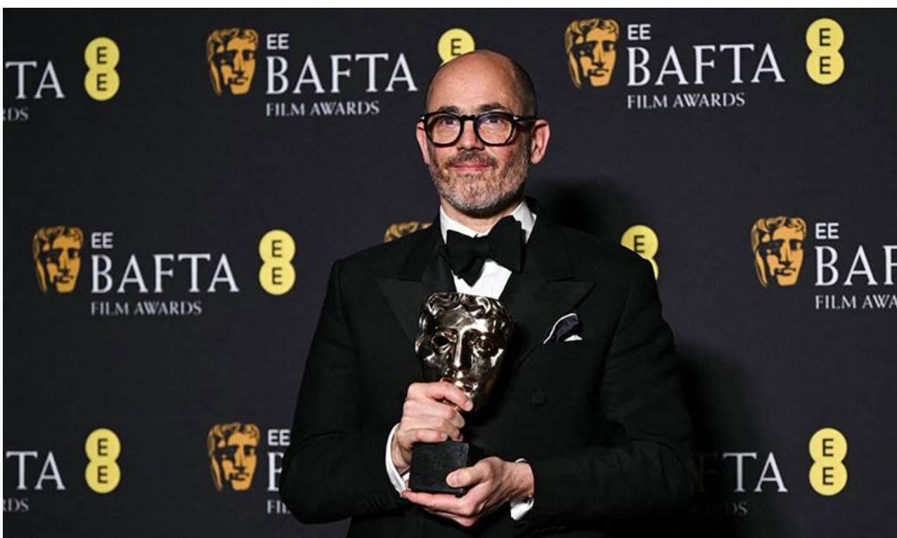
Эдвард Бергер с премией BAFTA за