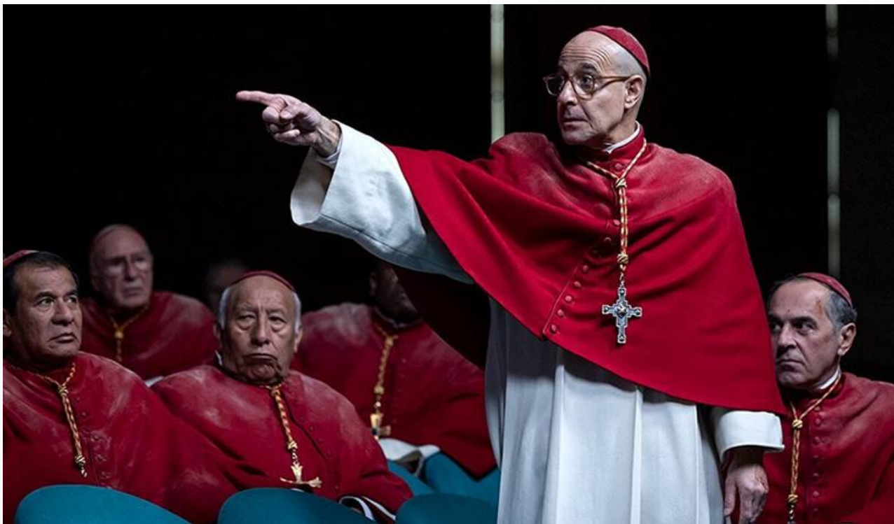
Кадр из фильма «Конклав»