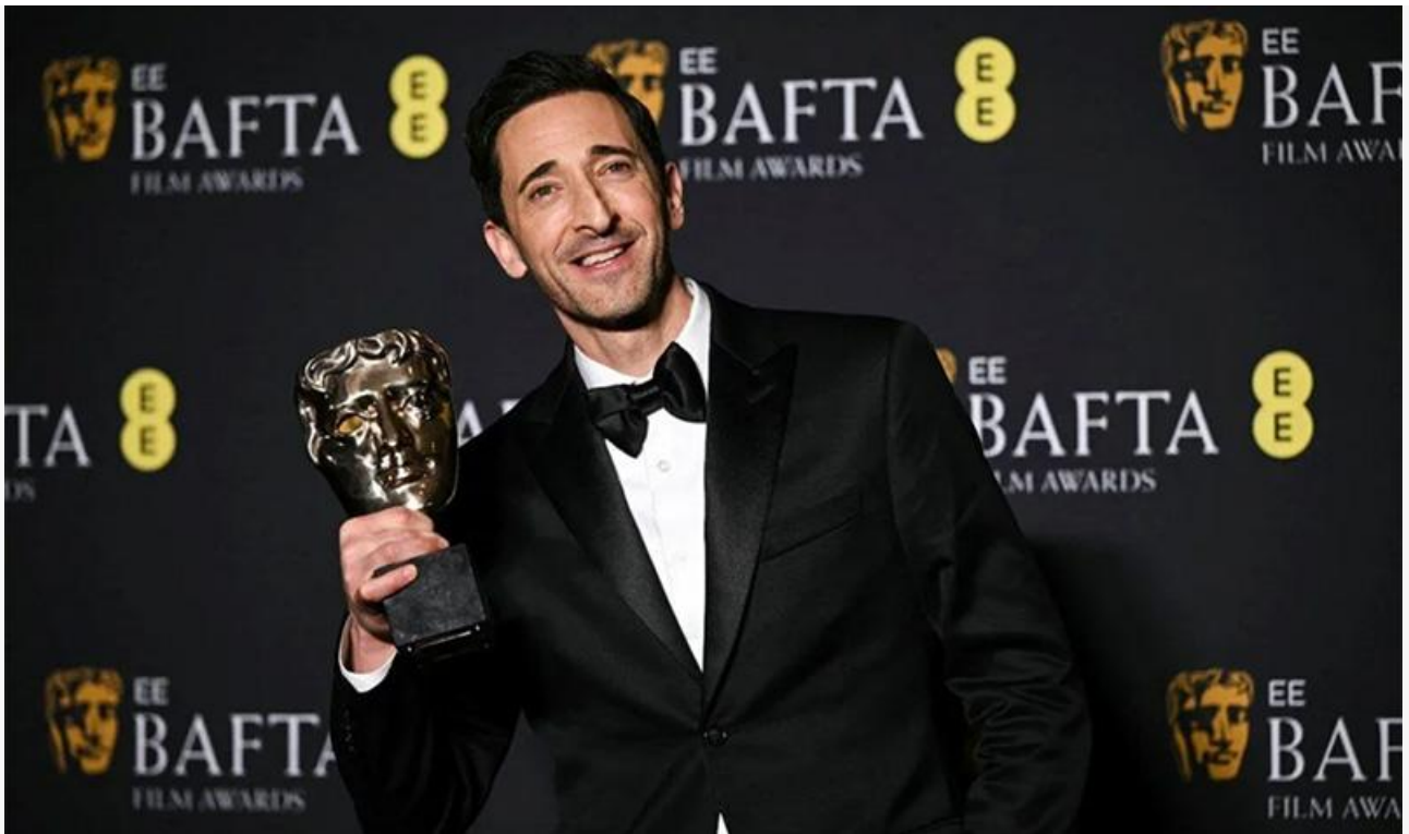
Эдриан Броуди с премией BAFTA