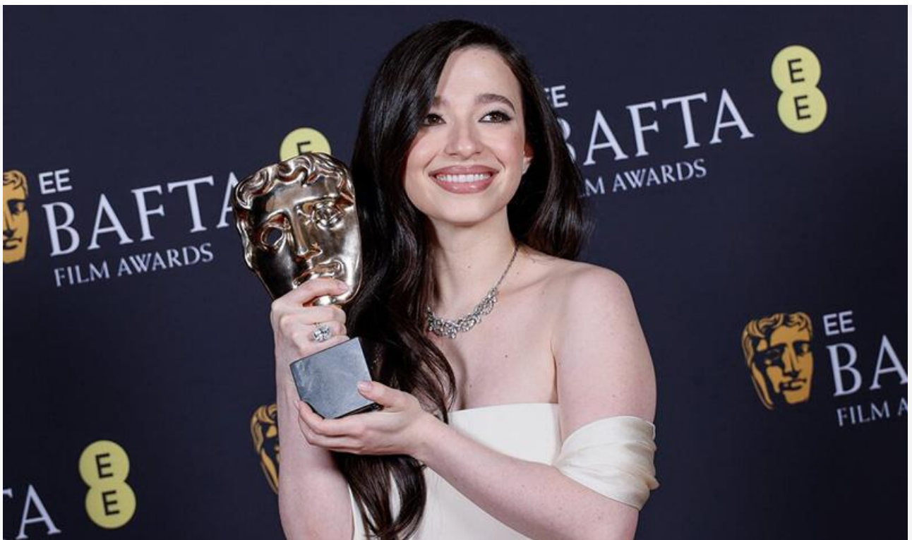
Майки Мэдисон с премией BAFTA

Сатирический боди-хоррор Корали Фаржа «Субстанция» довольствовался «Бронзовой маской» в категории «Лучший грим и причёски», а фэнтезийный мюзикл Джона М. Чу «Злая: Сказка о ведьме Запада» – двумя «Масками» в категориях «Лучшие костюмы» и «Лучшая работа художника-постановщика».