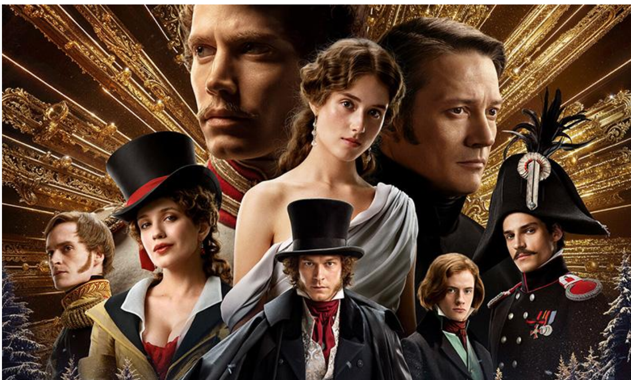
Постер к фильму «Пророк. История Александра Пушкина»