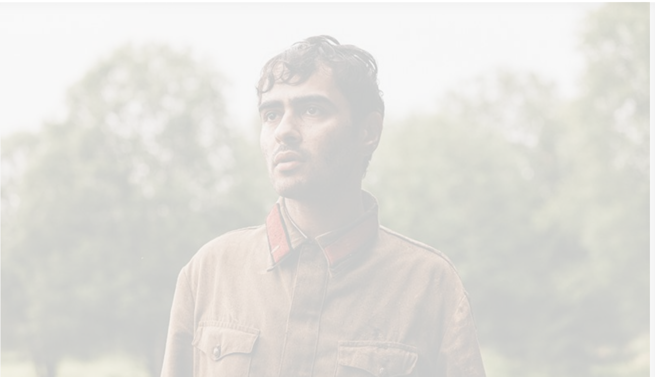
Давид Мхитарель в фильме «Война и