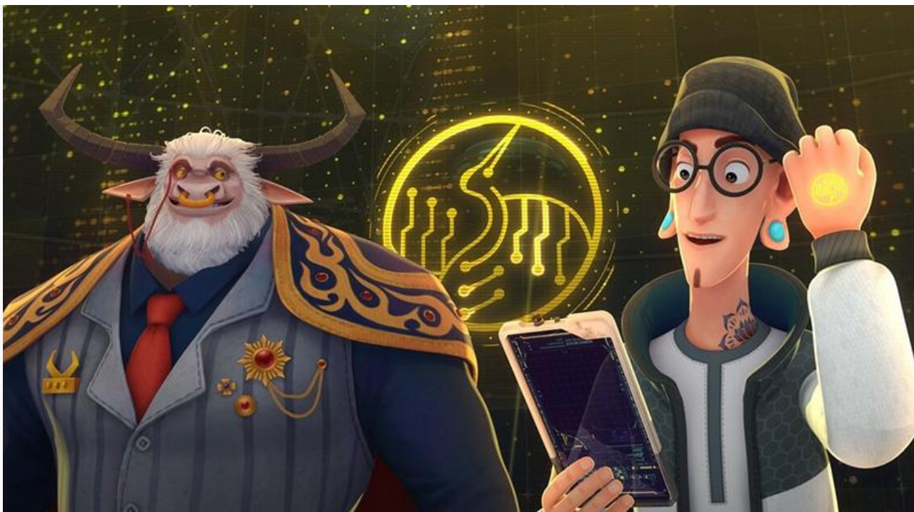
Кадр из фильма «Пигси: Путешествие сквозь время»