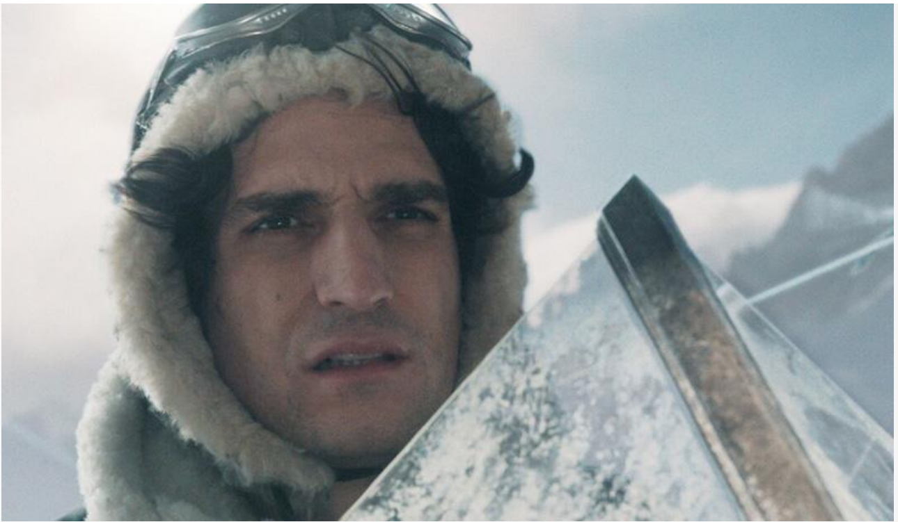
Луи Гаррель в фильме «Сент-Экзюпери»

Из старожилов проката места в десятке лидеров сохранили «Волшебник Изумрудного города. Дорога из жёлтого кирпича» (31,1 миллиона с потерей в сборах 35 % и четвёртое место), «Финист. Первый богатырь» (30,8 миллиона с потерей в сборах 38 % и пятое место), «Холоп. Великолепный век» (19,9 миллиона с потерей в сборах 65 % и седьмое место), «Плохая девочка» (18 миллионов с потерей в сборах 40 % и восьмое место) и «Василий» (17,4 миллиона с потерей в сборах 64 % и десятое место).