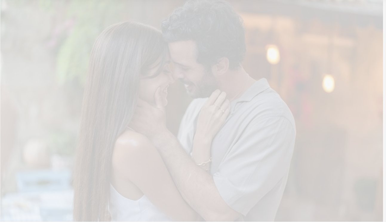
Ханде Эрчел и Барыш Ардуч в фильме «Оставь это ветру»

К слову, в битве «сарафанов» фильм Андреасяна также проигрывает: рейтинг «Оставь это ветру» на портале «Кинопоиск» – 7,5, рейтинг «Войны и музыки» – 6,3.