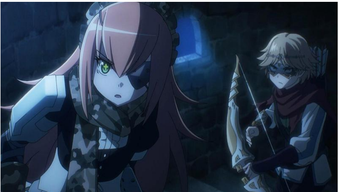
Кадр из фильма «Повелитель: Священное королевство»

Любителей фестивального кино порадуют драма Мигела Гомиша « Гранд тур » (18+), получившая приз за лучшую режиссуру на прошлогоднем Каннском кинофестивале, и драма Рунара Рунарссона « Снова наступит рассвет » (18+), на том же Каннском кинофестивале участвовавшая в конкурсной программе «Особый взгляд».