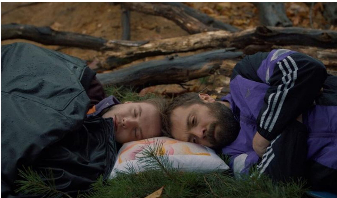
Кадр из фильма «Знакомство родителей»