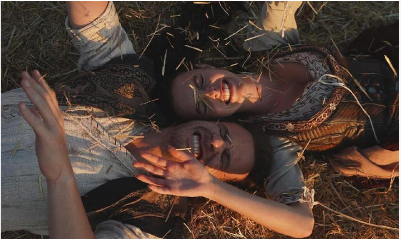
Кадр из фильма «Холоп. Великолепный век»

Покинули топ-10 «Домовёнок Кузя» , «Каяра. Путь судьбы» , «Лотерея» и «Астрал. Проклятие мёртвых» .