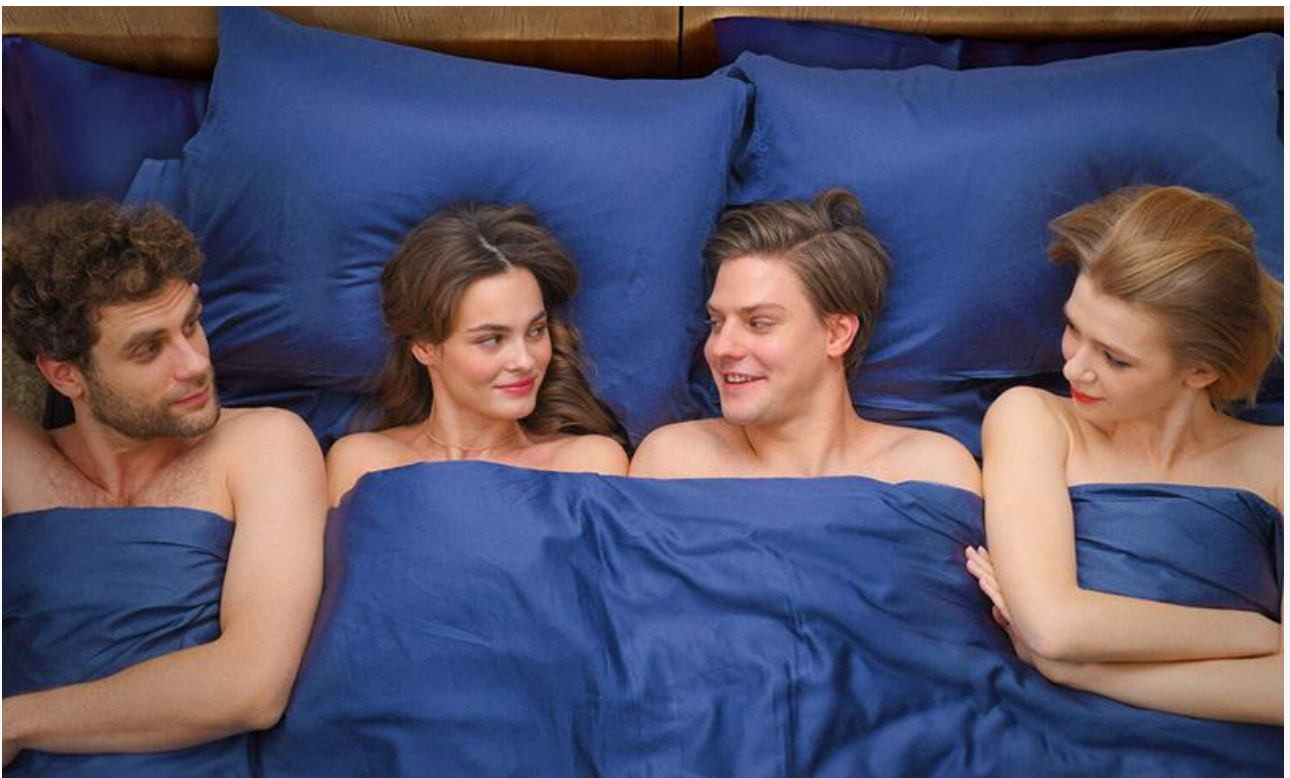
Постер к фильму «По любви»