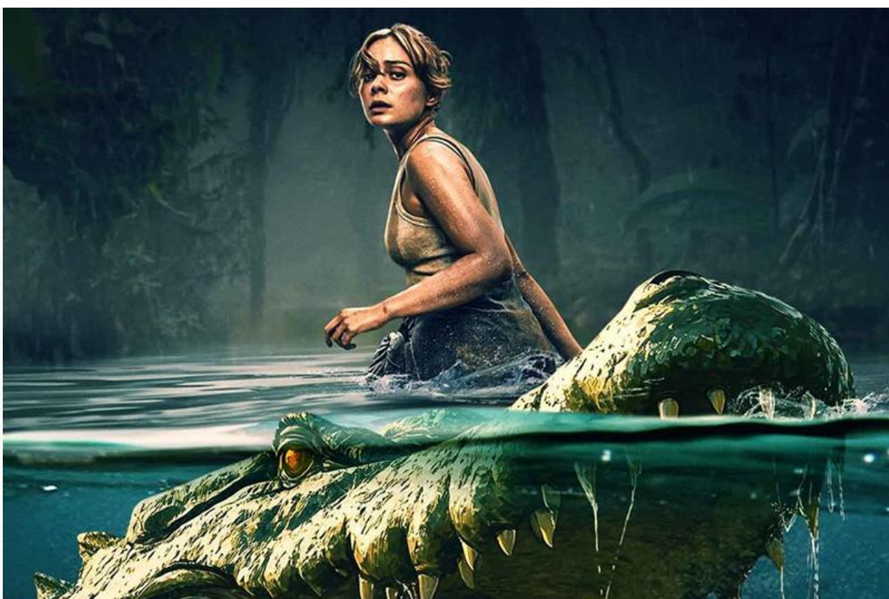
Постер к фильму «Абсолютный хищник»