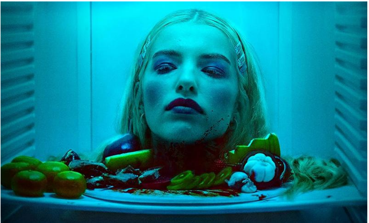
Постер к фильму «Субстанция: Идеал»