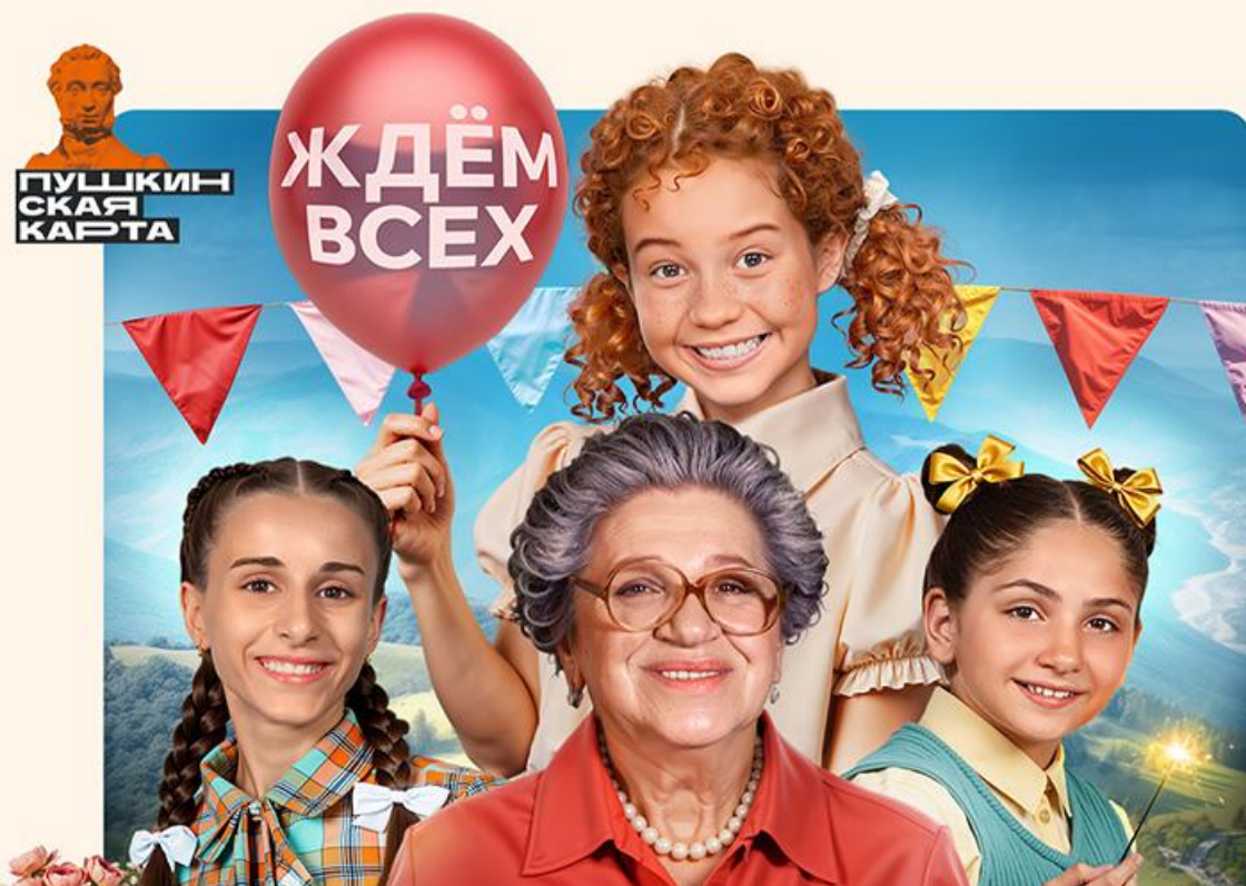
Постер к фильму «Манюня: День рождения Ба»