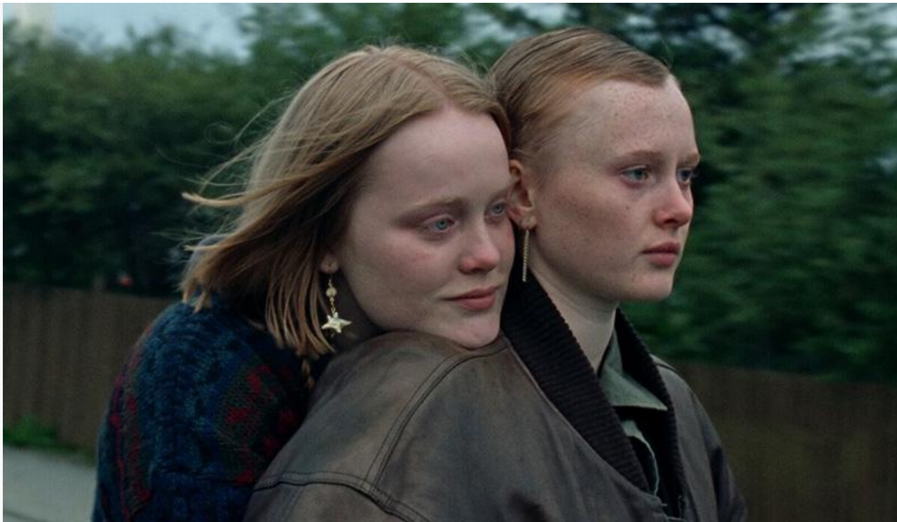
Кадр из фильма «Снова наступит рассвет»