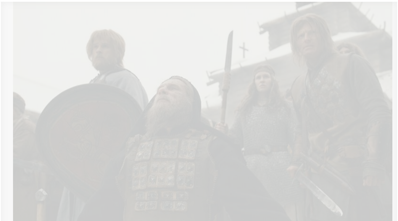
Кадр из фильма «Злой город»

По данным портала Kinobusiness.com, исторический боевик Константина Буслова « Злой город » потерял в сборах по сравнению с предыдущими стартовыми выходными сдержанные 29 % и на 2 309 экранах пополнил копилку на 100,3 миллиона рублей, сохранив за собой лидерство в прокате.